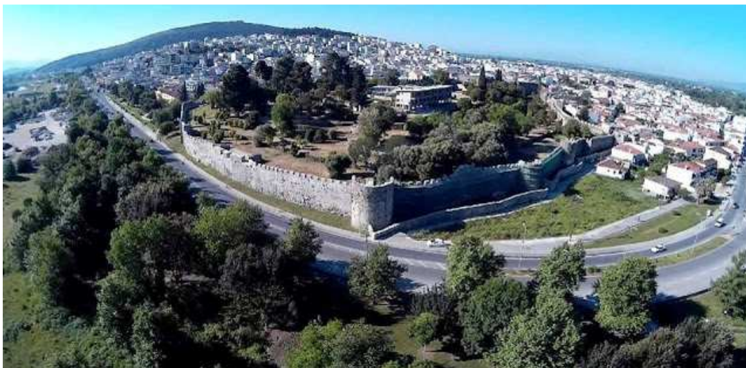
Εικόνα 1. Το κάστρο της Άρτας

Από την άλλη πλευρά η Άρτα αν και δεν βρέχεται από θάλασσα, έχει έναν άλλο υγρό θησαυρό, τον Άραχθο, ο οποίος αποτελεί μόνο ένα από τα πολλά δυνατά χαρτιά της Άρτας στον τομέα του τουρισμού.