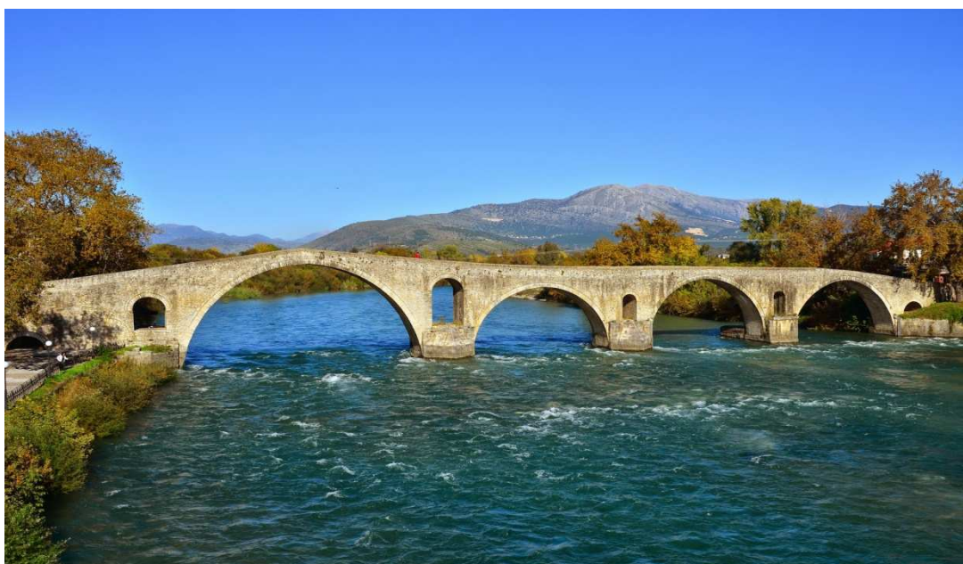
Εικόνα 3: Το γεφύρι της Άρτας

Όχι μόνο λόγω του ιστορικού Γεφυριού της Άρτας αλλά και πολλών άλλων πολιτιστικών μνημείων, όπως το τείχος της Αμβρακίας και το Κάστρο, το Ναό της Παναγίας Παρηγορήτισσας, το Ναό της Αγίας Θεοδώρας τον ορεινό όγκο των Τζουμέρκων και τον Αμβρακικό Κόλπο.