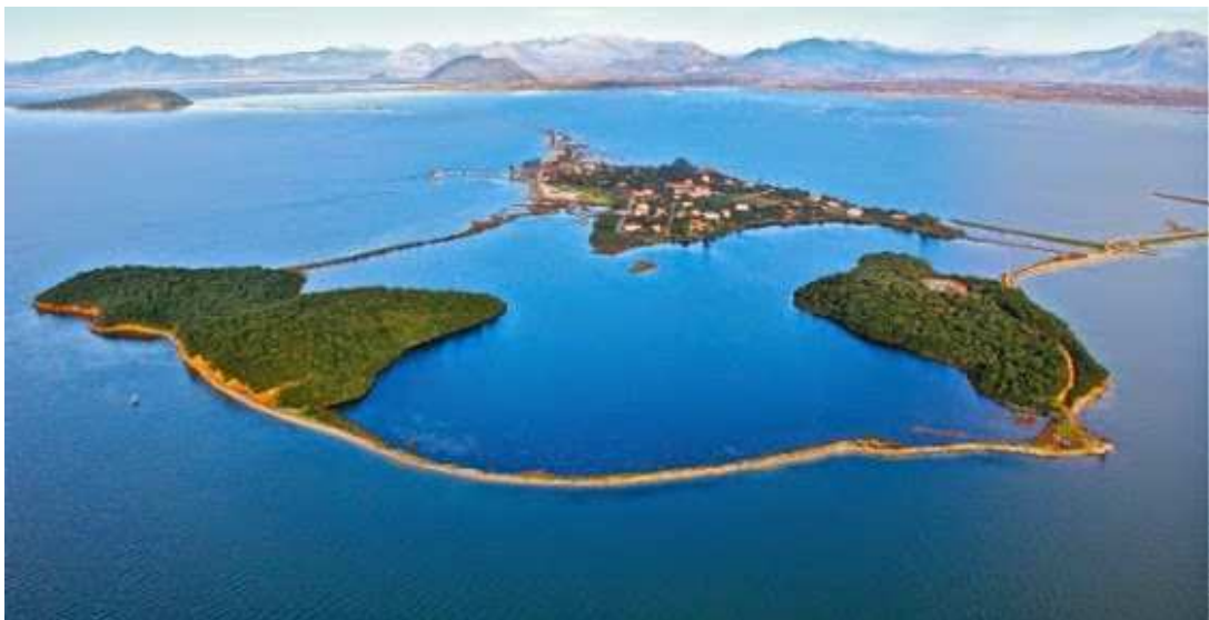
Εικόνα 5: Κορωνησία

Τόσο η Ροδαυγή όσο και η Κορωνησία θεωρούνται από τα δημοφιλέστερα χωριά του Δήμου Αρταίων και στα χωριά τα οποία ο Δήμος δίνει ιδιαίτερη βαρύτητα στο πρόγραμμα της τουριστικής του προβολής.