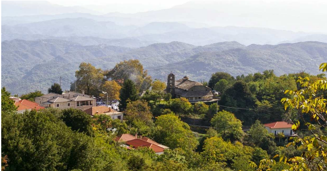
Εικόνα 4: Ροδαυγή Άρτας

Τόσο η Ροδαυγή όσο και η Κορωνησία θεωρούνται από τα δημοφιλέστερα χωριά του Δήμου Αρταίων και στα χωριά τα οποία ο Δήμος δίνει ιδιαίτερη βαρύτητα στο πρόγραμμα της τουριστικής του προβολής.