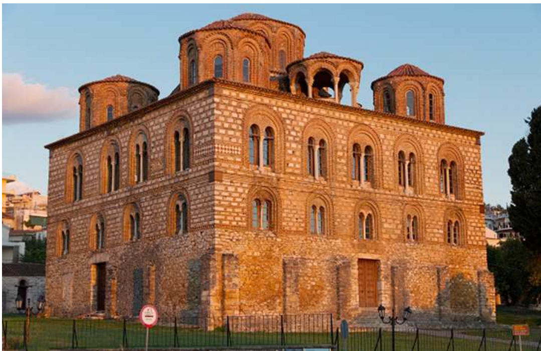
Εικόνα 2: Παρηγορήτισσα

Η Περιφερειακή Ενότητα Άρτας και ειδικότερα ο Δήμος Αρταίων, έχει χαρακτηριστεί ως τουριστικός τόπος από το 1924 (αριθ. ΦΕΚ 312/Α/16-12-1924), στην συνέχεια το 1973 (ΦΕΚ 84/Α/24-1-1973) και το 1976 με το ΠΔ 889/1976 (ΦΕΚ 329/Α/10-12-1976).