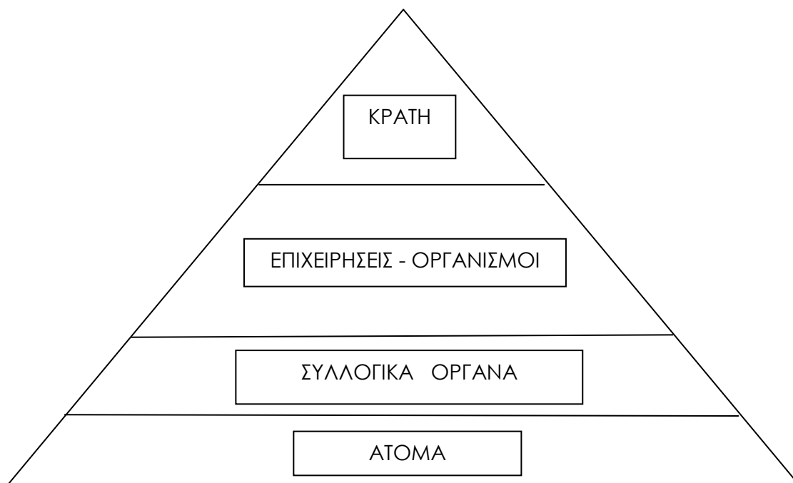
Σχήμα 6.1: Η πυραμίδα των διαπραγματεύσεων, Πηγή: Ιδία επεξεργασία