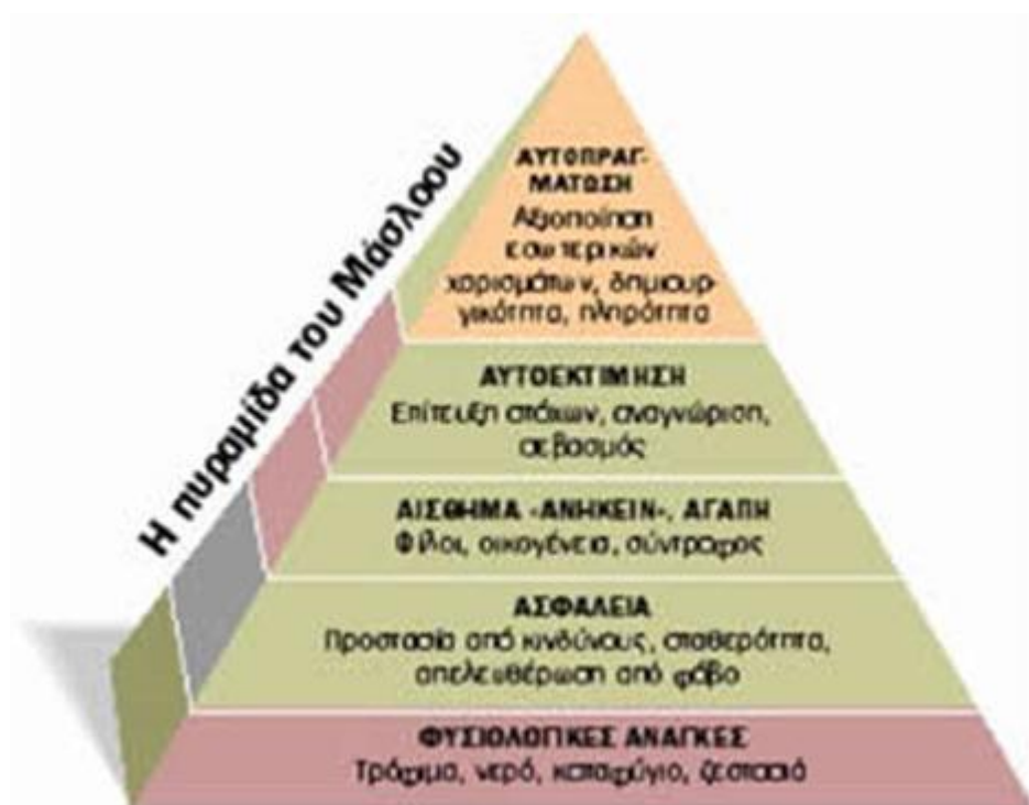
Πυραμίδα του Maslow.

Κατά κανόνα, προτεραιότητα δόθηκε στην επιβίωσή του, στοχεύοντας στο να βρει τρόπους που θα τον διευκολύνουν στην επίτευξη αυτού του στόχου. Η ιεράρχηση των αναγκών, υποστηρίζεται από διάφορους οικονομολόγους και κοινωνιολόγους, ακολουθεί μια συγκεκριμένη δομή. Ο γνωστός οικονομολόγος A. Maslow, έδωσε τη δική του θεωρία, σχεδιάζοντας την