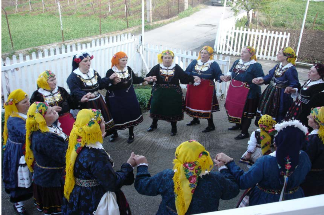
Ph. 4 3.1. Επίσκεψη των «Λαζαρίνων» στα σπίτια της κοινότητας. Σάββατο του Λαζάρου, 2007.