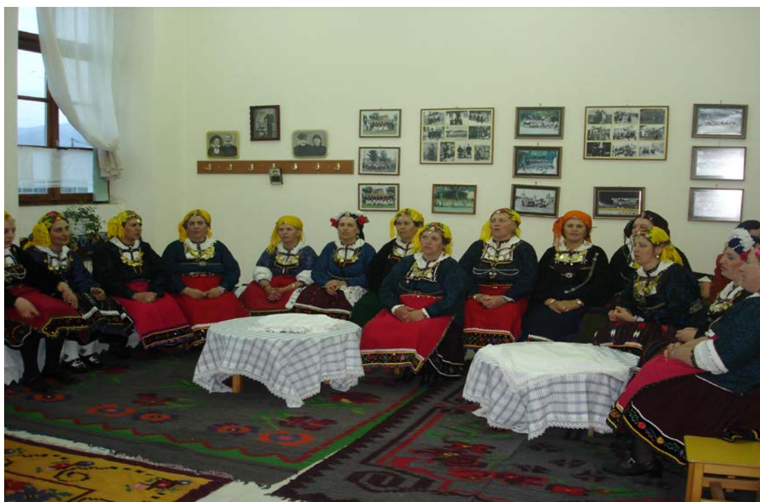
Ph. 9 3.1. Οι «Λαζαρίνες» στο Κονάκι. Σάββατο του Λαζάρου, 2007.