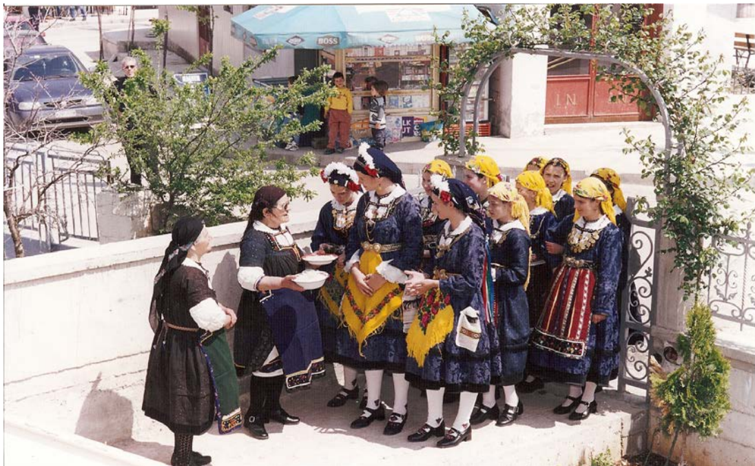
Ph. 3 3.1. Επίσκεψη των «Λαζαρίων» στα σπίτια της κοινότητας, Σάββατο του Λαζάρου, 2000.