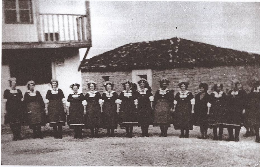
Ph. 10 3.3. Οι «Λαζαρίνες» με τις παραδοσιακές φορεσιές στην πλατεία, πριν το 1950.