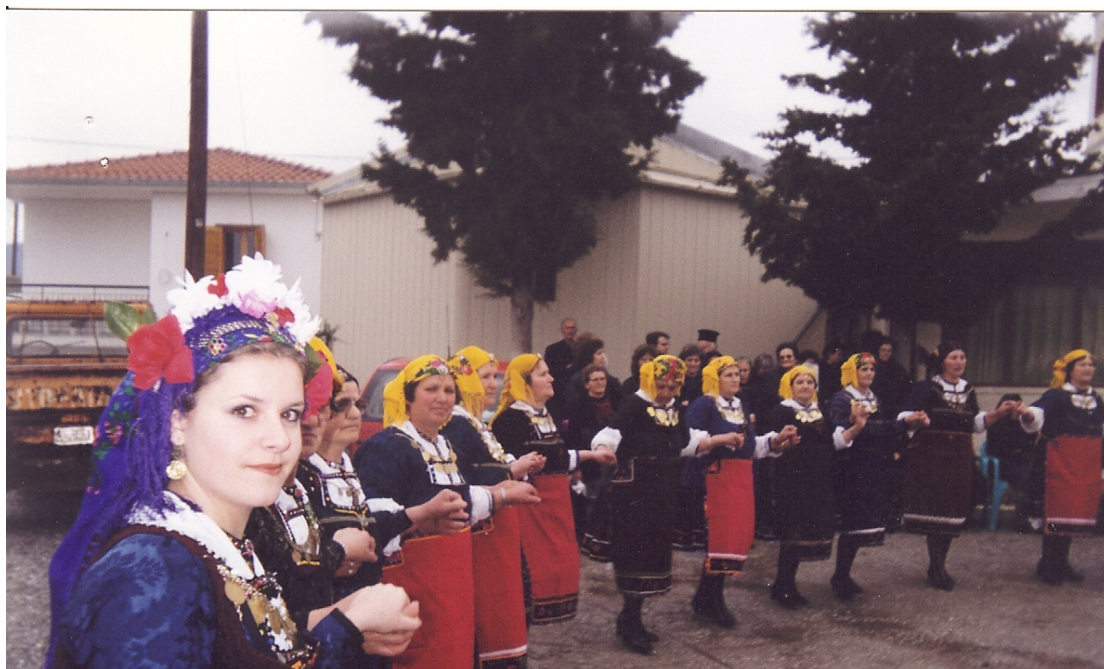
Ph. 12 3.4. «Αναβίωση» του Εθίμου της «Λαζαρίνας» στην πλατεία της Αγίας Παρασκευής, 1999.