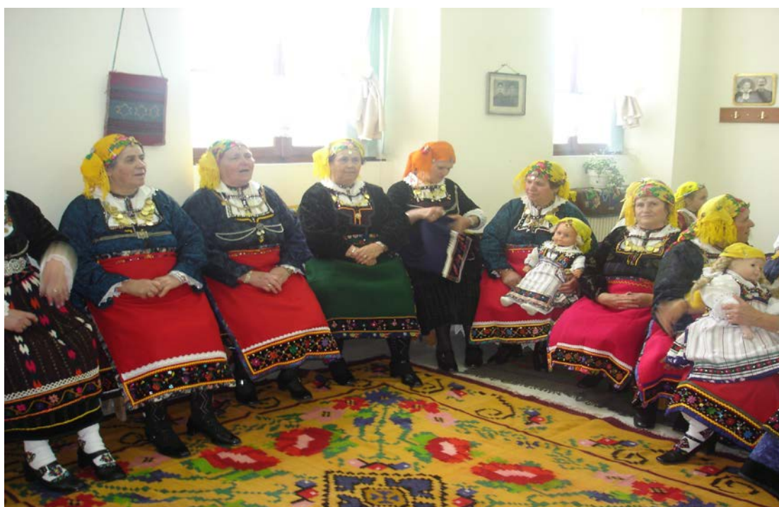
Ph. 7 3.1. Οι «Λαζαρίνες» στο Κονάκι. Σάββατο του Λαζάρου, 2007.