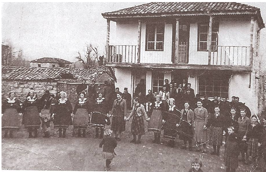
Ph. 11 3.3. Οι «Λαζαρίνες» με τις παραδοσιακές φορεσιές και τα «ευρωπαϊκά» ρούχα στην πλατεία το 1958.