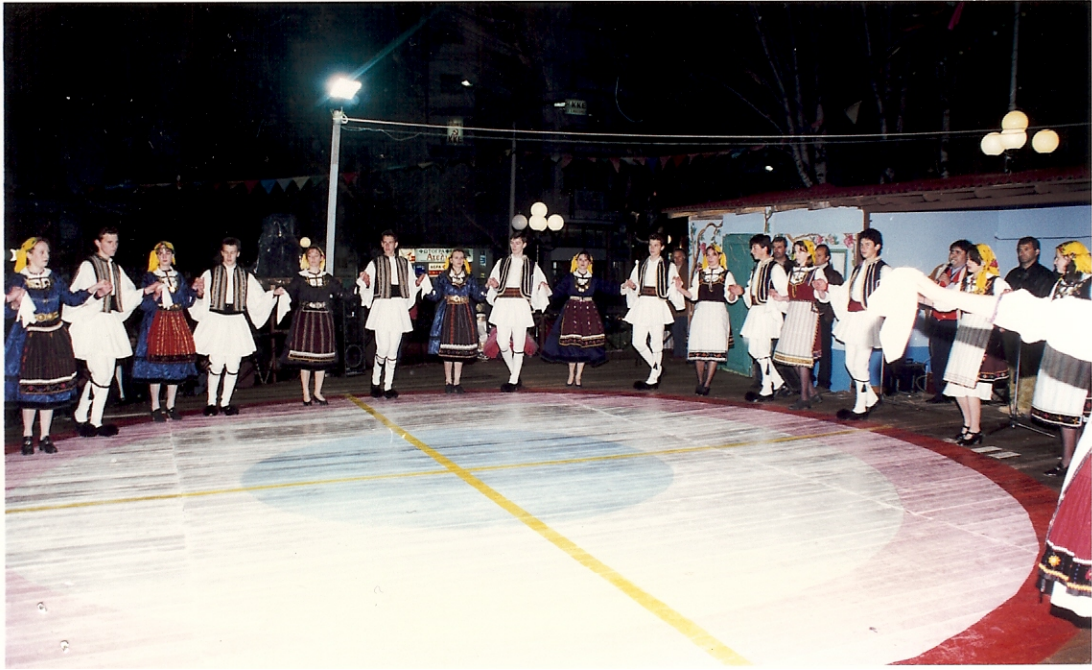
Ph. 2 2.1. Χορευτικό συγκρότημα του Συλλόγου Αγίας Παρασκευής, Αποκριάτικες εκδηλώσεις, Κοζάνη, 1997. Η διοργάνωση ανήκει της ΔΕΠΑΚ.