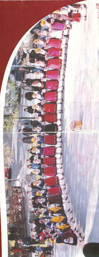
Ph. 14 4.3. Πρόγραμμα της Διημερίδας Πολιτισμού και του 1 ου Σεμιναρίου Παραδοσιακών χορών από τον Πολιτιστικό Σύλλογο Λευκοπηγής, 2006.