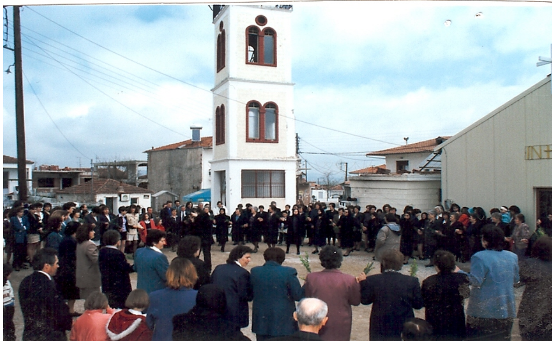
Ph. 6 3.1. Στην πλατεία της κοινότητας, μετά το πέρας της Θείας Λειτουργίας. Κυριακή των Βαΐων, 1997.