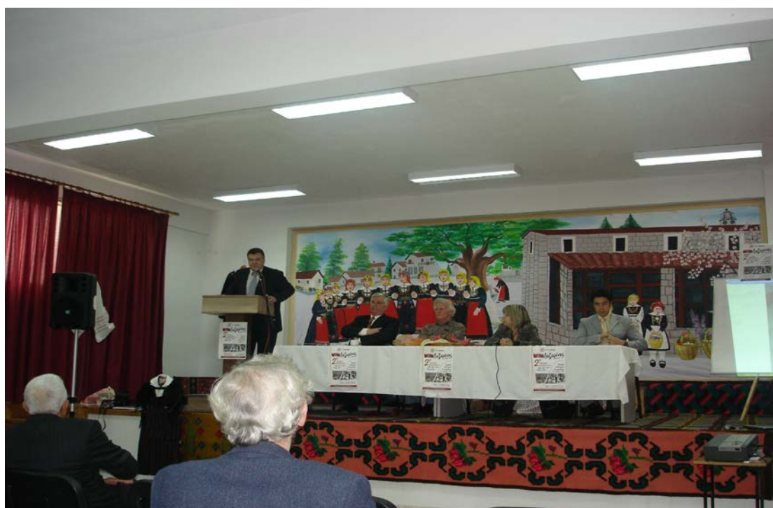
Ph. 13 4.1. Διοργάνωση Δημερίδας και Σεμιναρίου από τον Πολιτιστικό Σύλλογο Λευκοπηγής, 2007.