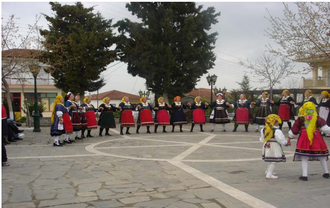
Ph. 5 3.1. Λαζαριάτικος Χορός στην πλατεία της Αγίας Παρασκευής. Σάββατο του Λαζάρου, 2007.