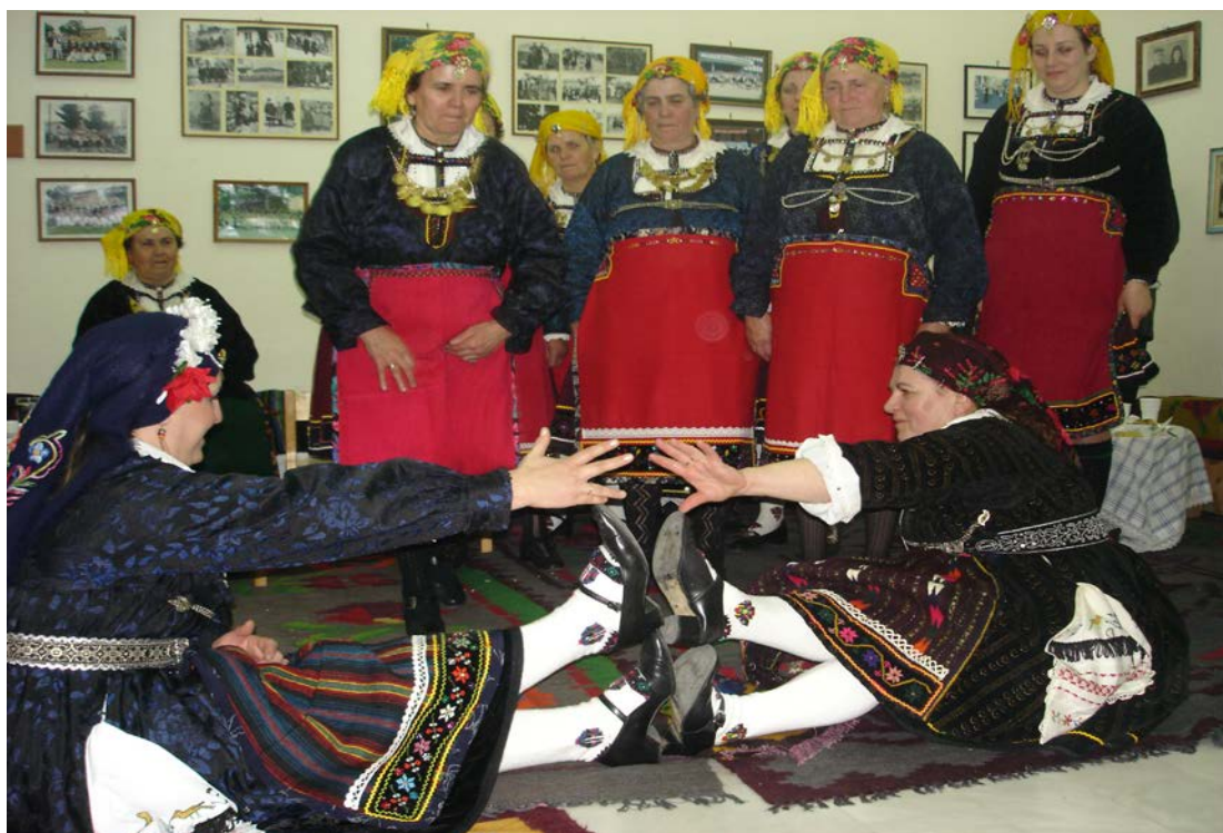
Ph. 8 3.1. Τα παιχνίδια των «Λαζαρινών» στο Κονάκι. «Αναβίωση» Εθίμου στο πλαίσιο του Συλλόγου Αγίας Παρασκευής. Σάββατο του Λαζάρου, 2007.