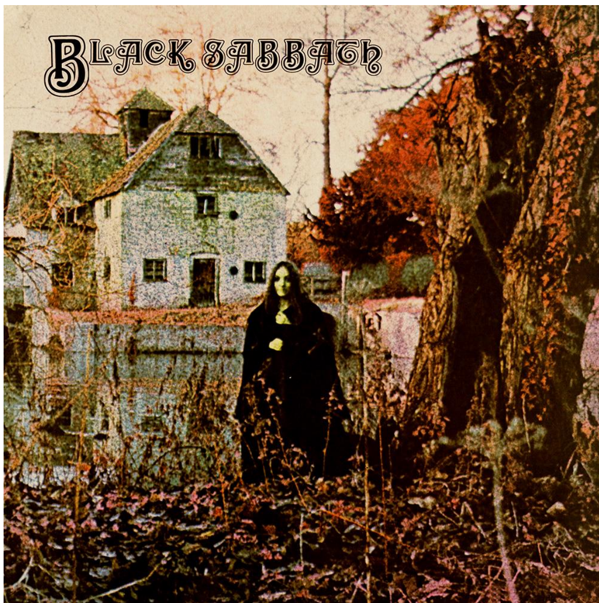
Εικόνα 4.1: Το εξώφυλλο του ομότιτλου ντεμπούτου δίσκου των Black Sabbath που κυκλοφόρησε το 1970, με τα γοτθικά στοιχεία και τη συνολική γοτθική ατμόσφαιρα να είναι εμφανής.