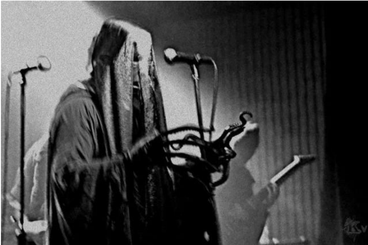
Εικόνα 4.12: Ο Curator (πραγματικό όνομα άγνωστο), τραγουδιστής του black metal συγκροτήματος Portal, με την ιδιαίτερη εμφάνιση του στον τομέα του ρουχισμού. Τα γάντια που φοράει έχουν πλοκάμια, τα οποία όπως αναφέρθηκε και στο τέταρτο κεφάλαιο παραπέμπουν στον Cthulhu, το πιο γνωστό πλάσμα του συγγραφέα H. P. Lovecraft.