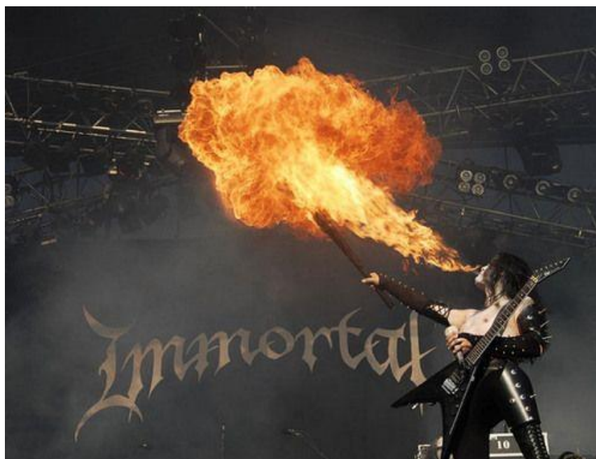
Εικόνα 4.11: Ο Olve Eikemo, γνωστός με το ψευδώνυμο Abbath, κιθαρίστας του νορβηγικού black metal συγκροτήματος Immortal, χρησιμοποιώντας την τεχνική του fire breathing επί σκηνής, κατά τη διάρκεια συναυλίας. Φαίνεται και η χαρακτηριστική ενδυμασία της black metal σκηνής, με δερμάτινα ρούχα και καρφιά μεταξύ άλλων.