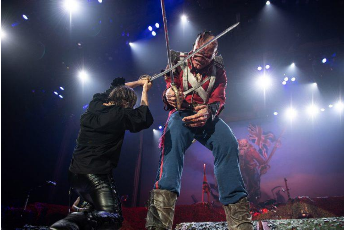
Εικόνα 4.10: Ο Bruce Dickinson, «μονομαχώντας» επί σκηνής με τον Eddie, τη μασκότ του συγκροτήματος, κατά τη διάρκεια συναυλίας.