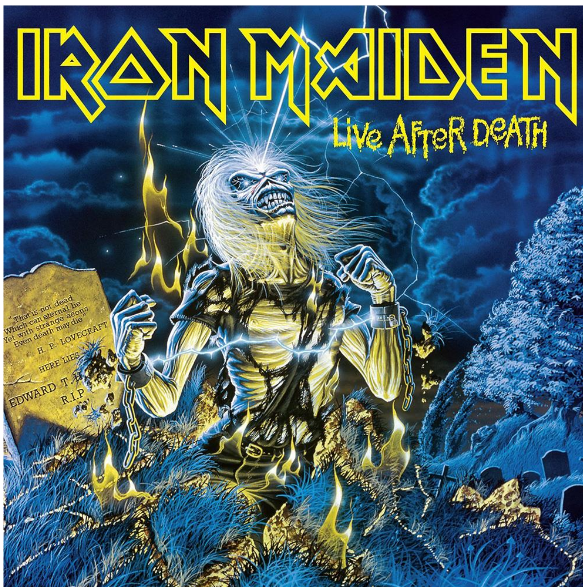
Εικόνα 4.5: Το εξώφυλλο του live δίσκου «Live after Death» των Iron Maiden, όπου στη ταφόπλακα φαίνεται η γνωστή φράση της ιστορίας «The Nameless City» του Lovecraft, με το όνομα του συγγραφέα λίγο παρακάτω.