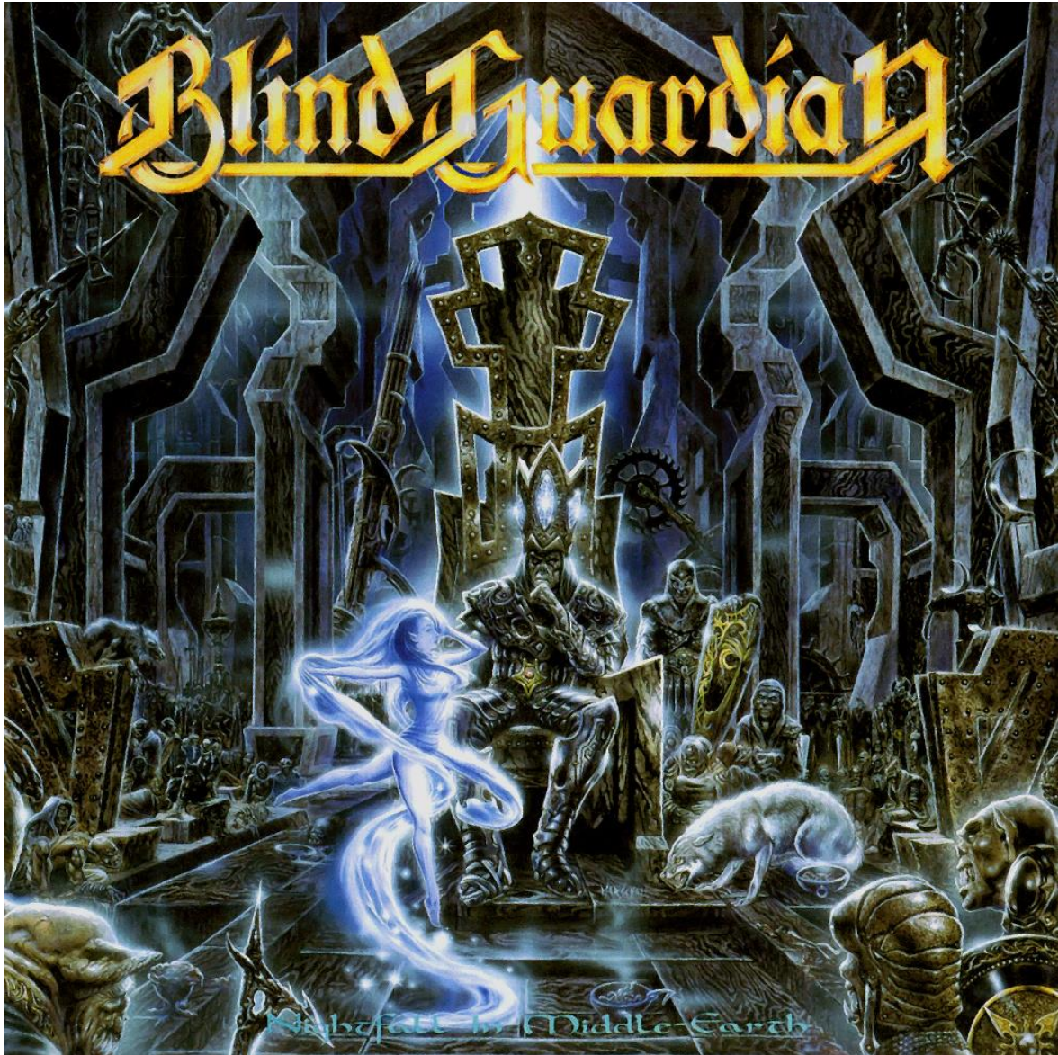
Εικόνα 4.2: Το εξώφυλλο του concept δίσκου του heavy/power metal γερμανικού συγκροτήματος Blind Guardian με τίτλο «Nightfall in Middle-Earth», το οποίο όπως αναφέρθηκε προηγουμένως βασίζεται στο βιβλίο «The Silmarillion» (1977) του Tolkien. Απεικονίζονται γνωστοί χαρακτήρες της μυθολογίας του Tolkien, όπως ο Morgoth (η μορφή στο θρόνο) και η Lúthien (η θηλυκή μορφή που χορεύει).