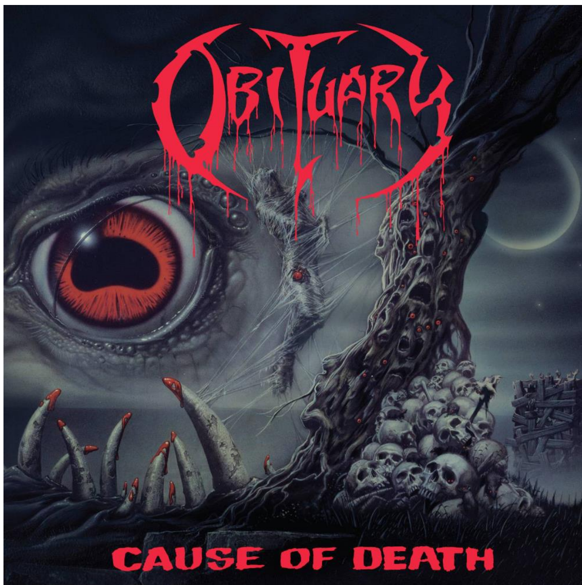
Εικόνα 4.6: Το εξώφυλλο του δίσκου «Cause of Death» του αμερικάνικου death metal συγκροτήματος Obituary. Όπως αναφέρθηκε στο 4ο κεφάλαιο, σχεδιάστηκε από τον Michael Whelan και χρησιμοποιήθηκε σε συλλογή διηγημάτων του H. P. Lovecraft. Ο τίτλος του είναι «Lovecraft's Nightmare A».