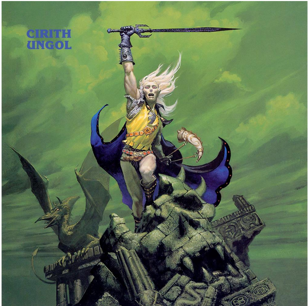
Εικόνα 4.3: Το εξώφυλλο του πρώτου δίσκου του heavy/doom metal συγκροτήματος Cirith Ungol, Frost and Fire (1981). Απεικονίζει τον χαρακτήρα Elric του Moorcock, σε σχεδιασμό του Michael Whelan που έκανε για το βιβλίο της σειράς του Elric με τίτλο «Stormbringer».