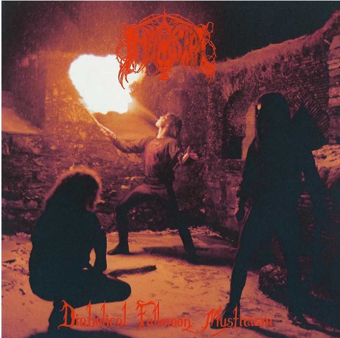
Εικόνα 4.7: Το εξώφυλλο του δίσκου «Diabolical Fullmoon Mysticism» (1992) του νορβηγικού black metal συγκροτήματος Immortal, στο οποίο απεικονίζεται η τεχνική του fire breathing που αναφέρεται στο 4ο κεφάλαιο, σε τοποθεσία που παραπέμπει σε ευρύτερη μεσαιωνική αισθητική.