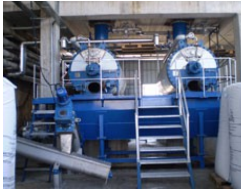
Εικόνα 18. Μονάδα Αδρανοποίησης Υποπροϊόντων Σφαγείου. ΜΟΝΑΔΑ ΠΑΡΑΓΩΓΗΣ ΟΡΓΑΝΟΧΟΥΜΙΚΟΥ ΛΙΠΑΣΜΑΤΟΣ ΑΠΟ ΑΧΥΡΟΣΤΡΩΜΝΕΣ ΠΤΗΝΟΤΡΟΦΕΙΩΝ

Το εργοστάσιο βρίσκεται στην Κληματιά Ιωαννίνων και με την μέθοδο της αερόβιας ζύμωσης μετατρέπει την κοπριά των κοτόπουλων σε οργανικό φυσικό λίπασμα κατάλληλο για όλες τις καλλιέργειες. Το εργοστάσιο κατασκευάστηκε το 2004 και η δυναμικότητα του είναι 2500 τόννους ετησίως. Στα σχέδια του Συνεταιρισμού βρίσκεται η επέκταση του εργοστασίου και ο διπλασιασμός της παραγωγής του. Κύρια προϊόντα του εργοστασίου είναι το Αγροσύν και το Αγροσύν bio τα οποία είναι φυσικά οργανικά λιπάσματα από κοπριά κότας.