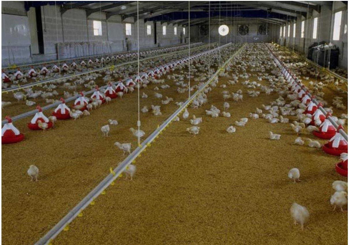
Εικόνα 12. Πτηνοτροφείο του Α.Π.Σ.Ι. ΠΙΝΔΟΣ.