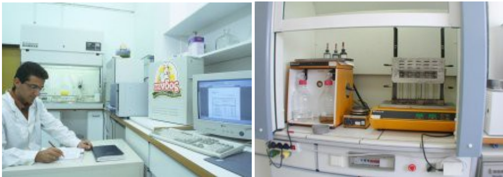
Εικόνα 17. Εργαστήρια του Α.Π.Σ.Ι. ΠΙΝΔΟΣ.

Το εργαστήριο είναι πιστοποιημένο με ISO 17025/2005 και είναι στελεχωμένο με επιστήμονες πολλών ειδικοτήτων.