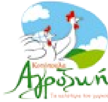
Εικόνα 8. Το λογότυπο της ΑΓΡΟΖΩΗΣ.

Η πτηνοτροφική επιχείρηση ΑΓΡΟΖΩΗ εδρεύει στην Ν. Αρτάκη Ευβοίας και ανήκει στον όμιλο επιχειρήσεων του συνεταιρισμού από το 2001 μετά την εξαγορά της εταιρείας ΣΥΝΚΟ Α.Ε.. Πρόκειται για πλήρως καθετοποιημένη παραγωγή στην οποία πραγματοποιούνται συνεχείς ποιοτικοί έλεγχοι.