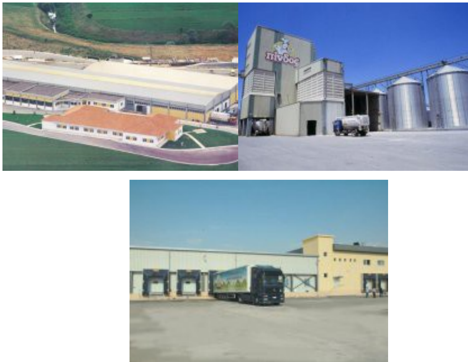
Εικόνα 11. Άποψη της εργοστασιακής μονάδας του Α.Π.Σ.Ι. ΠΙΝΔΟΣ.

Οι εγκαταστάσεις του Α.Π.Σ.Ι. ΠΙΝΔΟΣ περιλαμβάνουν πτηνοτροφικές μονάδες, εκκολαπτήριο, εργοστάσια ζωοτροφών, πτηνοσφαγεία και διάφορες μονάδες που περιγράφονται αναλυτικά παρακάτω.