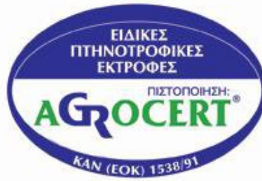
Εικόνα 27. Το λογότυπο για την πιστοποίηση AGROCERT.