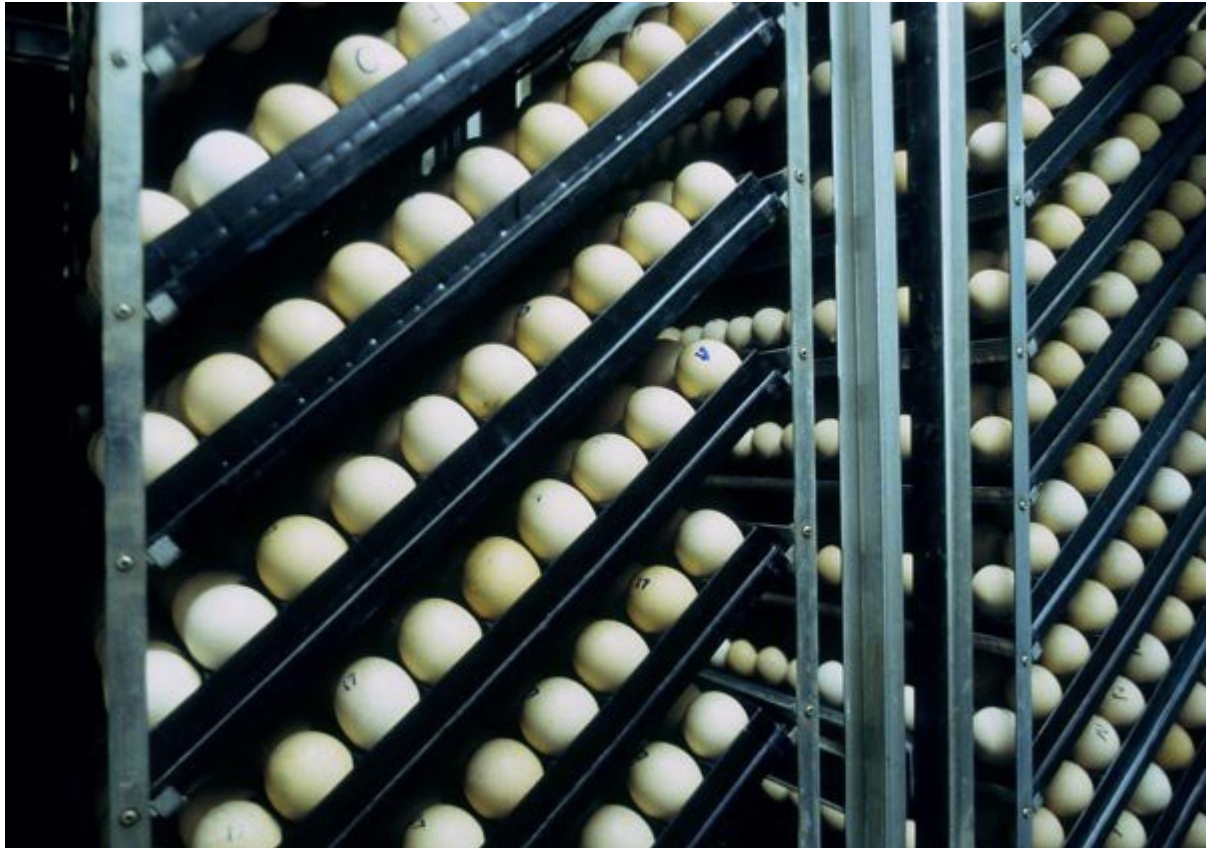
Εικόνα 13. Εκκολαπτήρια του Α.Π.Σ.Ι. ΠΙΝΔΟΣ.

Εφαρμόζει σύστημα διαχείρισης ασφάλειας τροφίμων ISO 22000:2005 και είναι στελεχωμένο με κτηνιάτρους και γεωπόνους.