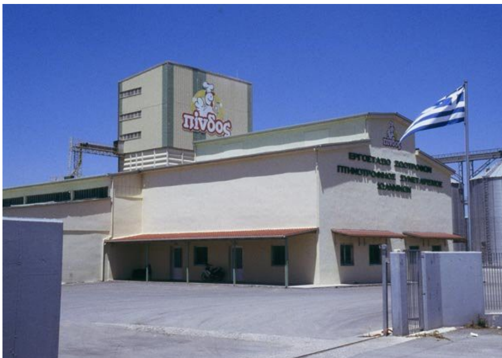
Εικόνα 14. Εργοστάσιο ζωοτροφών του Α.Π.Σ.Ι. ΠΙΝΔΟΣ.

Όλα τα εργοστάσια έχουν πιστοποιηθεί με σύστημα διαχείρισης ασφάλειας τροφίμων ISO 22000:2005 , διαθέτουν χημικά εργαστήρια για τον έλεγχο των πρώτων υλών, αλλά και των τελικών προϊόντων και είναι στελεχωμένα με διατροφολόγους.