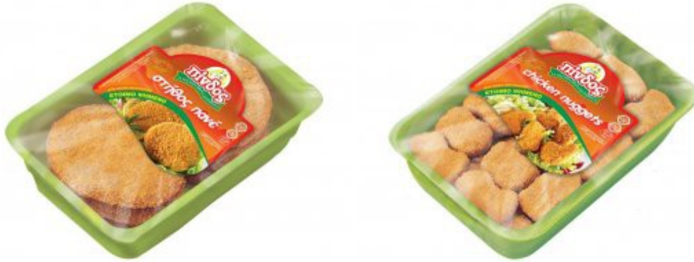
Εικόνα 21. Προϊόντα νοπά από τη σειρά «έτοιμα ψημένα» ΠΙΝΔΟΣ.