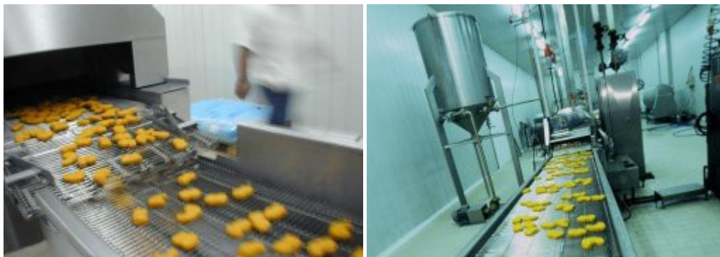
Εικόνα 16. Διαδικασία παραγωγής έτοιμων ψημένων προϊόντων ΠΙΝΔΟΣ.

Κατασκευάστηκε το 1996 και έχει δυναμικότητα 500 Kg/ώρα. Η διαδικασία παραγωγής έτοιμων ψημένων προϊόντων γίνεται από αυτοματοποιημένα μηχανήματα και η πρώτη ύλη που χρησιμοποιείται είναι φρέσκα νωπά κοτόπουλα "ΠΙΝΔΟΣ".