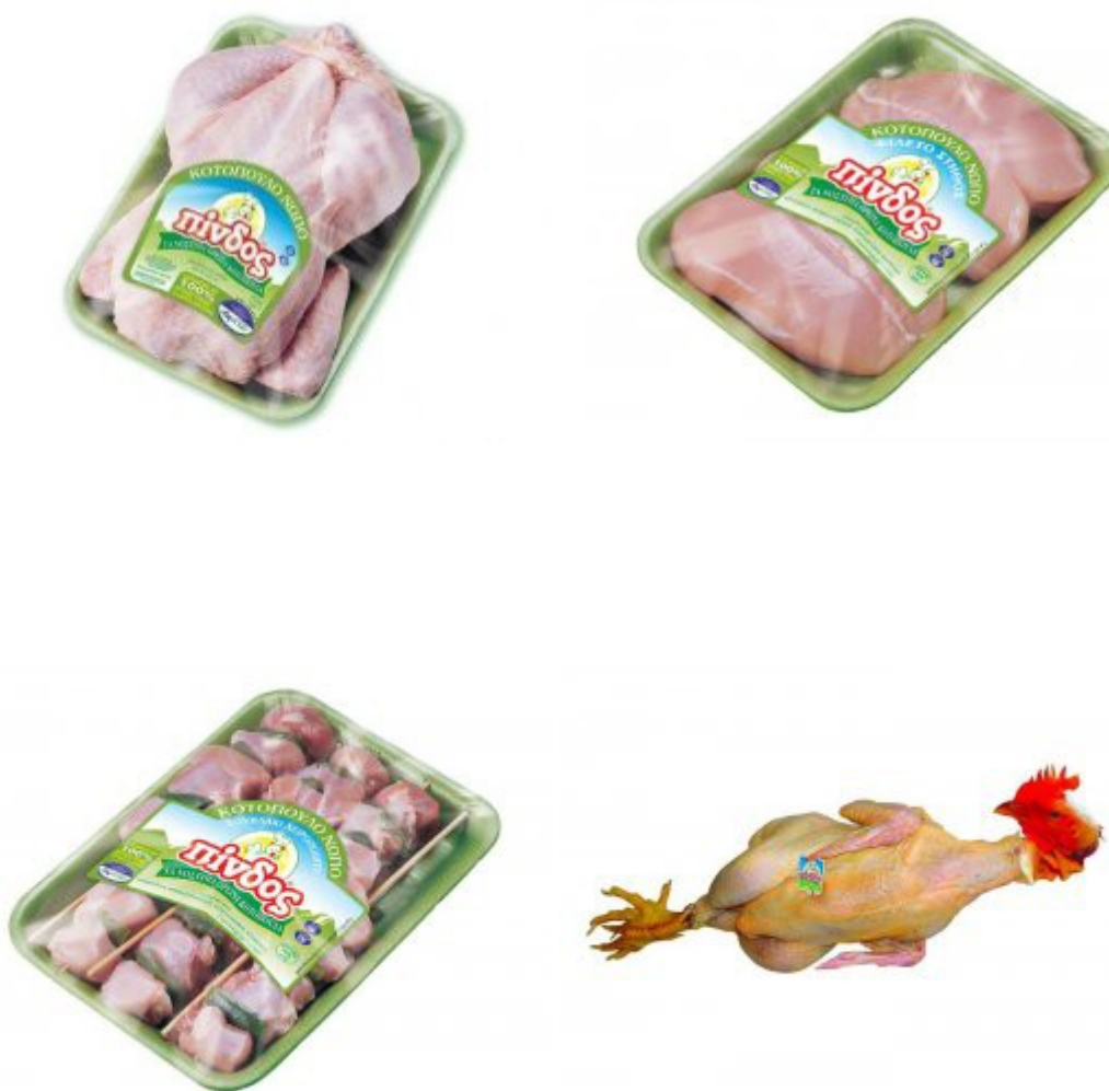
Εικόνα 19. Προϊόντα από νοπά κοτόπουλα ΠΙΝΔΟΣ.