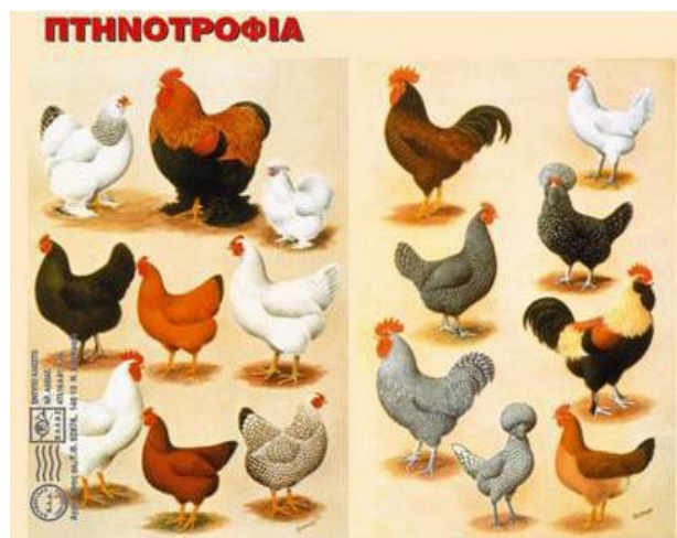
Εικόνα 1. Γραμματόσημο των ελληνικών ταχυδρομείων με διάφορες φυλές ορνιθων

Οι πιο αντιπροσωπευτικές ξενικές φυλές ορνιθων είναι οι ακόλουθες: Plymouth Rock , Wyandotte , Rhode Island Red , Jersey Black Giant , New Hampshire , Brahma , Cochin , Langshan , Australo , Cornish , Dorking , Orpington , Sussex , stralo , Cornish , Dorking , Orpington , Sussex , Leghorn , Minorca , Andalusian .