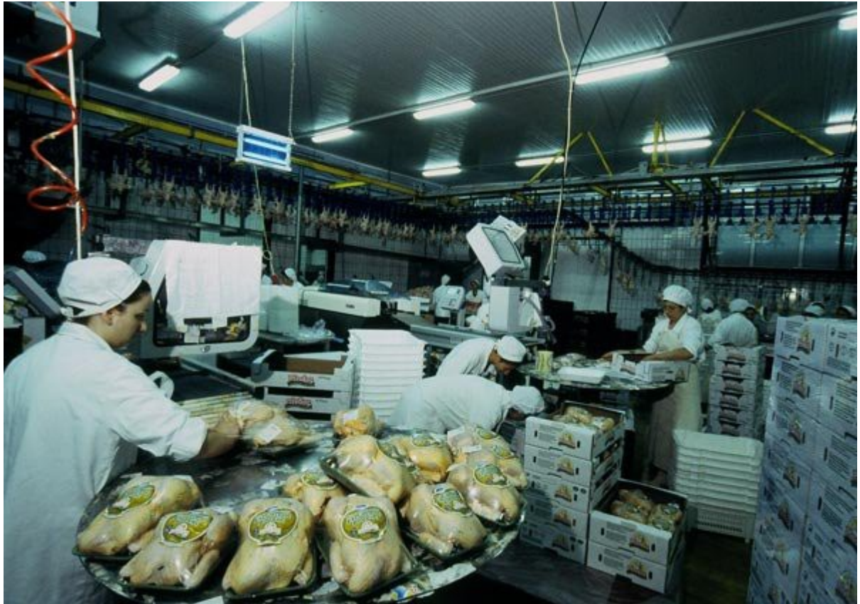
Εικόνα 15. Πτηνοσφαγείο του Α.Π.Σ.Ι. ΠΙΝΔΟΣ.