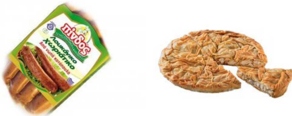
Εικόνα 25. Προϊόντα αλλαντικών και Γιαννιώτικης παραδοσιακής κοτόπιτας ΠΙΝΔΟΣ.