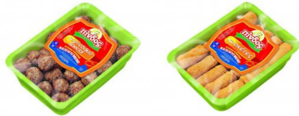
Εικόνα 22. Προϊόντα κατεψυγμένα από τη σειρά «έτοιμα ψημένα» ΠΙΝΔΟΣ.