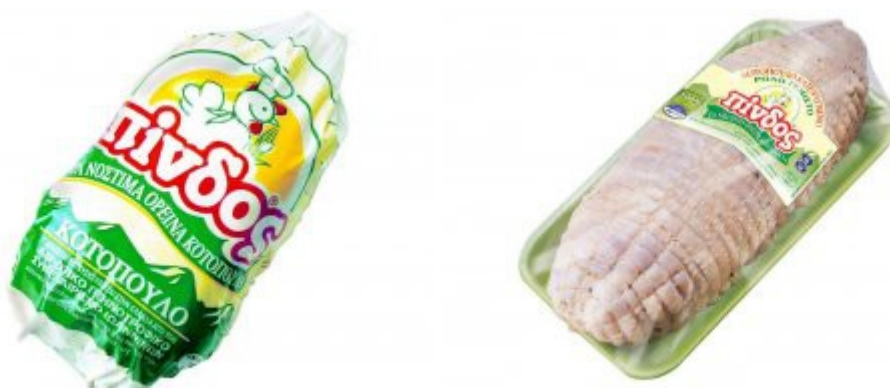
Εικόνα 20. Προϊόντα από κατεψυγμένα κοτόπουλα ΠΙΝΔΟΣ.