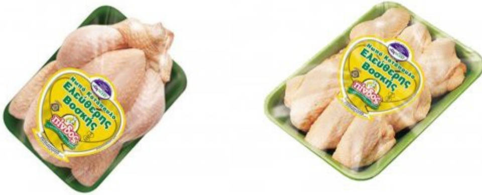
Εικόνα 24. Προϊόντα από κοτόπουλα ελεύθερης βοσκής ΠΙΝΔΟΣ.