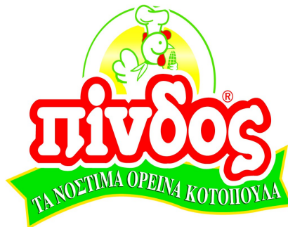
Εικόνα 3. Το λογότυπο του Αγροτικού Πτηνοτροφικού Συνεταιρισμού Ιωαννίνων «η Πίνδος».