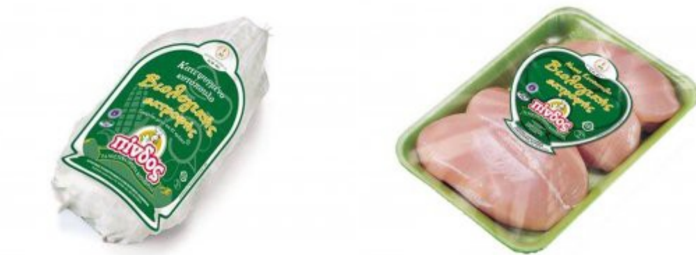
Εικόνα 23. Προϊόντα από κοτόπουλα βιολογικής εκτροφής ΠΙΝΔΟΣ.