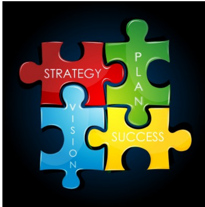
Εικόνα 29. Οι έννοιες στο στρατηγικό σχεδιασμό.

Η επιχειρησιακή στρατηγική είναι αυτή που καθορίζει τα σημαντικότερα θέματα, που κρίνουν το μέλλον μιας επιχείρησης ή ενός οργανισμού. Εφαρμόζεται σε ολόκληρη την επιχείρηση, χρησιμοποιώντας τις καλύτερες πρακτικές από κάθε τμήμα και συνδυάζοντάς τες δημιουργεί το βέλτιστο δυνατό αποτέλεσμα για αυτήν. Η επιχειρησιακή στρατηγική προσδίδει αξία σε όλη την επιχείρηση και τη βοηθά να διατηρεί το ανταγωνιστικό της πλεονέκτημα έναντι ομοειδών επιχειρήσεων.