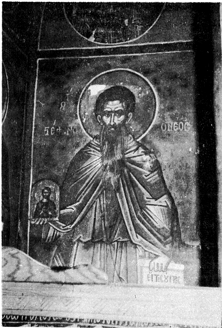
2. Ο άγιος Στέφανος ο Νέος. Τοιχογραφία του καθολικού της Μ. Δοχειαρίου του Αγίου Όρους (1568).