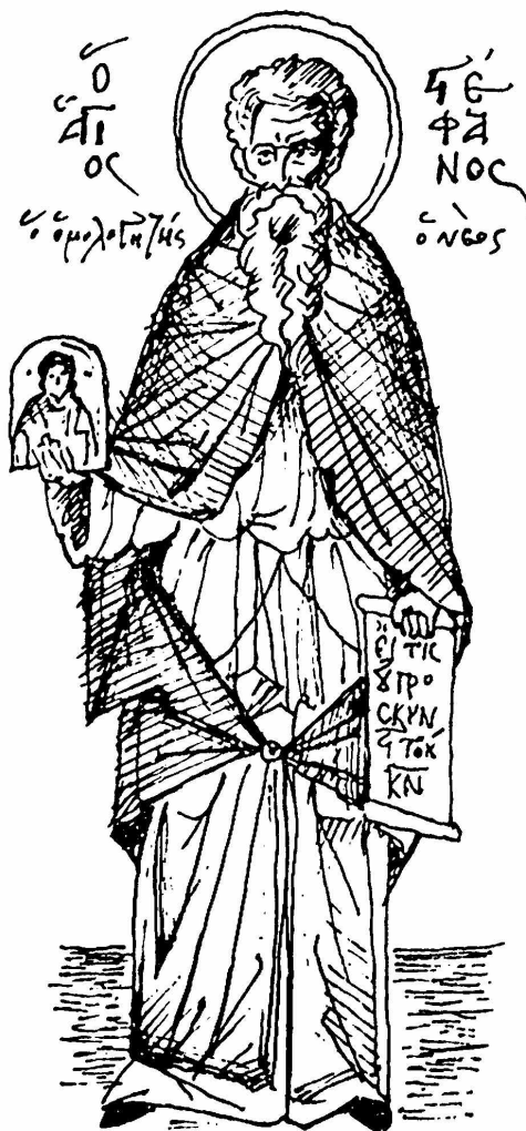
ΑΓΙΟΣ ΣΤΕΦΑΝΟΣ Ο ΝΕΟΣ