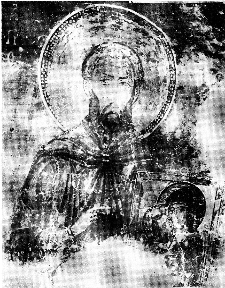
1. Ο άγιος Στέφανος ο Νέος. Τοιχογραφία στην Εγκλείστρα του Αγίου Νεοφύτου (1196). Πάφος Κύπρου.