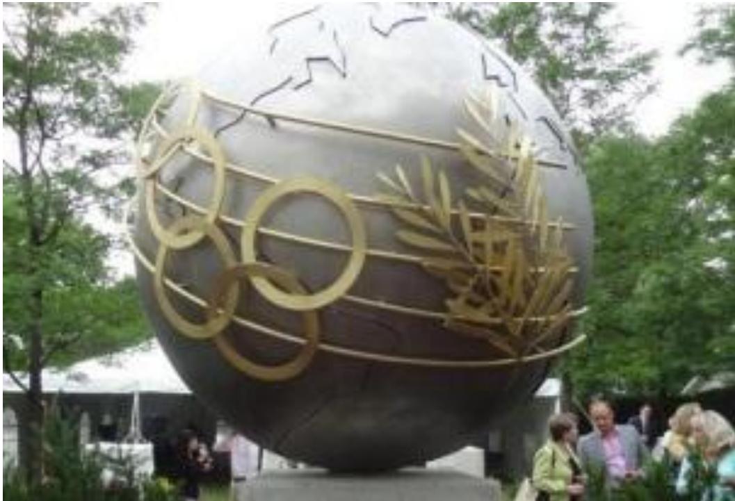
Εικόνα 27 - Πραξιτέλη Τζανουλίνου, Η Γαία, Οττάβα, 2014