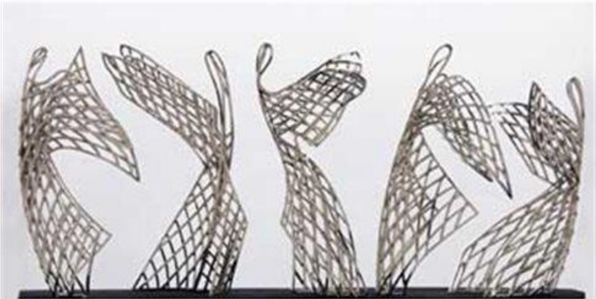
Εικόνα 21 - Μυρωδιάς Αντώνιος, Με όραμα τις Πέντε Νίκες, Πεκίνο, 2008