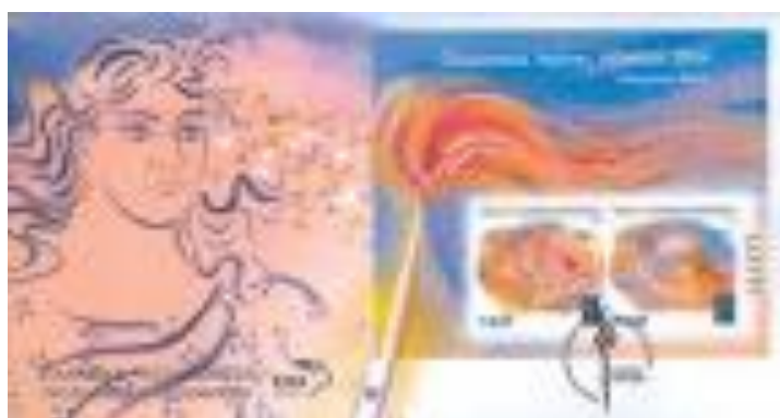
Εικόνα 20α - Ολυμπιακά γραμματόσημα, 2004