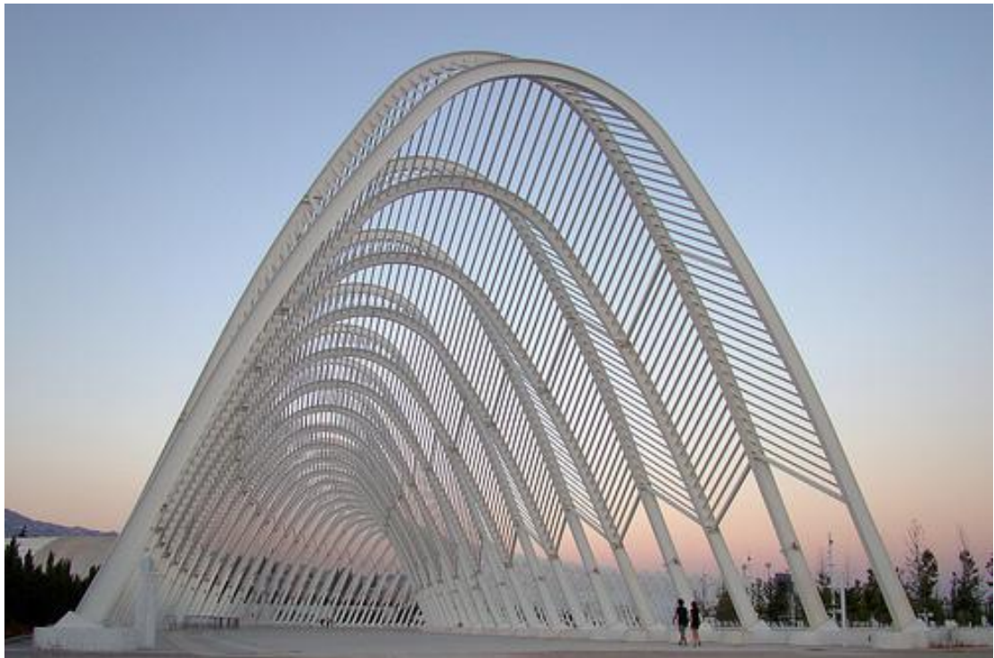
Εικόνα 10 - Σαντιάγο Καλατράβα, Το Στέγαστρο του Ολυμπιακού Σταδίου, 2004