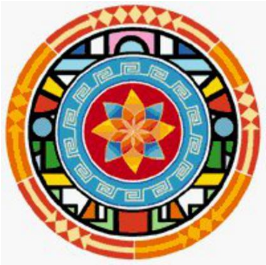
Εικόνα 8 - Το έμβλημα της Πολιτιστικής Ολυμπιάδας, 2004