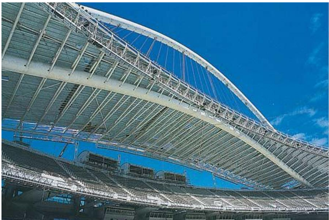
Εικόνα 9 - Σαντιάγο Καλατράβα, Το Στέγαστρο του Ολυμπιακού Σταδίου, 2004