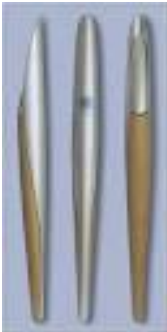
Εικόνα 12 - Η Ολυμπιακή Δάδα, 2004