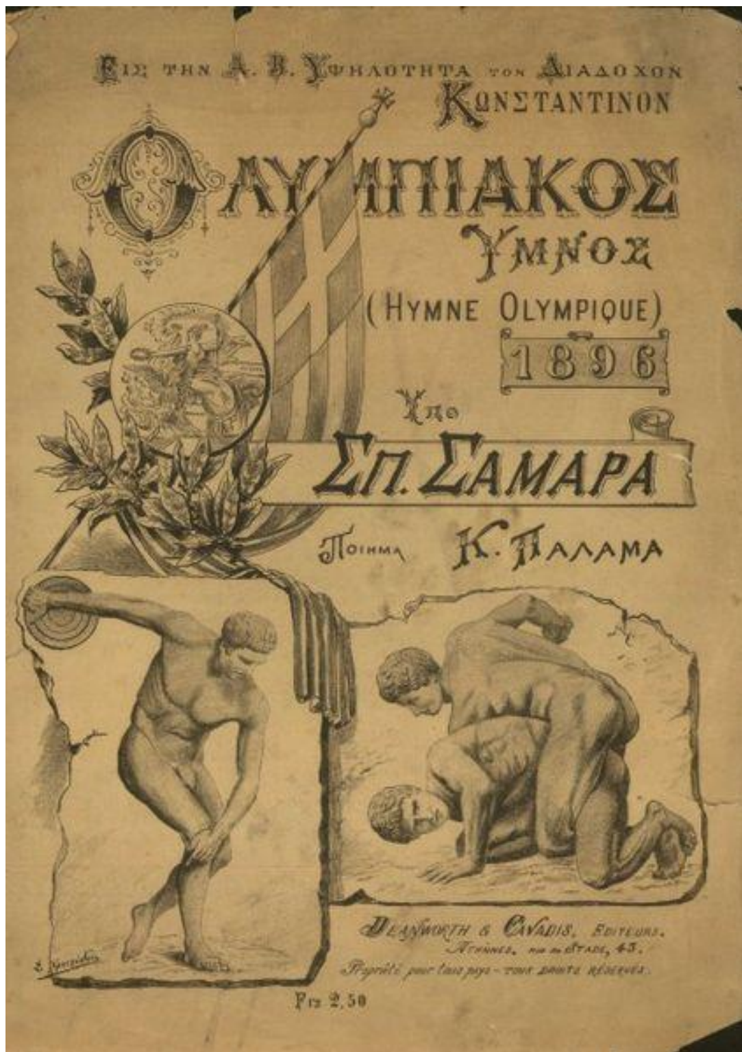
Εικόνα 3 - Αφίσα με τον Ολυμπιακό Ύμνο των Κώστα Παλαμά - Σπύρου Σαμάρα, 1896