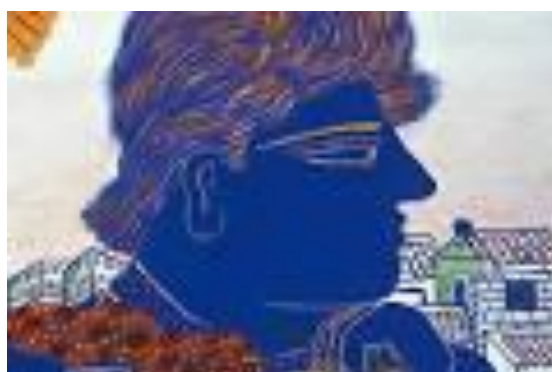
Εικόνα 20γ - Ολυμπιακά γραμματόσημα, 2004