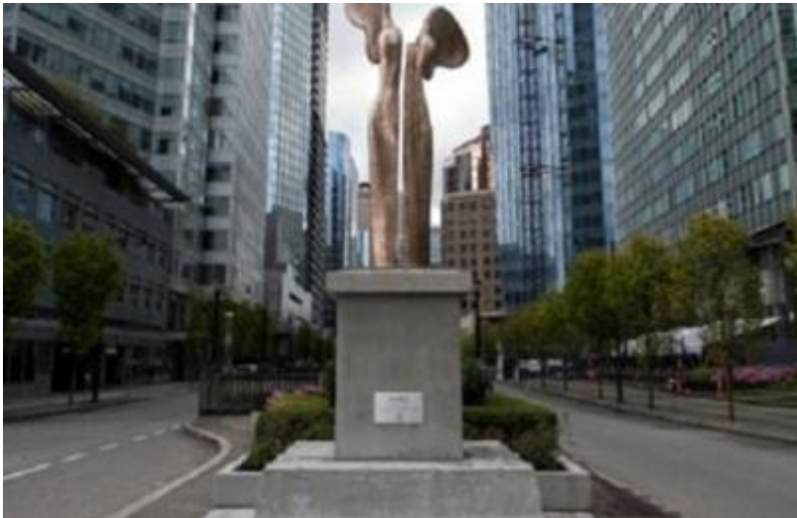
Εικόνα 24 - Παύλου-Άγγελου Κουγιουμτζή, Η Νίκη, Βανκούβερ, 2014