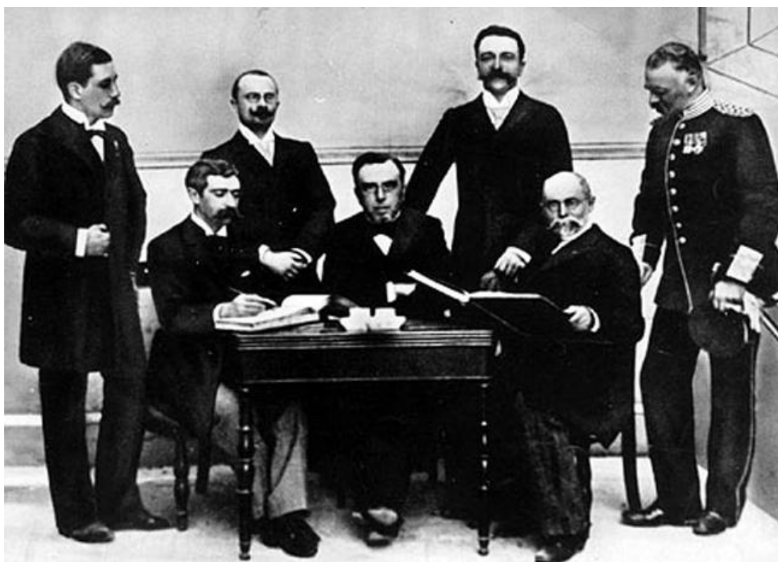
Εικόνα 1 - Η πρώτη Διεθνής Ολυμπιακή Επιτροπή. Στο μέσον ο πρώτος πρόεδρος Δημήτριος Βικέλας. Όρθιος από αριστερά ο βαρόνος Πιέρ ντε Κουμπερτέν.