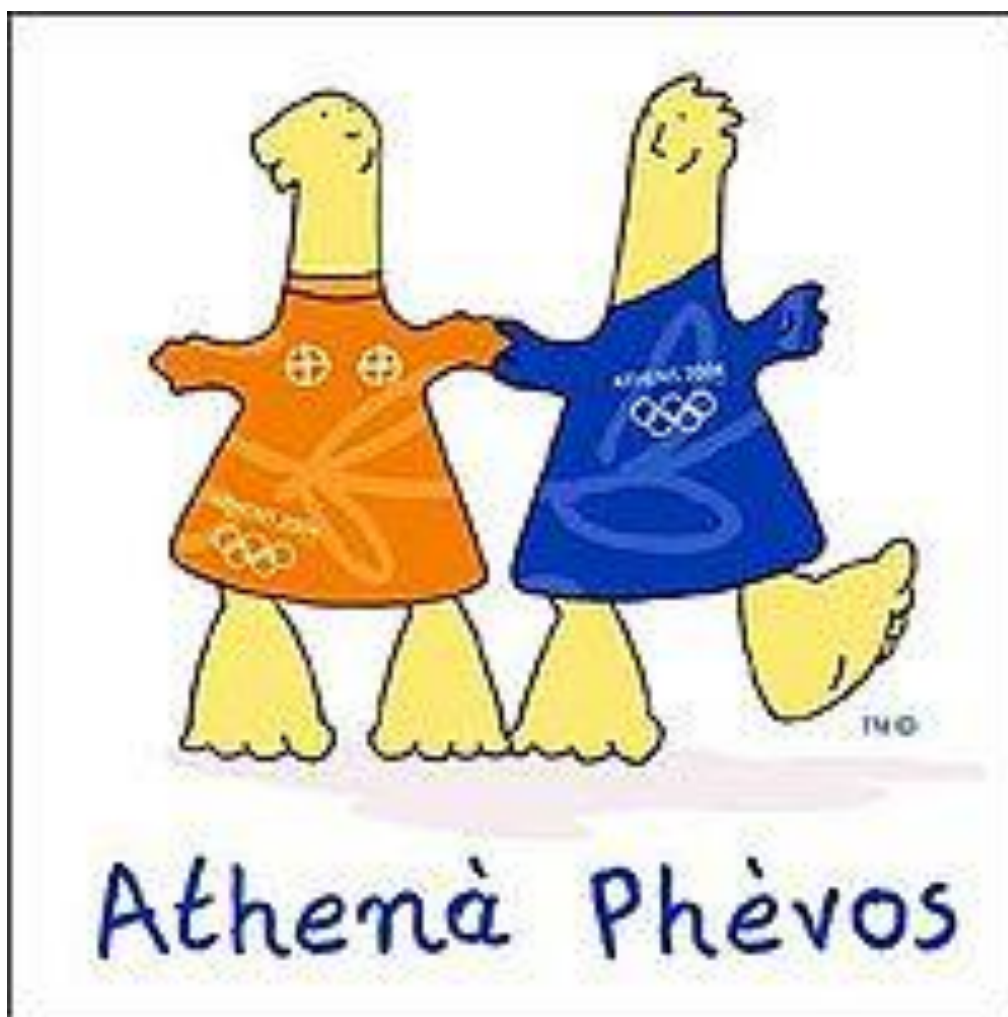
Εικόνα 13 - Η μασκότ των Ολυμπιακών Αγώνων της Αθήνας (Αθηνά και Φοίβος), 2004