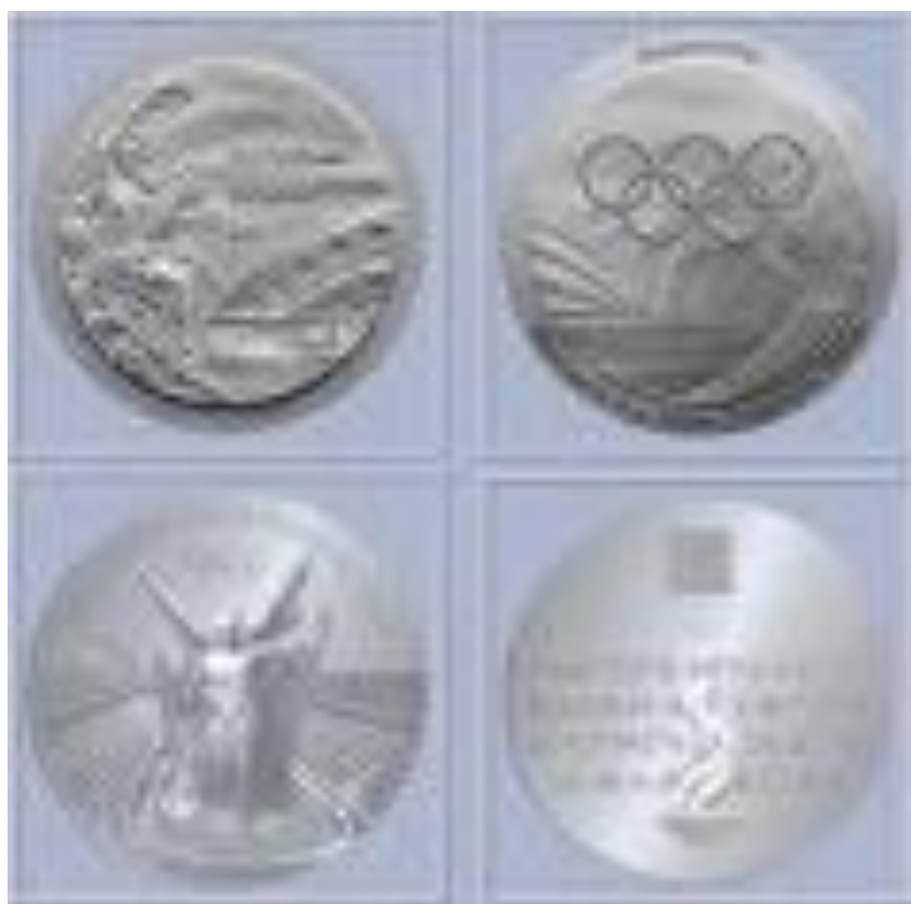
Εικόνα 17 - Ολυμπιακά μετάλλια, 2004