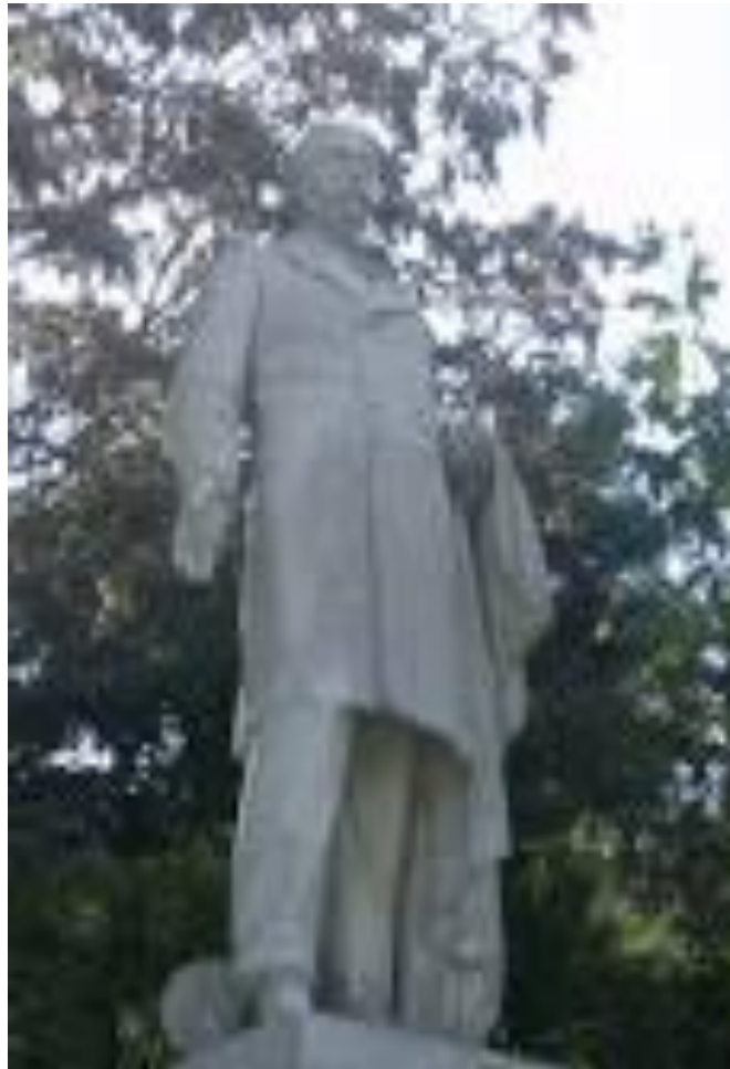
Εικόνα 5 - Γεωργίου Βρούτου, ο ανδριάντας του Γεωργίου Αβέρωφ, Είσοδος Παναθηναϊκού Σταδίου, 1896