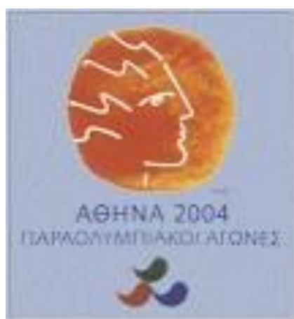
Εικόνα 20β - Ολυμπιακά γραμματόσημα, 2004