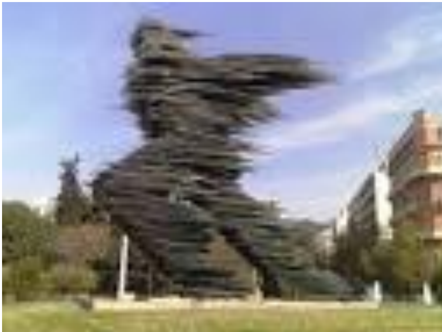
Εικόνα 26 - Κώστας Βαρώτσος, Ο δρομέας, πλ. Χίλτον, 1988