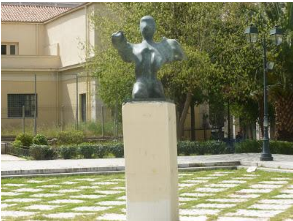
Εικόνα 22 - Κυριάκου Καμπαδάκη, Η Νίκη, Πλ. Δικαιοσύνης, 1985