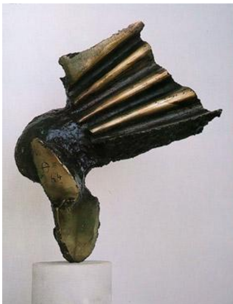
Εικόνα 23α - Θόδωρου, Η Νίκη 67, Βρυξέλες,, Κτίριο Ευρωπαϊκής Ένωσης,, 1994