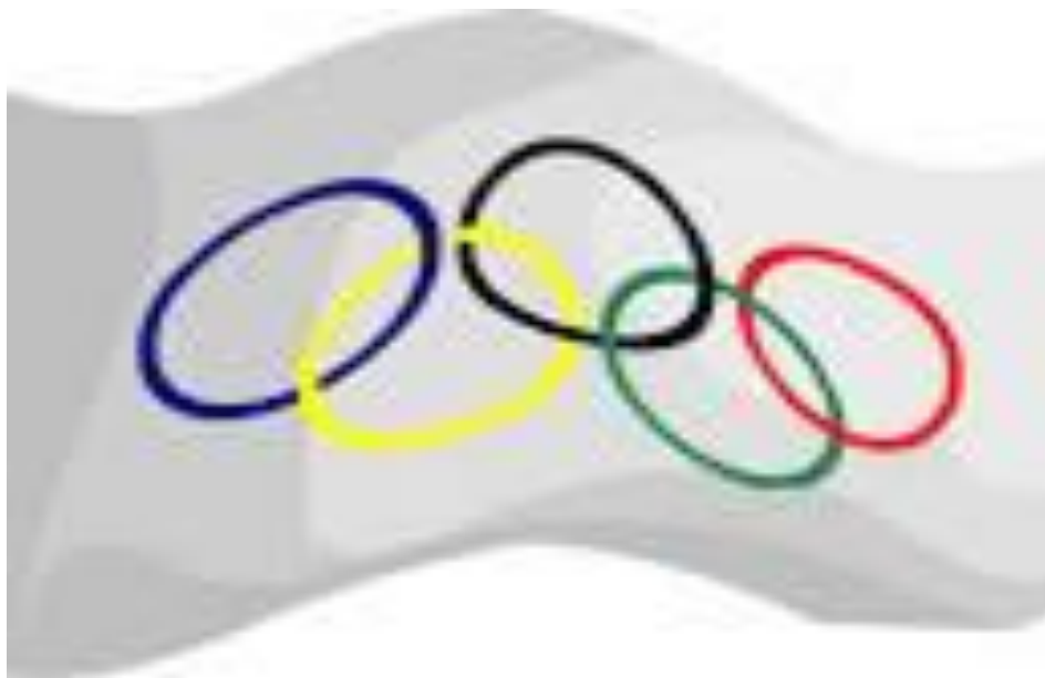
Εικόνα 4β - Η Ολυμπιακή Σημαία