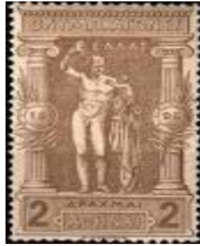
Εικόνα 19α - Ολυμπιακά γραμματόσημα, 1896