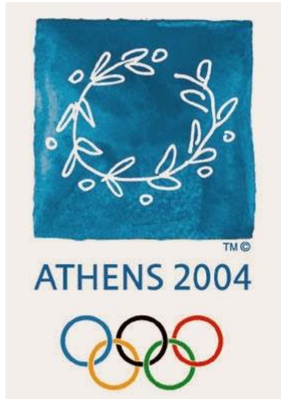
Εικόνα 11α - Ο κότινος. Το έμβλημα των Ολυμπιακών Αγώνων, 2004