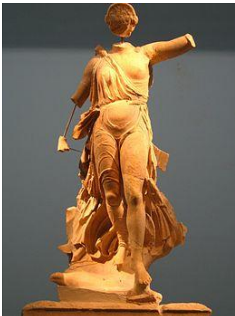
Εικόνα 14 - Η Νίκη του Παωνίου, 321. π. Χ. (Μουσείο Αρχαίας Ολυμπίας)