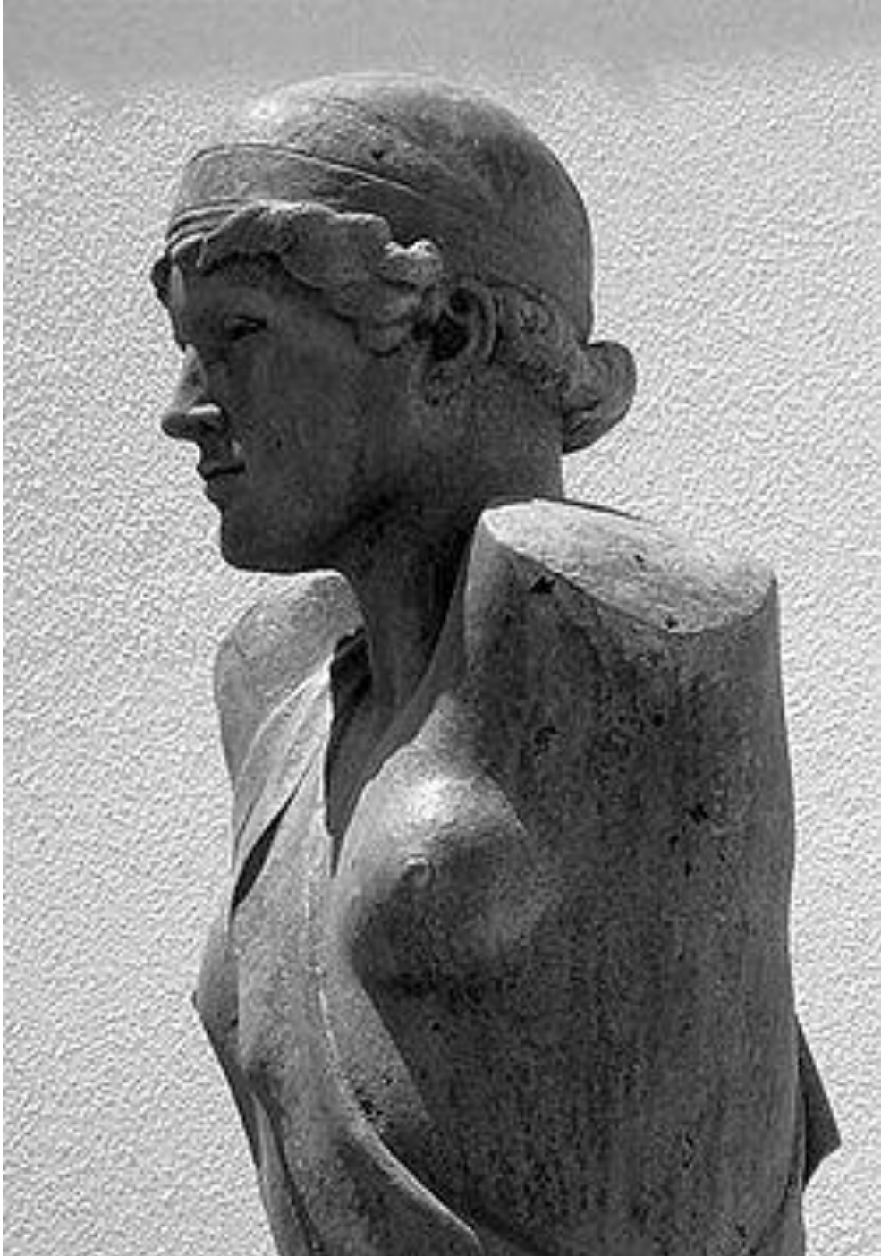
Εικόνα 25 - Μιχάλη Τόμπρου, Κεφάλι Αμερικανίδας αθλήτριας, 1928 (Μουσείο Σύγχρονης Τέχνης Γουλιανδρή, Άνδρος)