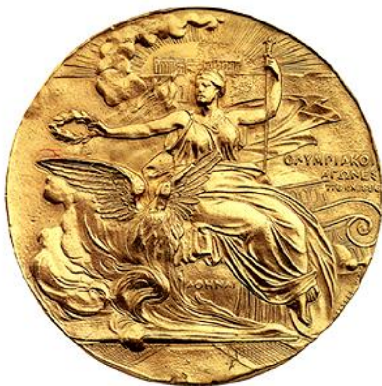
Εικόνα 16 - Νικηφόρου Λύτρα, Αναμνηστικό μετάλλιο Ολυμπιακών Αγώνων, 1896