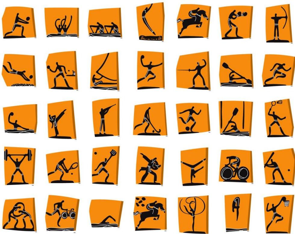
Εικόνα 18 - Ολυμπιακά εικονογράμματα, 2004