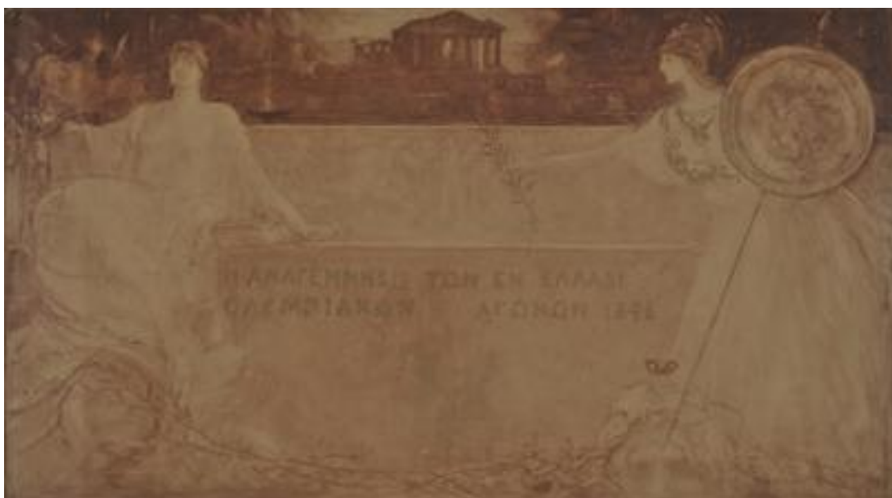
Εικόνα 15 - Νικόλαου Γύζη, Το Δίπλωμα των Ολυμπιακών Αγώνων, 1896