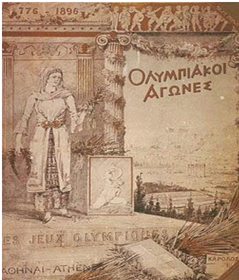
Εικόνα 2 - Αφίσα των πρώτων Ολυμπιακών Αγώνων, Αθήνα 1896