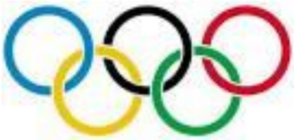
Εικόνα 4α - Οι πέντε κύκλοι. Το έμβλημα των Ολυμπιακών Αγώνων