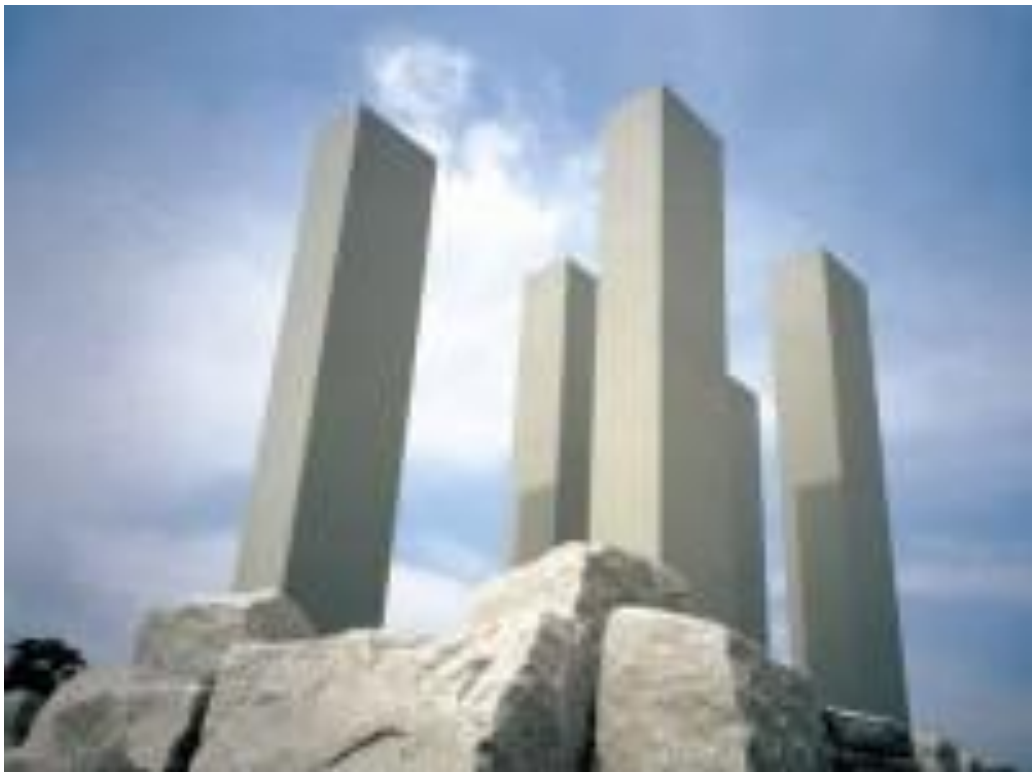
Εικόνα 22 - Διοχάντη, Σεούλ-Το Πνεύμα των Ολυμπιακών Αγώνων, 1988