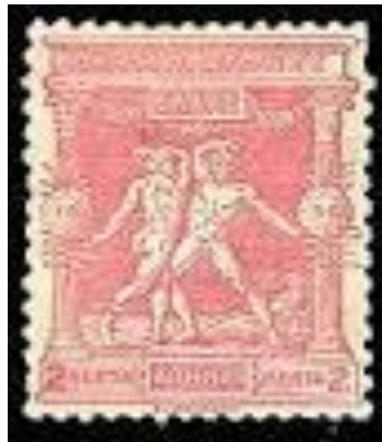
Εικόνα 19γ - Ολυμπιακά γραμματόσημα 1896