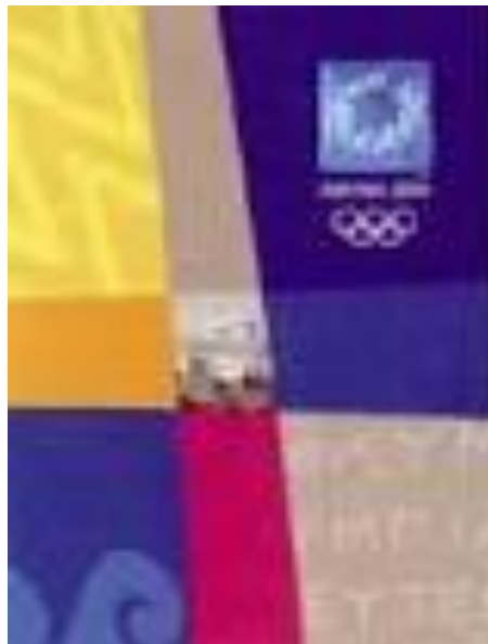
Εικόνα 11β - Η αφίσα των Ολυμπιακών Αγώνων, 2004