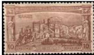
Εικόνα 19β20 - Ολυμπιακά γραμματόσημα, 1896