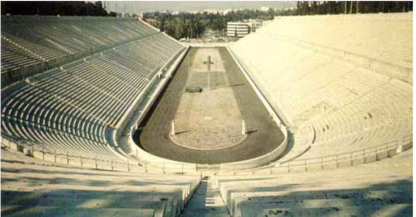
Εικόνα 6 - Το Παναθηναϊκό Στάδιο