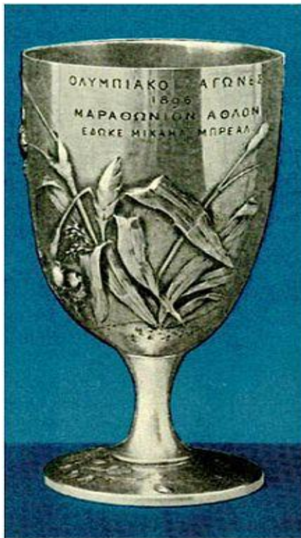
Εικόνα 21 - Το κύπελλο του Σπύρου Λούη (ή το Κύπελο Μπρεάλ), 1896