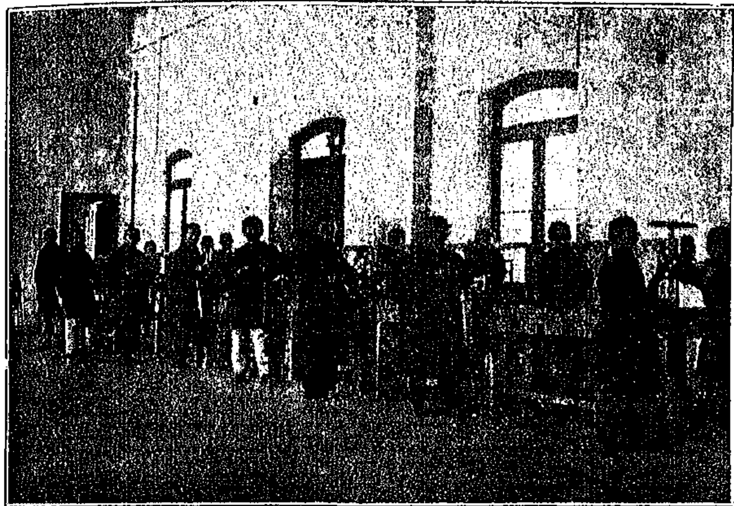
ΤΟ ΕΡΓΑΣΤΗΡΙΟΝ ΤΗΣ ΣΧΟΛΗΣ

4) Νὰ ὑποστῇ ἐπιτυχῶς εἰσιτήριον δοκιμασίαν.