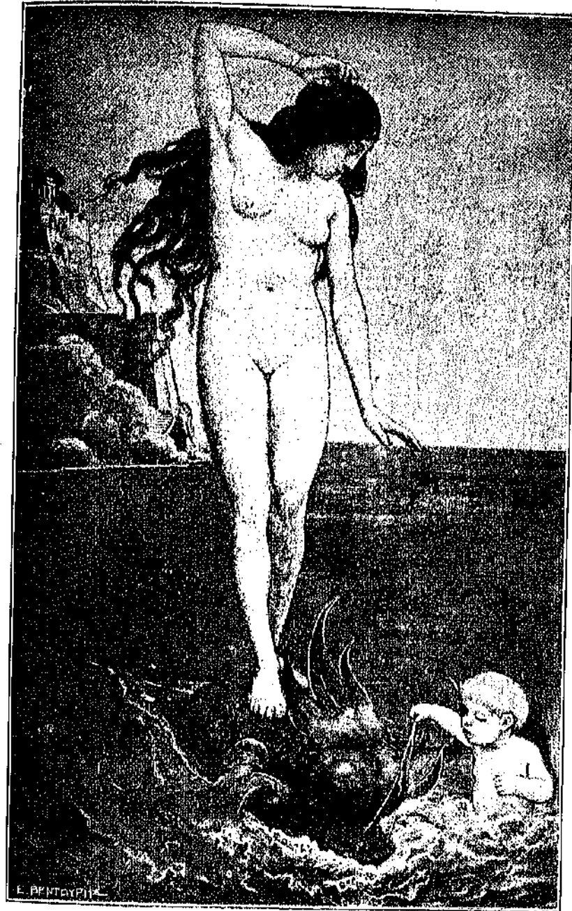
☐ Η ΑΦΡΟΔΙΤΗ ΕΠΙ ΤΗΣ ΘΑΛΑΣΣΗΣ ☐