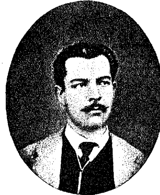
* ΔΗΜΗΤΡΙΟΣ Κ. ΠΑΠΑΡΡΗΓΟΠΟΥΛΟΣ *

Ὁ χαρακτηριστικὸς αὐτὸς πεισομισμὸς τοῦ ποιητῆ ἐκδηλώνει' ἐντονότερα, παθητικότερα, στὴν ἀντίληψη τοῦ ἔρωτος, στὴν ἰδέα τῆς γυναίκας. Κάθε φορὰ πὸς προσφᾶνε ὁ ποιητῆς τὸν ἔρωτα, δὲν κάνει τίποτ' ἄλλο παρὰ νὰ ζωγραφίξῃ μεσὰ σὲ ζοφερὸ βᾶθος ἕνα ρομαντικὸ φάντασμα πὸ μὸλις ξεχωρίζει μεσ' ἀπὸ τὸ βᾶθος τῆς εἰκόνας καὶ πὸ χάνεται μεσὰ σ' αὐτὰ, κάτι σὰν τὸν ἄγγελο τοῦ πόνου τὸ χαρισμένο ἀπὸ τὸ Γνώξη, ὃὰ λέγαμε, ἂν ἤξερε ὁ ποιητῆς νὰ δώσει στὸ σχέδιό