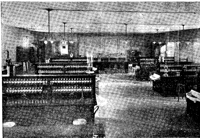
Τὸ γεωπονικὸν χιμεῖον τοῦ Πανεπιστημίου

Ἡ φθορὰ, τὴν ὅποιαν ἔφερον εἰς τὸν ἐθνικὸν πλοῦτον ὁ Παγκόσμιος πόλεμος, ἐπέφερον ἀνατροπὴν τῶν οικονομικῶν συ-