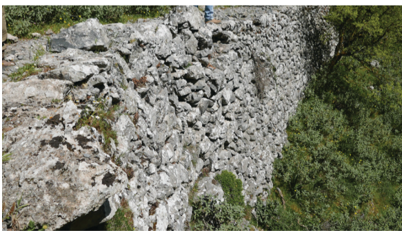
3. Κομμάτι του καλντεριμιού σε άριστη κατάσταση.