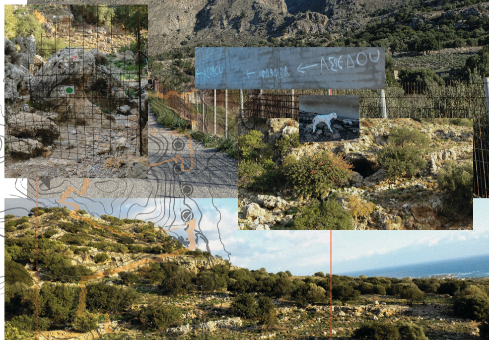
Η ανάβαση του φαραγγιού από Νότο προς Βορρά.

Μπορεί κανείς να ξεκινήσει είτε από τον Άγιο Νεκτάριο είτε από τον οικισμό της Ασφένδου.