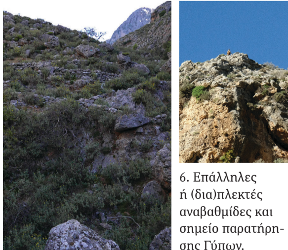
6. Επάλληλες ή (δια)πλεκτές αναβαθμίδες και σημείο παρατήρησης Γύπων.