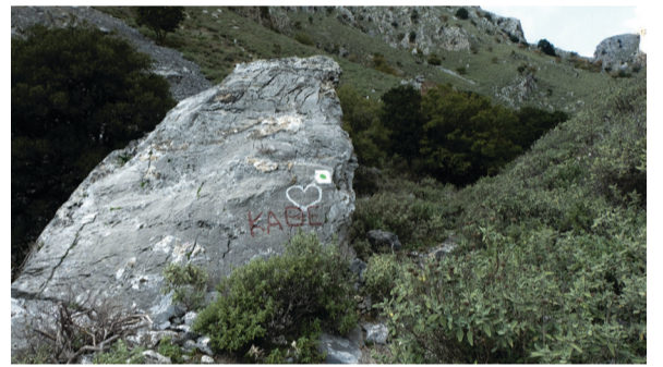
«Καθές». Σημείο ανάπαυσης, ονομάζεται έτσι από το «κάθεσαι».