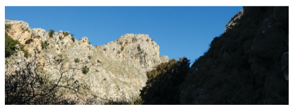
«Βιτσιλές». Στην τοπική διάλεκτο οι Γύπες (Gyps fulvus). Είναι το μέρος όπου φωλιάζουν.