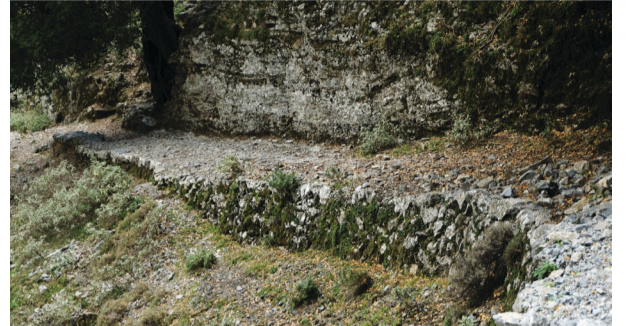
«Πρίνος». Το σημείο όπου το παλιό καλντερίμι έχει χαλάσει από φυσικά αίτια και φαίνεται ο τρόπος που «φυτεύονταν» οι πέτρες. Ονομάζεται έτσι λόγω του θεόρατου πρίνου, δηλαδή πουρνάρι, είδος βελανιδιάς.