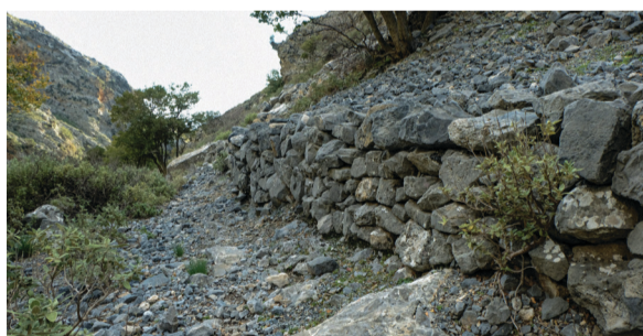
5. Τοίχος αντιστήριξης.