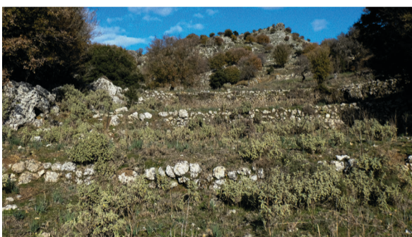
2. Εγκαταλελειμμένες καλλιέργειες.