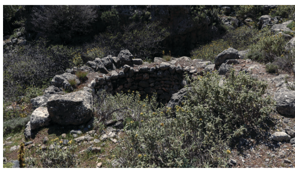
7. Ασβεστοκάμινο χωρίς τον θόλο του.