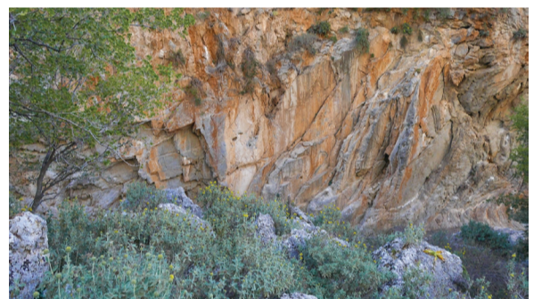
«Διγενής πατέ». Σημάδια στο γκρεμό.