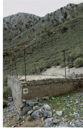
«Στέρνα». Νεότερη κατασκευή που λειτουργεί κανονικά.