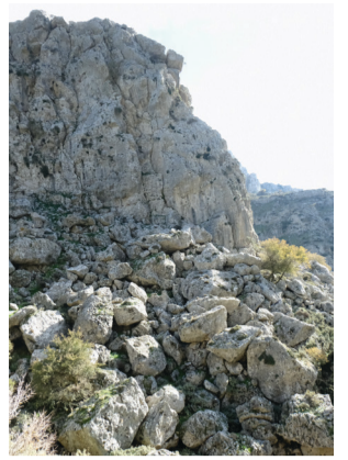
«Του κυνηγού». Ονομάζεται έτσι επειδή φώλιαζαν οι πέρδικες στο γκρεμό.