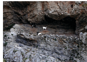
4. Μελισσόκηποι: σπήλαια όπου οι μελισσοκόμοι έβαζαν τα κοφίνια, τα οποία χρησιμοποιούνταν πριν τις τεχνητές κυψέλες.