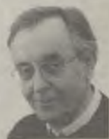
Του Δημήτρη Δασκαλόπουλου

Στον πολλαπλώς προσεγγμένο και επαρκώς αιτιολογημένο πρόλόγό του, ο ανθολόγος εξιστορεί την πολύχρονη απα-