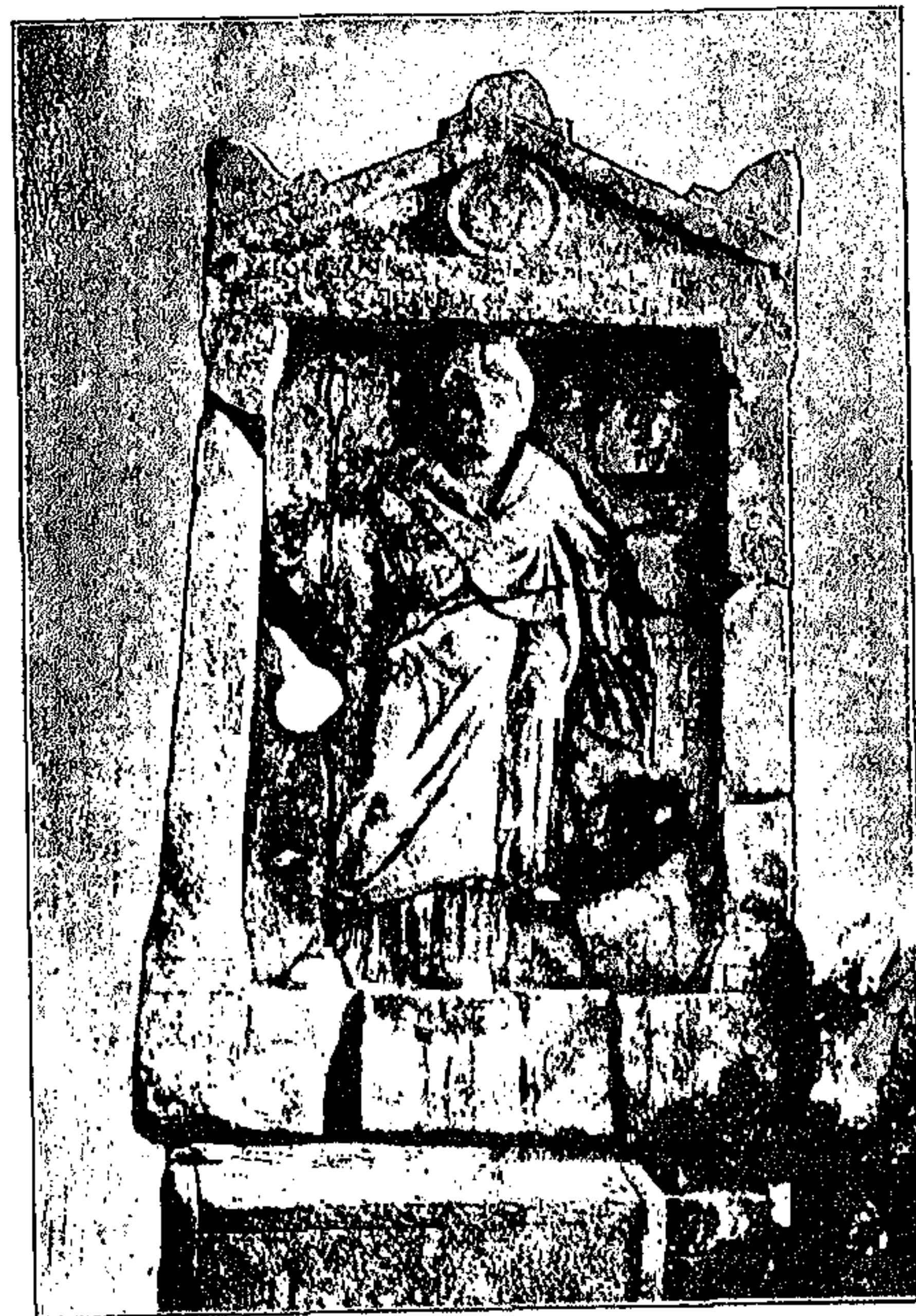
Στήλη τῆς Μαίας Ἑρμιόνης.

2 Ἐπειδὴ ἡ ἀνασκαφὴ τοῦ τάφου τούτου ἀπροόπτως εὐρεθέντος ἐξετελέσθη δυστυχῶς ἐν σπουδῇ καὶ δι' ὄλως ἀπείρου σκαφέως, τὸ ἐνώτιον τοῦτο διέλαθε καὶ εὐρέθη ὀλίγα λεπτα μετὰ τὴν ἐκεῖθεν ἀναχώρησίν μου ὑπὸ τινος κορασίου ἀνασκαλεύσαντος τὰ χώματα, ἀναμφιδόλως δ' ὑπῆρχεν ἐν τῷ τάφῳ καὶ ἕτερον ἐνώτιον, ὅπερ ἀκωλύσθη. Περὶ τοῦ εὐρεθέντος ὅμως ἐνωτίου ὑπάρχει τελεία βεβαιότης ὅτι ἐκ τοῦ τάφου τούτου προήρχετο καὶ ὄχι ἄλλοθεν, διότι κατεσχέθη ὑπὸ τῆς ἀστυνομίας εὐθὺς μετὰ τὴν ἀνεύρεσιν καὶ πολλοὶ παρόντες εἶδον πῶς ἀνευρέθη. Τὰ εὑρήματα τοῦ τάφου τούτου εἰσῆχθησαν εἰς τὸ Ἑθνικὸν Μουσεῖον.