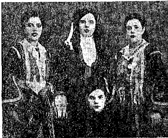
Βορειοηπειρώτισσαι με ποπικές ένδυμασίας Λιούτζης

Η 'Ηπειρώτισσα έζησε με το παραπάνω τη ζωή αυτή που όνειρεύτηκαν οι σοφοί και μεγάλοι της αρχαιότητας, έδειξε πάντοτε χαρίσματα ζηλευτά που έξυμνησε το δημοτικό τραγούδι, και κατώρθωσε με την ύπομονή της, τη φιλοστοργία, τις θρησκευτικές της παραδόσεις, τη φιλοπονία της να δώσει στην κοινωνία άξιους δασκούς, μεγάλους άνδρες. Σ' αυτήν όφειλεται ή τιμή