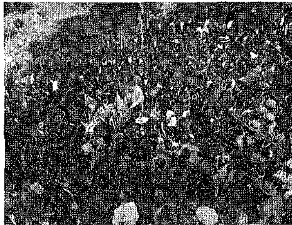
Ὁ Μητροπολίτης Ἀργυροκάστρου ἐν μέσῳ τοῦ ποιμνίου τοῦ εἰς τοὺς Ἁγίους 40, κατὰ τὸ Ἅγιον Πάσχα τοῦ 1937.

Ὅλα αὐτὰ σταμάτησαν πᾶ καὶ τέλειωσαν μέσα σὲ μιὰ φτώχεια καὶ σὲ μιὰ συμφορὰ, ἀνήκουστη στὴν