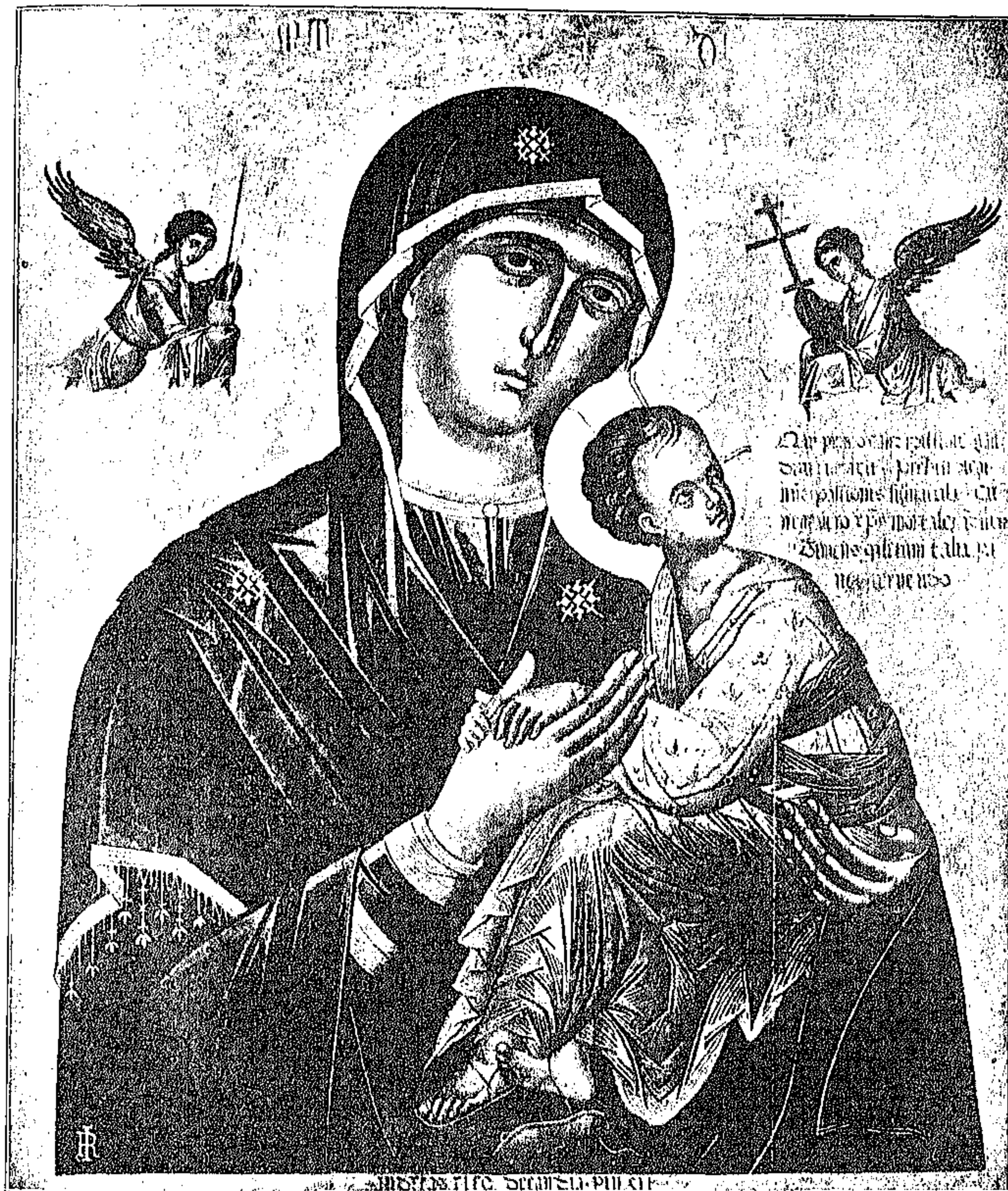
Ἡ ΠΑΝΑΓΙΑ ΤΟΥ ΚΡΗΤΟΣ ΖΩΓΡΑΦΟΥ ΑΝΔΡΕΟΥ ΡΙΚΟΥ ΕΝ ΤΡΙ ΜΟΥΣΕΙΩΙ UFFIZI EN ΦΛΩΡΕΝΤΙΑΙ