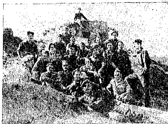
Ύστερα από τή μάχη

Κ ΗΡΘΕ τó θράδυ για να σκεπάση τόν κουρασμένο κόσμο με τó σκούρο χρώμα του. Και μαζί ή ή πυκνή θροχή θά μάς κρατήση έβλη τή νύχτα συντροφιά. Αύριο θά δούμε πολλά πράγματα, και θά πούμε! «Θεέ μου ποιός ανακάλυψε και τή Νί-