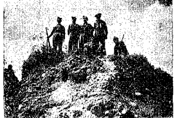
Κάπου στὸ Βίτσι

Η ΒΡΟΧΗ ὅσο πάει λιγοστεύει, κι' ἐμεῖς ὄλο καὶ ἀνεβαίνουμε στὶς πιὸ ψηλές κορυφές τοῦ Βίτσι. Καθόλου κατήφορος. Στὰ μάτια μας ξετυλίγεται ἓνα ὄνειρο. Τ' ὄνειρο τῆς γαλάζιας ἑλληνικῆς πατρίδας, μὲ τὰ πράσινα στολίδια. Ἡ βροχὴ ἔχει πλύνει τὰ δένδρα καὶ μοσχοβολοῦσε. Τὰ συρμα-