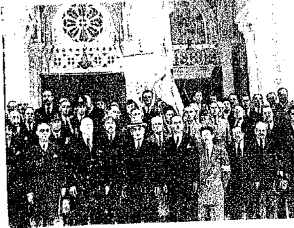
Οι έπίσημοι μετά το Μνημόσυνον

ΕΠΙ ΤΗ 9η έπετείρ της άπελευθέρωσης υπό του θρυλικού μας Στρατού της Κορυτσάς, πρωτοβουλία του «ΣΕΛΑΣΦΟΡΟΥ», έτελέσθη εις τον Μητροπολιτικόν Ναόν την Κυριακήν 20 Νοεμβρίου μνημόσυνον υπέρ των πεσόντων έν Βορείω Ήπειρω, χοροστατούντος του Μακαριωτάτου κ. κ. Σπυρίδωνος. Έν μέσω πρωτοφανούς πλήθους κόσμου οι έπίσημοι έλάμβανον τας θέσεις των, μερίμνη του Δ. Σ. του «ΣΕΛΑΣΦΟΡΟΥ» και νέων της Ε.Ν.Β.Η..