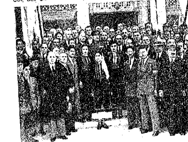
Ο «Παππος» με τη Νεολαία μας

«Η Ιερά πόλις του Μεσολογγίου, πρωταθλήτρια των αγώνων διά την Έλευθερίαν, όφναι επί σημερινή έπετείρ άπελευθέρωσης Κορυτσάς φωνή έντόνου διαμαρτυρίας δι' άπαραδέκτως συνεχιζομένην έν στυγνή δουλεία ζωήν αδελφών μας μαρτύρων Β. Ήπειρου. Άπευβύνεται προς έλευθέρους λαούς, τους οποίους δεν έπαυσε να θερμαίνει ή αγάπη προς την Έλευ-