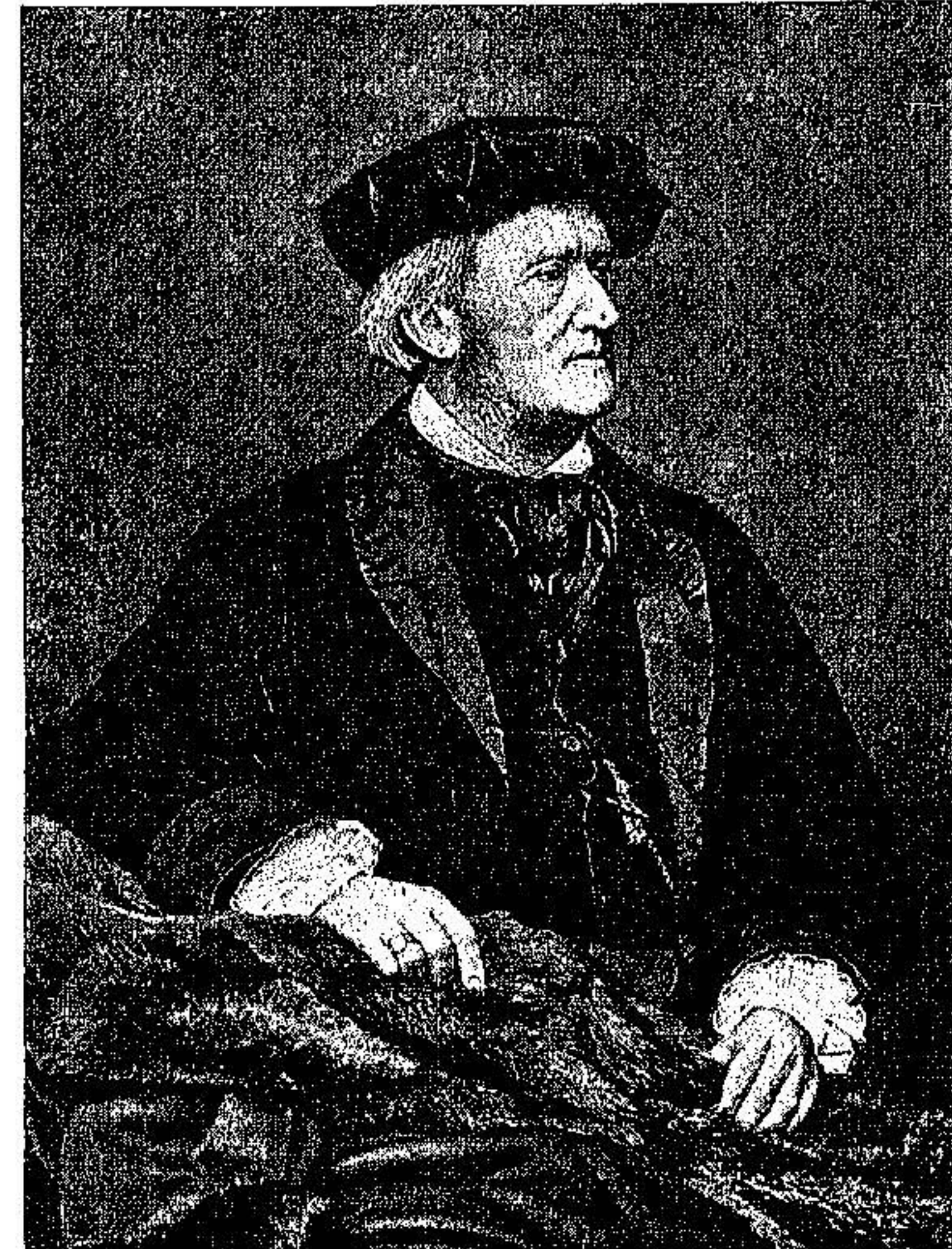
Ο ΓΕΡΜΑΝΟΣ ΜΟΥΣΙΟΥΡΓΟΣ ΡΙΧΑΡΔΟΣ ΒΑΦΝΕΡ. Ἐγεννήθη ἐν Λειψίῃ τῆ 22. Μαΐου 1818, ἀπέθ. τῆ 13. Φεβρ. 1883.

Ἄληθές εἶναι ὅτι ὑπεσχέθη ἢ ἀπαντήσω εἰς τὴν ἐκπονηθεῖσαν παρὰ τοῦ ἀξιότιμου κ. Κατζίδακη ἐπίκρισιν τοῦ προλόγου τῶν „Παρέργων μου“. Τοῦτο ὅμως ὑπεσχέθη ἔτι δημοσιευθῆ. Ἀλλὰ μετὰ τὴν δημοσίευσιν αὐτῆς πρὸ μηνὸς ἤδη οὐδὲν ἄλλο δύναμαι νὰ πράξω πρὸς τήρησιν τῆς ὑποσχέσεώς μου, ἢ νὰ ἐκδέσω τοὺς λόγους, ἐξ ὧν ἀναγκάζομαι νὰ θεωρήσω πᾶσαν ἀπάντησιν περιττήν. Πρώτιστος τούτων εἶναι ὁ μετὰ τὴν ἀνάγνωσιν τῆς ἐπίκρίσεως ταύτης καταλαβὼν με φόβος μὴ ἐστερήθην τῆς ἰκανότητος νὰ ἐκφράζωμαι διὰ τρόπον τοῦλάχιστον καταληπτοῦ. Ἄπο εἰκασίας σχεδὸν γράφων εἶγον πάντοτε πρὸ τῶν ὀφθαλμῶν τὸ παράγγελμα τοῦ Κοῦντιλιανοῦ, ὅτι πρέπει νὰ ἐκδέτῃ τις ὅσα ἔχει νὰ εἴπῃ οὕτω σαφῶς, ὅστε οὐ μόνον νὰ ἐννοῆται παρὰ πάντων, ἀλλὰ καὶ ἀδύνατον νὰ ἦναι νὰ μὴ ἐννοηθῆ. Διὰ τῆς πολλῆς προσηλωσεως εἰς τὸν κανόνα τούτον καὶ πρὸ πάντων διὰ