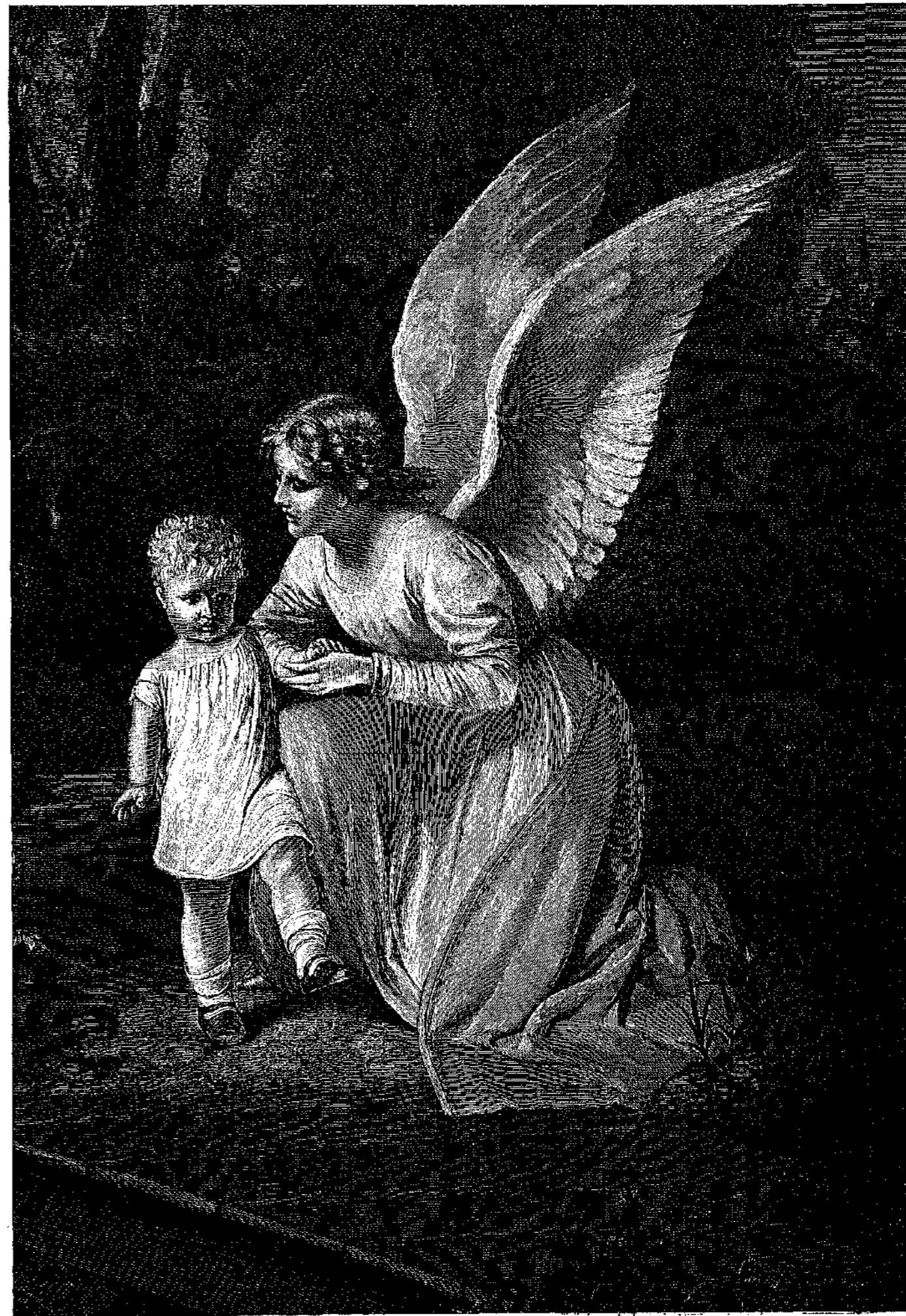
Ο ΠΡΟΣΤΑΤΗΣ ΑΓΓΕΛΟΣ. Ἐκὼν τοῦ Κόουλιμαχ, Κατὰ φωτογραφίαν τοῦ Βράν καὶ Φέγγερ ἐν Βερολίνῳ.

Οὐδὲν ἄλλο ἔχομεν ἢδὴ νὰ προσθέσωμεν ἐπι συμβουλήν τινα πρὸς τὸν ἀξιότιμον κ. Κατζίδακην, τῆς ὁποίας δύσκολον φαίνεται ἡμῖν ν' ἀμφισβητηθῇ παρ' αὐτοῦ ἡ ἀνάγκη καὶ ἡ χρησιμότης. Εἶναι δὲ αὐτὴ ἡ ἐξῆς, ἢ νὰ περιορίζεται ἐπι κερταίνον εἰς ἀορίστους μόνον μορφάς, ἢ νὰ καταβάλλῃ κατὰ τι περισσοτέρων προσοχῆν ἕταν κέρην πρέπον νὰ προβῇ εἰς μᾶλλον ὠριμμένας. Οὕτω λ. χ. κατηγορεῖ ἡμᾶς ἐπὶ ἀνεληνησμίῃ, ὡς γράφοντας τὴν ἀηδεστάτην ἀλληθῶς φράσιν