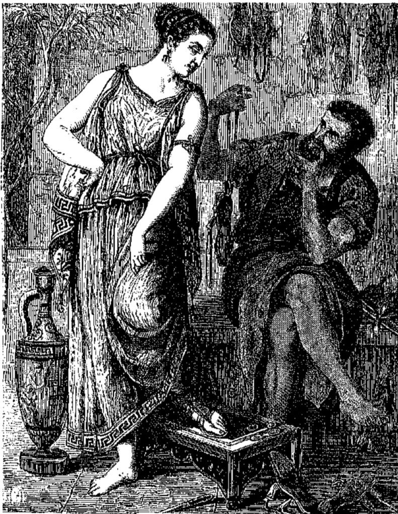
ΑΡΧΑΙΟΣ ΕΛΛΗΝ ΣΑΝΔΑΛΟΠΟΙΟΣ.

Ἐθέρβιος ὁ Παμφίλου, ὁ ἐπὶ Κωνσταντίνου ἀμάσας ἐπίσκοπος Καισαρείας τῆς Παλαιστίνης, ὅστις ἐγένετο δημιουργὸς τῆς ἐκκλησιαστικῆς ἱστορίας καί ἄλλως ἀνεδέχθη περὶ τὴν ἱστορίαν καί τὴν χρονολογίαν ἀνὴρ λόγου ἄξιος, συνέταξε καί εἰς τὸν βίον τοῦ Κωνσταντίνου λόγους τέσσαρας, ἐν οἷς βεβαίως ἐστὶ καὶ αὐτοῦ τοῦ βασιλέως ἠκουσε βραδύτερον διηγούμενα ὅσα κατὰ τὴν κρίσιν ἐνείνην τῆς ζωῆς αὐτοῦ στιγμὴν συνέβησαν. Προσευχομένου λοιπὸν τοῦ βασιλέως, λέγει, καί λιπαρῶς ἐκτελούοντος τὸν πατρῶιον θεόν, ἵνα ἐπαρέξῃ τὴν ἑαυτοῦ δεξιάν εἰς τὴν προκειμένην δυσχέρειαν, ἐπεφάνη θεοσημία τις καρυδαζωτάτη. Ὁ ἥλιος ἦτο περὶ μεσημβρίαν· ὁ Κωνσταντῖνος ἐπορεύετο μετὰ τοῦ στρατοῦ αὐτοῦ, ὅτε αἴφνης εἶδεν ὀφθαλμοφανῶς ἐν τῷ οὐρανῷ ὑπερκείμενον τοῦ ἡλίου σταυρὸν ἐκ φωτὸς συνιστάμενον καί φέροντα ἐπιγραφὴν „ταῦτι νικά“. Ἐκπλαγείς ἐπὶ τῷ θεάματι, ἕπερ εἶδε καί ἐθαύμασεν ἅπας ὁ περὶ αὐτοῦ στρατός, διηγορεῖ πρὸς ἑαυτὸν λέγων, τί ἄρα σημαίνει τὸ φάσμα μέχρις οὔ, ἐπελθού-