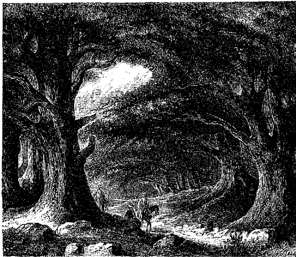
ΑΙ ΚΕΑΡΟΙ ΤΟΥ ΑΙΒΑΝΟΥ.

Ἄν δὲ τις ἀναλογισθῇ ὅτι ἡ δημοτικὴ ἡμῶν ποιήσις οὐτε ἐπική εἶναι οὐτε διδακτικὴ, ἀλλὰ λυρική, ἢ ἐνστασις ὅτι περιέχει „μόνον μέρη τῆς δημοτικῆς γλώσσης“ καταντῶ ἔτι μᾶλλον ἀστυαία. Ἐκ τούτων βλέπετε, ὅτι ἀν καθ'αυτὴν ἡ πραγματικὴ τοῦ κ. ὕψηλοῦ ἀπὸ πάσης „ἐξητημένης εὐφρολογίας“, ἀφθονεῖ ἀφ' ἑτέρου ἐν αὐτῇ ἢ ἀξίτητος ἀστυαίτης· ἀν δὲ παραδεχθῶμεν τὴν γνώμην του, καθ' ἣν εἶναι ἀκατάλληλοι νὰ συζητῶσι σπουδαίως οἱ „ἐκ προθέσεως εὐφρολόγοι“, πρέπει τότε νὰ ἐπιδοθῶμεν καταλλήλους πρὸς τοῦτο μόνους τοῦς ἀκουσίως γελοιοποιούς. Τὸ τοιοῦτο ἀκούσιον κωμικὸν ἄλλας τοῦ κ. ἐπικριτοῦ διαπρέπει πρὸ πάντων ἐν τῷ ἐπιλόγῳ τῆς διατριβῆς αὐτοῦ. ἔπου, στηριζόμενος ἐπὶ τῇ παρ' ἡμῶν συγγύσει ὑπὸ τὸ ὄνομα φιλολογίας δύο ἑως διαφόρων πραγμάτων, τῆς philologie καὶ τῆς literature, ἐσχυρίζεται ὅτι μόνον ἀρμόδιοι ν' ἀποφαινῶνται περὶ γλώσσης ζωντανῆς εἶναι οἱ philologues, ἢτοι οἱ ἔργον ἔχοντες ν' ἀνατέμνωσι τὰς νεκράς. Εἰς τούτους θεωρεῖ ἀνηκούσας δικαιο-