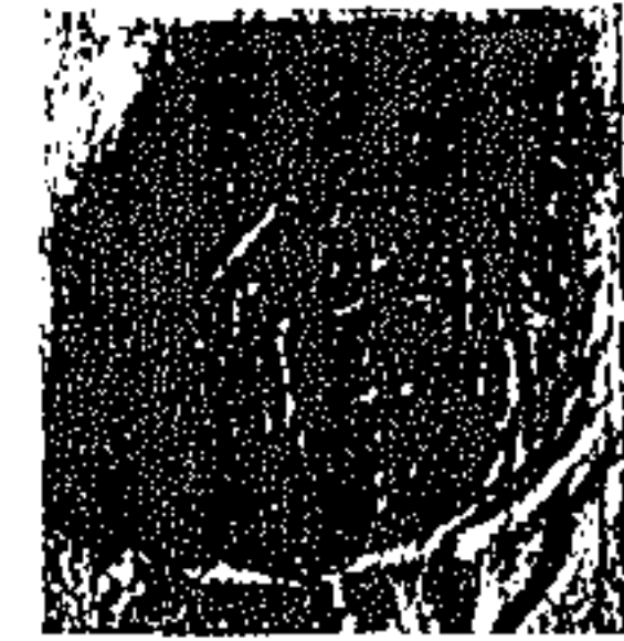
ΣΦΡΑΓΙΔΕΣ ΤΟΥ ΚΑΡΔΙΝΑΛΙΟΥ ΒΗΣΣΑΡΙΩΝΟΣ