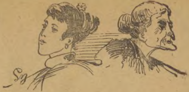
Τά άπρόσωπα τής άπογραφής 'Η μητέρα. 'Η κόρη.