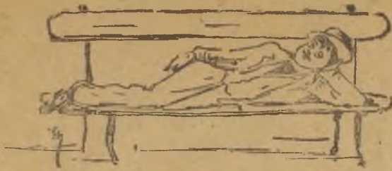
Ζητείται πού άπογράφη.