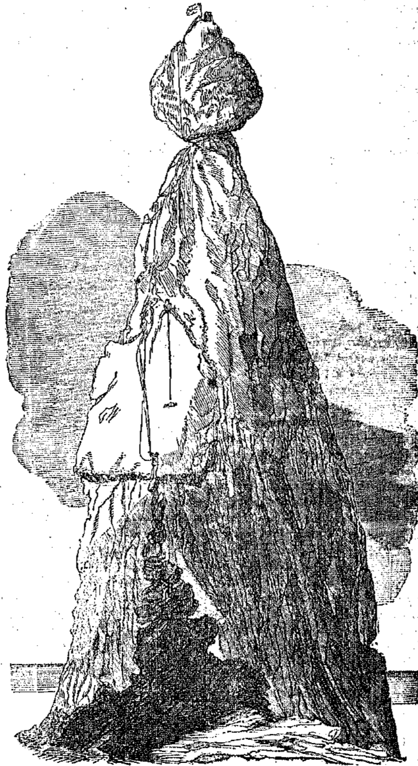
μαζομένης ἄλλοτε, ἔχει τὴν περιμέτρον διὰ τὸ χιλίο- μέτρον ὕψος του, ὅσω διὰ τὴν πᾶντὴν ἰδιόρρυθμον κα- γουσαν πανταχόθεν τῆς βάσεως τῆς. Ὠμί- ται τῆς ν. τοῦ. Μετὰ μαζὰν σειρὰν ὄρων ἐπέρχεται: αὐτὴ μὲν κεραλίη, ὁ δὲ βράχος λαιμῶν, καὶ

βαλαία φάραγγ, καὶ μετ' αὐτὴν ἀνοψοῦται τὸ τοῦτο, τὸ ὅποιον στέφεται, οὕτως εἰπεῖν, ἀπὸ χον ἐκατόμμετρον, ὁμοιάζοντα καὶ δυνάσταν, τις καὶ αὐτὸς στέφεται ἀπὸ ὀγκώδη πέτρας,