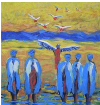
Δημήτρης Καρβέλας. Αναχώρηση (2009). Ακρυλικό σε μουσαμά. Ευγενική προσφορά.

η Σχολή Επιστημών Υγείας του Πανεπιστημίου Ιωαννίνων ο Τομέας Φιλοσοφίας της Φιλοσοφικής Σχολής του Πανεπιστημίου Ιωαννίνων το Εργαστήριο Βιοηθικής του Πανεπιστημίου Κρήτης και η Εθνική Σχολή Δημόσιας Υγείας