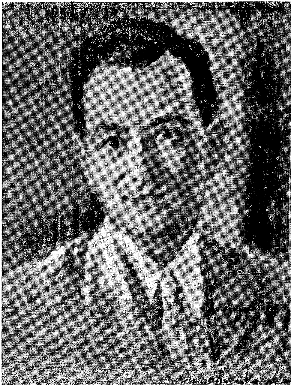
ΜΙΧ. ΠΕΡΑΝΘΗΣ — Παστέλ της Θάλειας Φλωρά — Καραβία (1953)