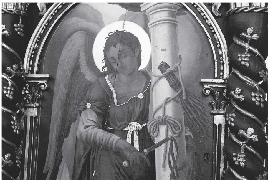
Εικ. 5. Ναός Αγίου Δημητρίου, Αρχάγγελος Γαβριήλ στην βόρεια θύρα του ιερού, μέσα 19ου αιώνα