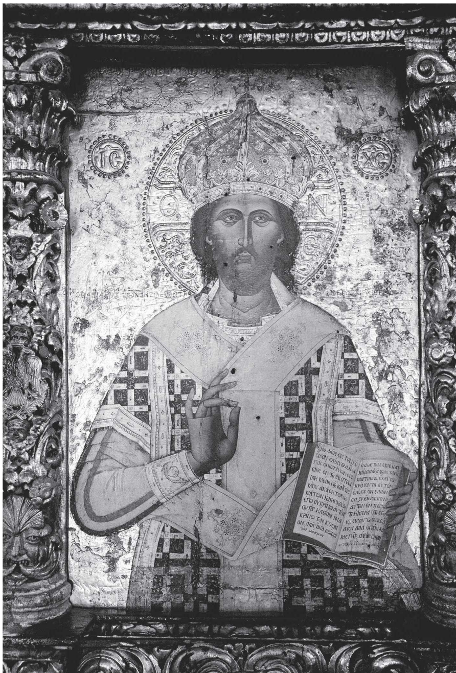
Εικ. 2. Ναός Αγίου Μηνά, Κωνσταντίνου Κονταρίνη, Χριστός Μέγας Αρχιερέυς, 1731