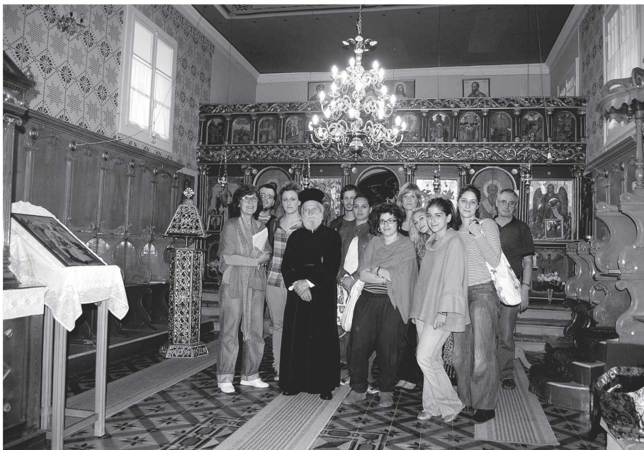
Εικ. 8. Στο ναό του Αγίου Χαράλάμπους στο Φρύνι