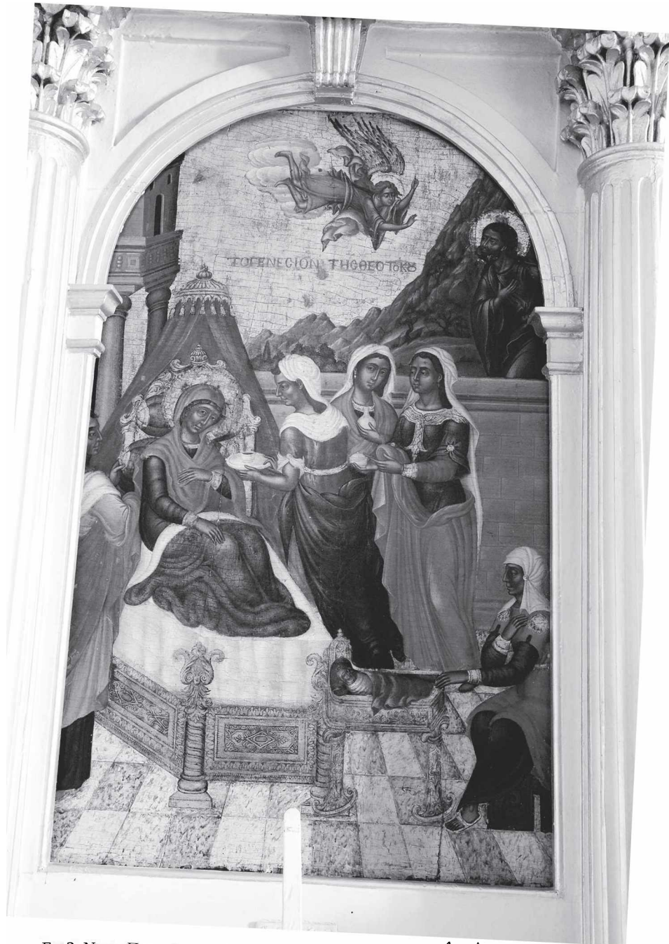
Εκ. 3. Ν 4τ π... »ν «iv» Η Γέννηση της βατ ^ ^