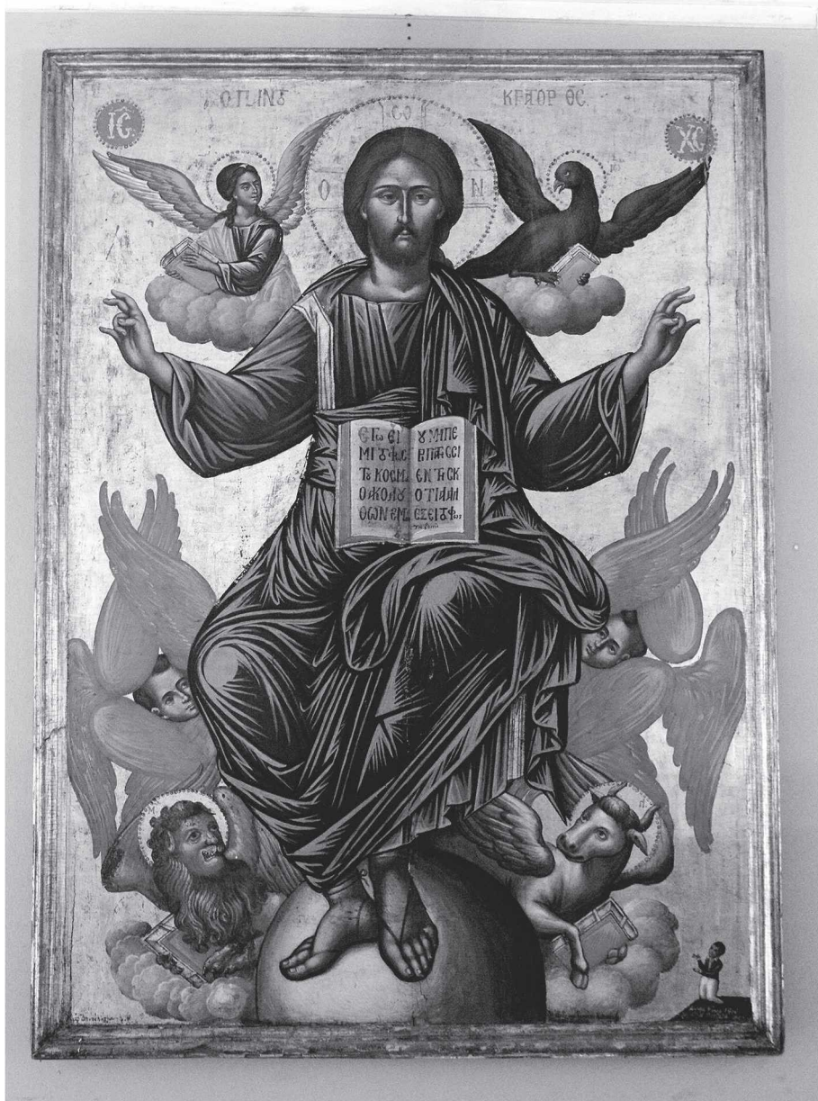
Εικ. 6. Ναός Παντοκράτορος, Ο Χριστός εν Δόξη, «χειρ Δανιήλ ιερομονάχου 1842»