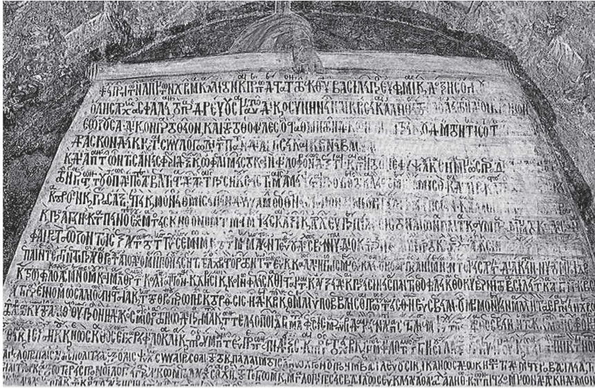
Είκ. 2. Μονή Θεοτόκου Ὁδηγήτριας (Βροντοχίου). Χρυσόβουλλο Ἄνδρονίκου Β' Παλαιολόγου (1314/15) [Gerstel 2013, σ. 340, fig. 5]