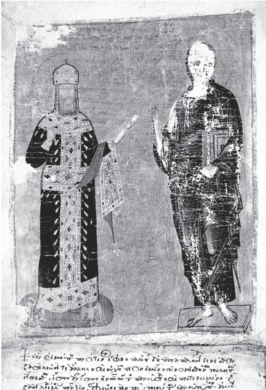
Εικ. 1. Χρυσόβουλλο Ανδρονίκου Β' Παλαιολόγου (ετ. 1301) πρὸς τὴ Μητρόπολη Μονεμβασίας (ΒΧΜ ἀρ. 534)