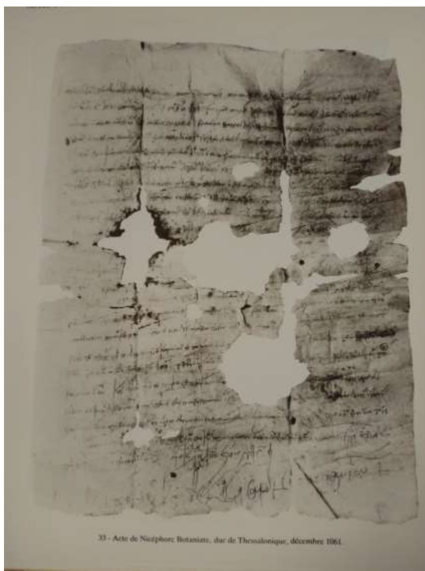
Εικόνα 3: Έγγραφο του Νικηφόρου Γ΄ Βοτανειάτη, δούκα Θεσσαλονίκης, Δεκέμβριος 1061..