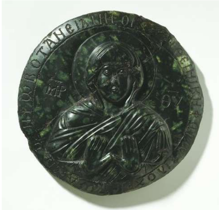
Εικόνα 10: Πλακίδιο από πράσινο οφίτη, με την Παναγία στηθαία σε δέηση, το οποίο σύμφωνα με την επιγραφή του ανήκε στον Νικηφόρο Γ΄ Βοτανειάτη. Victoria and Albert museum, London, A.1:1, 2-1927.