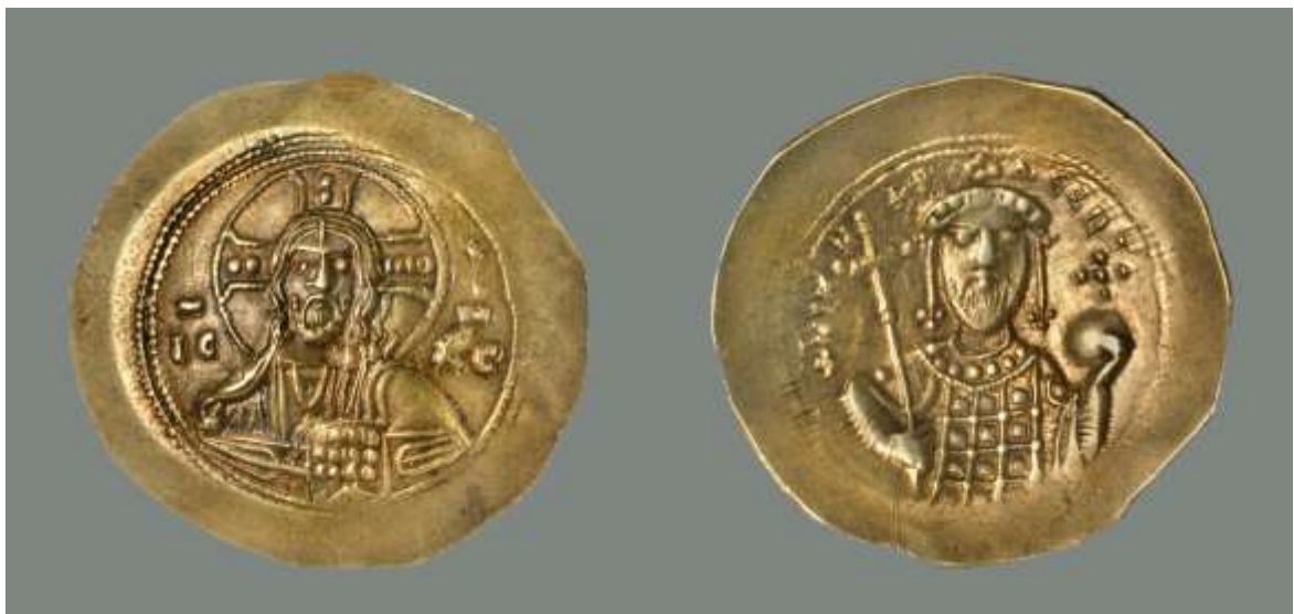
Εικόνα 9: Ιστάμενο νόμισμα του Νικηφόρου Γ΄ Βοτανειάτη.

Ουάσινγκτον, Dumbarton Oaks, DOC 3, no. 1.3