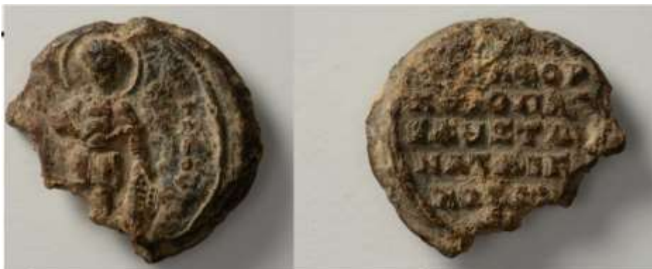
Εικόνα 6:Νικηφόρος Βοτανειάτης , κουροπαλάτης και δουξ Ανατολικών. Ουάσινγκτον, Dumbarton Oaks, Fogg 1571 (φωτ. DO Seals 3, no. 86.18. Cf. Zacos-Veglery, no. 2690).