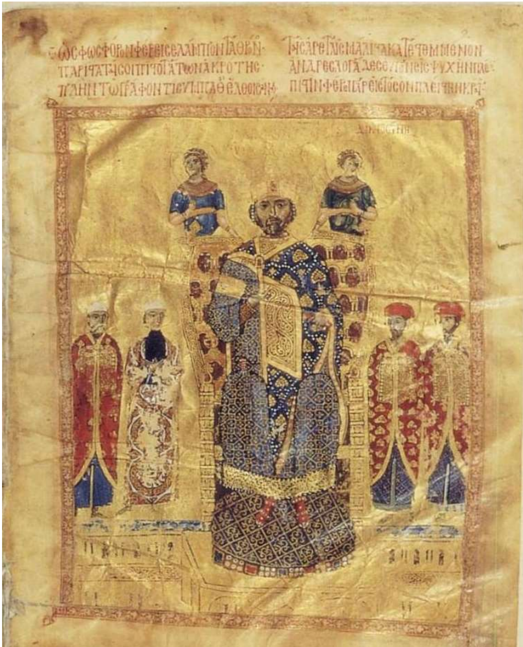
Εικόνα 1: Ο αυτοκράτορας Νικηφόρος Γ΄ Βοτανειάτης ανάμεσα σε αυλικούς αξιωματούχους. Μικρογραφία από χειρόγραφο με Ομιλίες του Ιωάννου Χρυσοστόμου (Bibliothèque Nationale de France).