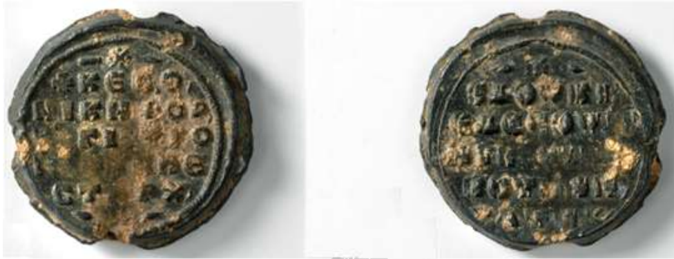
Εικόνα 5:Νικηφόρος Βοτανειάτης, μάγιστρος, βέστης, βεστάρχης και δουξ Εδέσσης και Αντιοχείας. Ουάσινγκτον, Dumbarton Oaks, Fogg 175 (φωτ. DO Seals 5, αρ. 9.2- Zacos-Veglery, no. 2686).