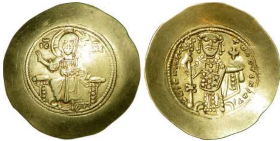
Εικόνα 8: Ιστάμενο νόμισμα του Νικηφόρου Γ΄ Βοτανειάτη.