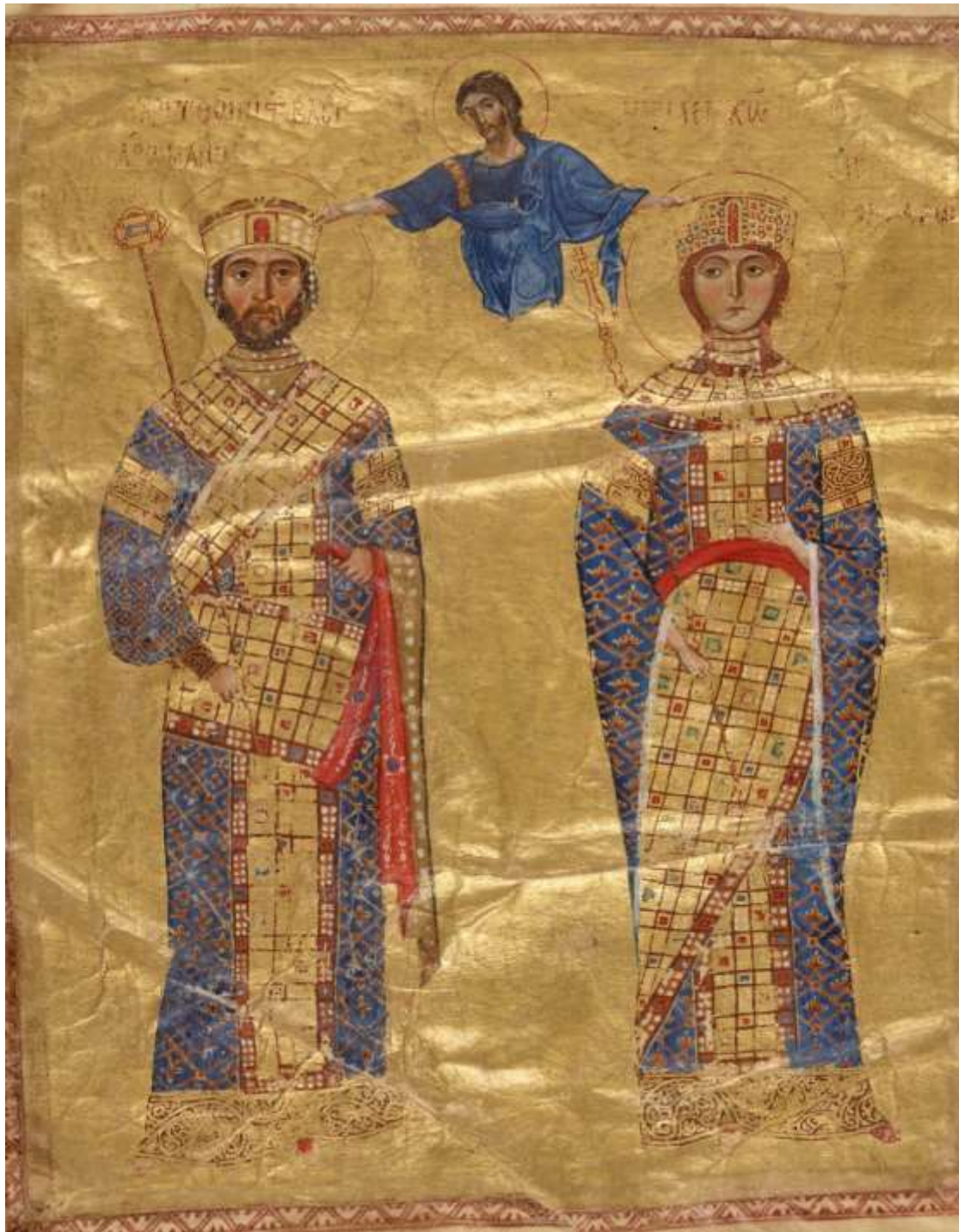
Εικόνα 2: Ο γάμος του Νικηφόρου Γ' Βοτανειάτη με τη Μαρία της Αλανίας. Μικρογραφία από χειρόγραφο με Ομιλίες του Ιωάννου Χρυσόστομου (Bibliothèque Nationale de France).