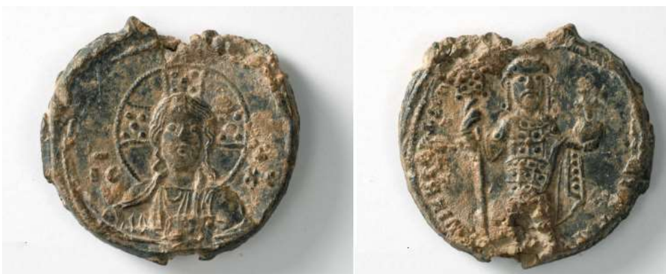
Εικόνα 7:Νικηφόρος Γ΄ Βοτανειάτης (1078-1081). Ουάσινγκτον, Dumbarton Oaks, Fogg 1679.