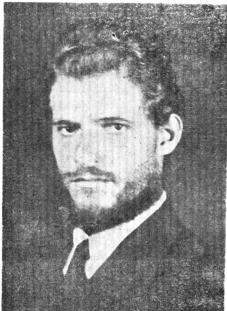
Κατὰ τὴν πρώτην ἐπίσκεψίν του στὴν Ἑλλάδα.