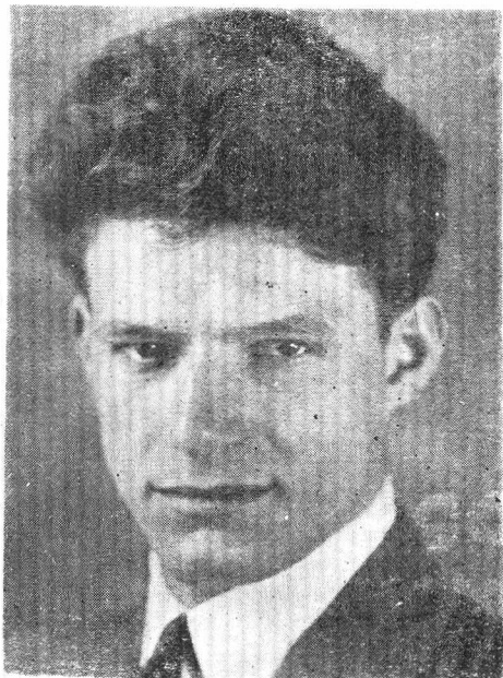
Ἦταν ἄρχισε νὰ γράφει τὸ «Ὀδοιπορικό» του.

Ἦ Ἄνθρωπος· τὰ προβλήματα του· τραγωδία· καλὸ καὶ θέληση· Ἦ Ἀπειρο· Αἰώ-