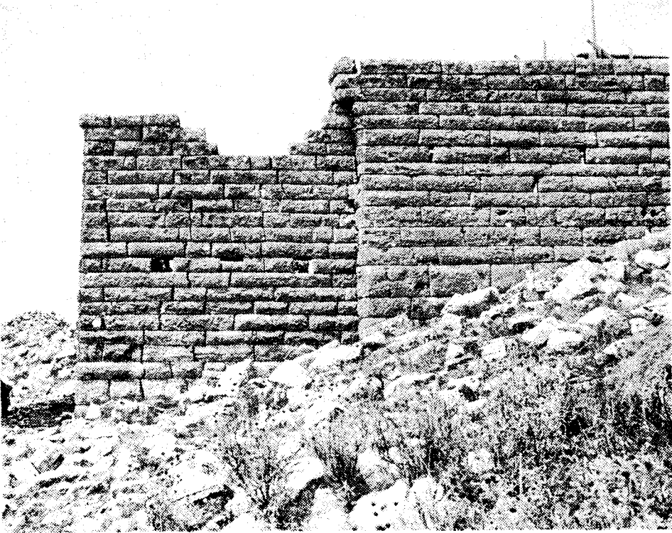
Εἰκ. 3. Νότια ὕψη τοῦ σπιτιοῦ 1, μὲ τὴ μεταγενέστερη προσθήκη ἀριστερὰ

δωμάτιο, 1, μὲ τὸ δάπεδο πολὺ βαθύτερα, θὰ χρησίμευε μᾶλλον γιὰ ἡμιυπόγεια ἀποθήκη. Μιὰ μικρὴ τομὴ στὴ νότια πλευρὰ ἔδειξε ὅτι τὸ δά-