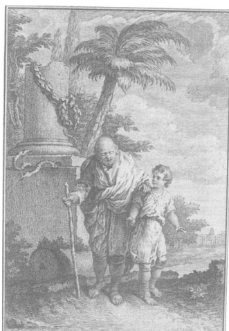
Εικόνα 5. (Ο Βελισάριος του Hubert Gravelot. 123. M. MIERSCH, "Belisar" σελ.170)