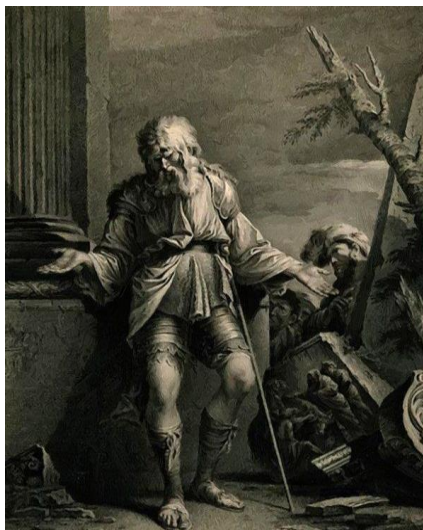
Εικόνα 4. (Ο Βελισάριος του Salvator Rosa. K. WESCHENFELDER, "Belisar und sein Begleiter. Die Karriere eines Blinden in der Kunst vom 17. bis zum 19. Jahrhundert", Marburger Jahrbuch für Kunstwissenschaft 30, 2003 σελ.250)