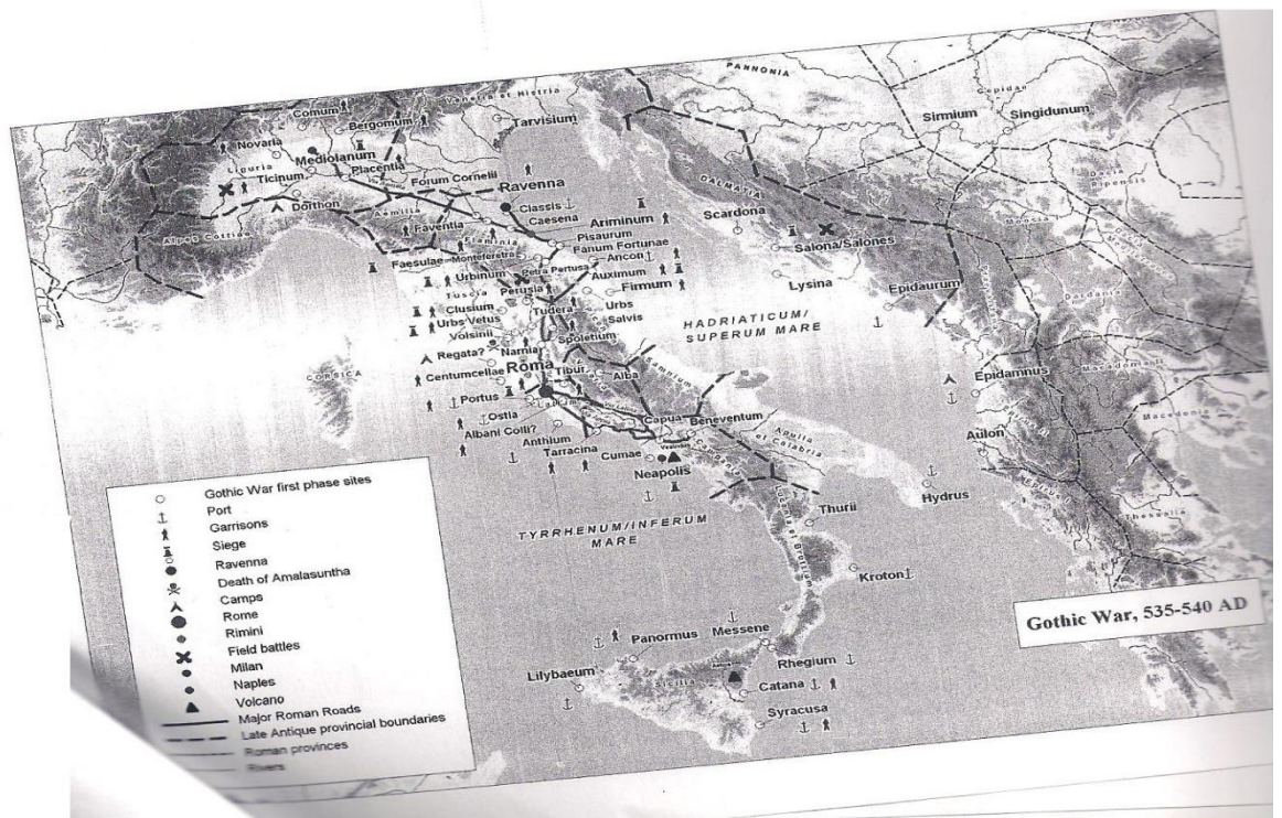
Εικόνα 1. (Η Ιταλία και οι περιοχές που ευρίσκοντο στο επίκεντρο κατά τον πρώτο Ιταλικό πόλεμο.)