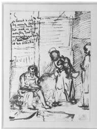
Εικόνα 3. (Ο Βελισάριος του Ρέμπραντ. W. JAEGER, "The Blind Belisar as Beggar" σελ.120)