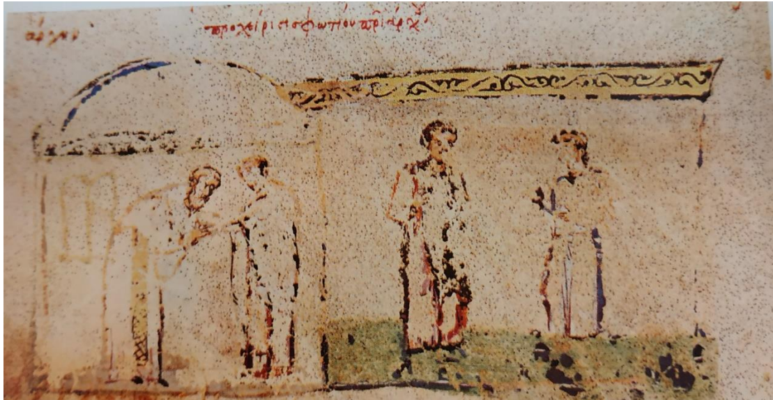
Εικόνα 1: Μικρογραφία 187, Fol. 76v, κάτω ὠα: Χειροτονία του Πατριάρχη Φωτίου, του Codex Vitr. 26-2, ο οποίος περιέχει την Σύνοψη Ιστοριών του Ιωάννη Σκυλίτζη και φυλάσσεται στην Εθνική Βιβλιοθήκη της Μαδρίτης ( Skylitzes Matritensis )