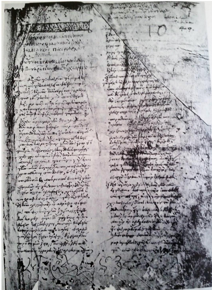
Πίνακας 1: Marcianus gr. 450 (A) , fol. 1r (10 ος αι.)

(πρβλ. W. TREADGOLD, «The Preface of the Bibliotheca of Photius: Text, Translation, and Commentary», DOP 31 (1977), σ. 342)