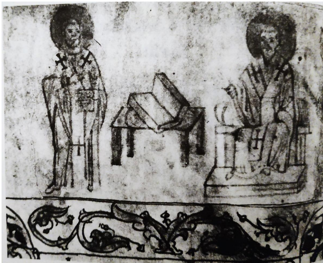
Εικόνα 2: Άθως, Μεγ. Λαύρα, κώδ. 449, f. 0v, Ο Φώτιος και ο επίσκοπος Αμφιλόχιος, (πρβλ. W. Treadgold, The Nature of the Bibliotheca , προμετωπίδα)