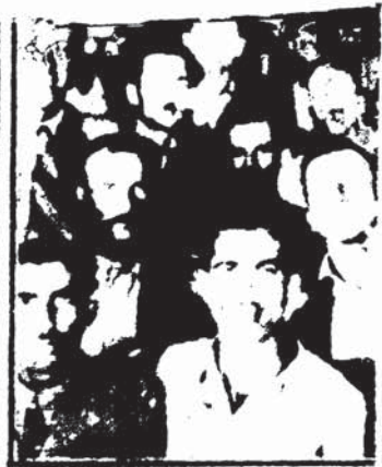
ΟΙ ΑΡΤΕΡΓΑΤΑΙ ΤΟΥ ΠΕΙΡΑΙ... Ο κ. Γεωργίου...