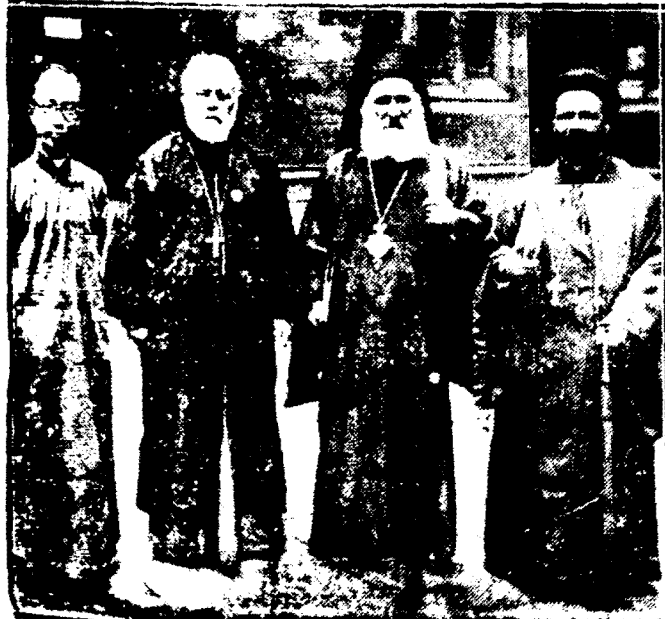
ΕΞ ΑΡΙΣΤΕΡΩΝ ΠΡΟΣ ΤΑ ΔΕΞΙΑ: Ὁ Παναρχὸς τῶν Ἰνδῶν Χριστιανῶν, ὁ σεβασμιώτατος Μητροπολίτης Φινίκων κ. Γερμανός, ἀρχιεπίσκοπος τοῦ Οἰκουμένου Πάτριάρχου, ὁ ἐκλεκτός ἀρχιεπίσκοπος, καὶ σεβασμιώτατος Μητροπολίτης Κορυθῆς κ. Εὐλόγιος Κουρίας, καὶ ὁ Κόστος Πάτριάρχης, φωτογραφηθέντες ἐν Ἐδιμβούργῳ.

Ἀπὸ ἐτῶν πολλῶν ἡ «οἰκουμένη κίνησις» γινόμενη ὑπὸ τὴν Ἑσπερίαν Προτεσταντῶν καὶ ἰδίᾳ τῶν Ἀγγλικανῶν, διαργαζομένη πολλὰ συνέδρια χριστιανικὰ παγκόσμια πρὸς ἑνωσὶν τῶν ἐκκλησιῶν. Ἐφ' ἑστές συνήλθον δύο τοιαῦτα τὸ ἐν Ὁξφορδῇ τῆς Ἀγγλίας καὶ τὸ ἐν Ἐδιμβούργῳ τῆς Σκωτίας. Καὶ τὸ μὲν πρῶτον ὁργανώθη ὑπὸ τῆς ἑνώσεως τοῦ «Πρακτικοῦ χριστιανισμοῦ» ἢ «Σωῆς καὶ ἔργου» (Life and Work) καὶ διήρκεσεν ἀπὸ τῆς 12—26 Ἰουλίου. Τὸ συνέδριον τοῦτο ἀποβλέπει εἰς τὴν διέκδοσιν τῶν ἀρχῶν τοῦ χριστιανισμοῦ ἐπὶ τῶν νεωτέρων κοινωνιῶν καὶ τὴν