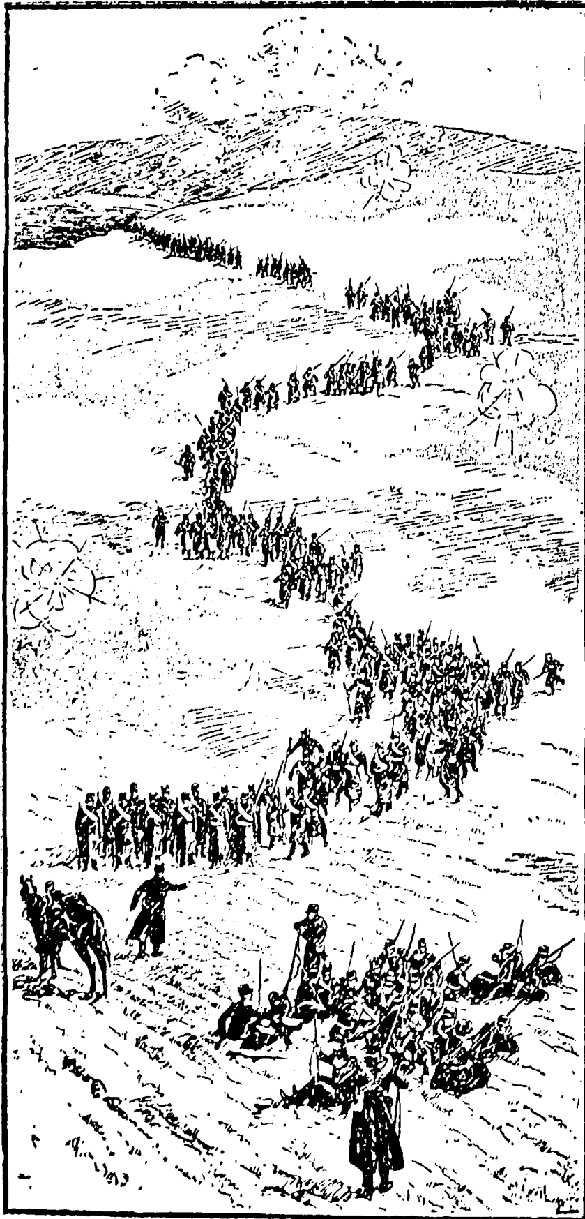
Σώμα ελληνικού στρατού μεταβαίνον εις ενίσχυσιν Ούδωας εν Βελεστίνω.