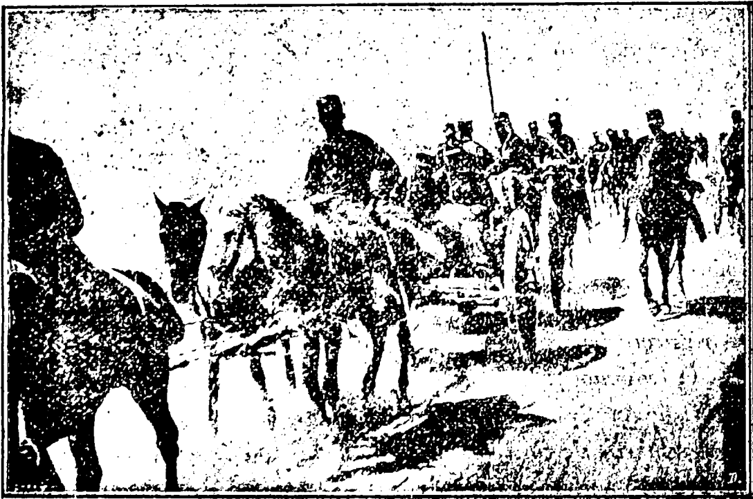
Ἡ πυροβολαρχία Μάτσα βαίνουσα ἐκ Φερβάλων εἰς Βελεστίνον.