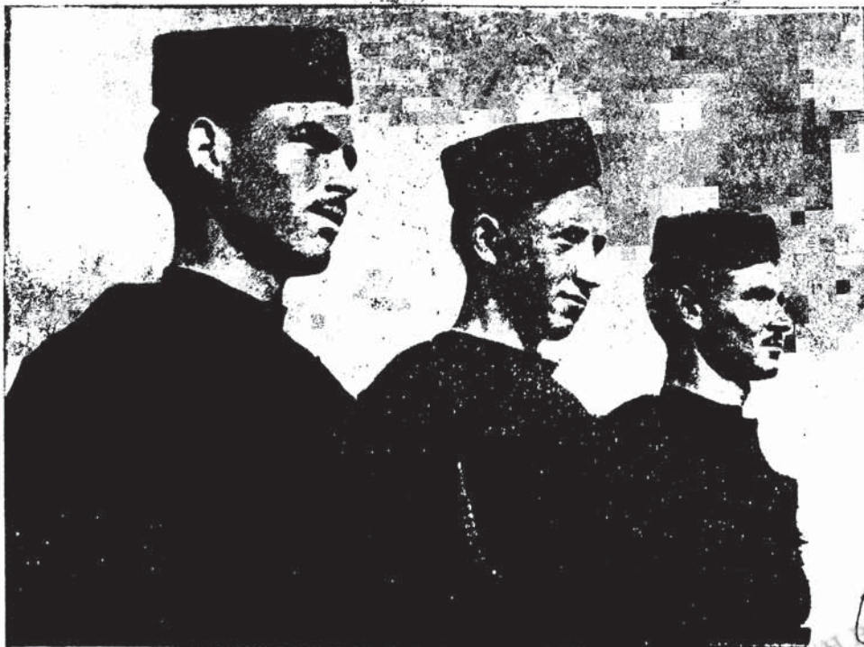
Λεβεντόκορμοι Μετσοβίτες με τοπικὴν ἔνδυμασίαν

ΜΗΝΙΑΙΑ ΕΠΙΘΕΩΡΗΣΙΣ ΑΓΡΟΤΙΚΟΥ - ΟΙΚΟΝΟΜΙΚΟΥ - ΠΟΛΙΤΙ- ΚΟΥ - ΚΟΙΝΩΝΙΚΟΥ ΠΕΡΙΕΧΟΜΕΝΟΥ