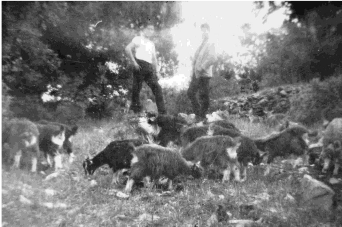
Βοσκή κοπαδιού στο Λιθερό