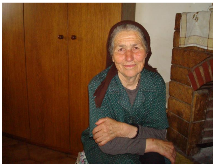
Γ.Η/Αγρότισσα του Λιθερού