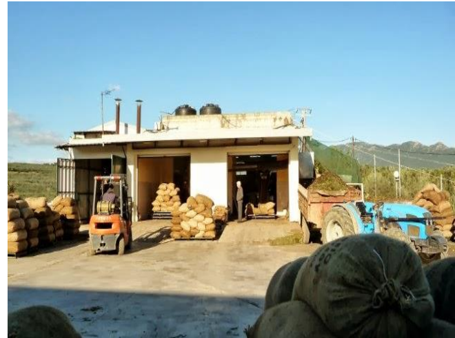
Διαχωριστήρας ελαιόλαδου-Εξωτερική απεικόνιση ελαιοτριβείου