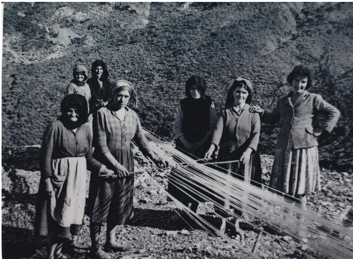
Γυναίκες του Λιθερού σε ζέλαση