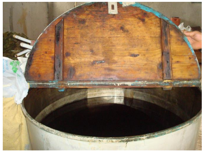
Δοχείο αποθήκευσης λαδιού, «λιμπί»