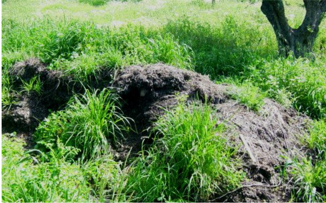
Κοπριά για λίπασμα