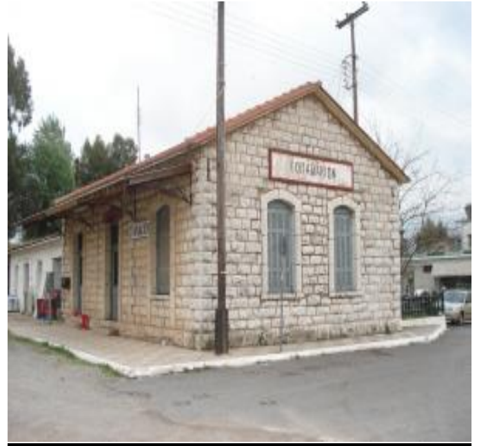
Ο Σταθμός του Λιθερού