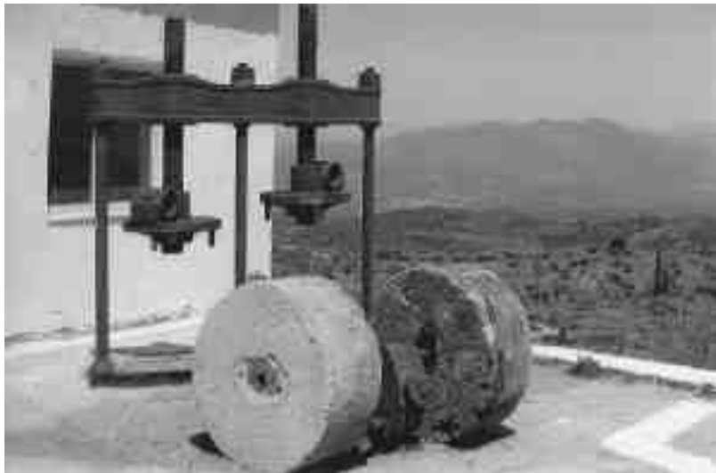
Εικόνες του χθες από το παραδοσιακό ελαιοτριβείο του κ. Καπέλιου

λιθάρια και ο καρπός μετατρεπόταν σε ζύμη. Το ζώο και πιο παλιά ο εργάτης περιστρέφονταν γύρω από το αλώνι, β)Υπήρχε ένας πάγκος ή μια τραπεζαρία που έβαζαν τους σάκους (τσαντίλια) τους οποίους γέμιζαν χαμούρι με κουβά και ανάλογα με το μέγεθος του πιεστήριου το στάμα χωρούσε από 100-200 οκάδες, γ)Το καζάνι, μέσα στο οποίο έβραζε νερό και μεταφερόταν μέσω ενός σωλήνα στο πιεστήριο και δ)Το πιεστήριο, το οποίο ήταν μια πέτρινη βάση πάνω στην οποία τοποθετούνταν τα τσαντίλια, γεμισμένα με τον ελαιόκαρπο. Στη συνέχεια οι εργάτες κατέβαζαν τον κοχλιωτό άξονα που συμπιέζε τα τσαντίλια ώσπου να βγει το λάδι. Συγχρόνως έριχναν στα τσαντίλια καυτό νερό για να κάνουν ευκολότερη την εξαγωγή. Αυτή η διαδικασία επαναλαμβάνεται πολλές φορές ώσπου να μείνει στο τέλος το λιοκόκκι, το οποίο πουλούσαν για ζωτροφή.