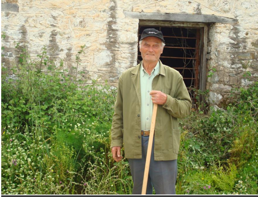
Ν.Γ/Αγρότης του Λιθερού