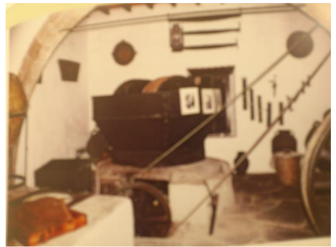
Ζωοκίνητο ελαιοτριβείο-Μηχανοκίνητο ελαιοτριβείο