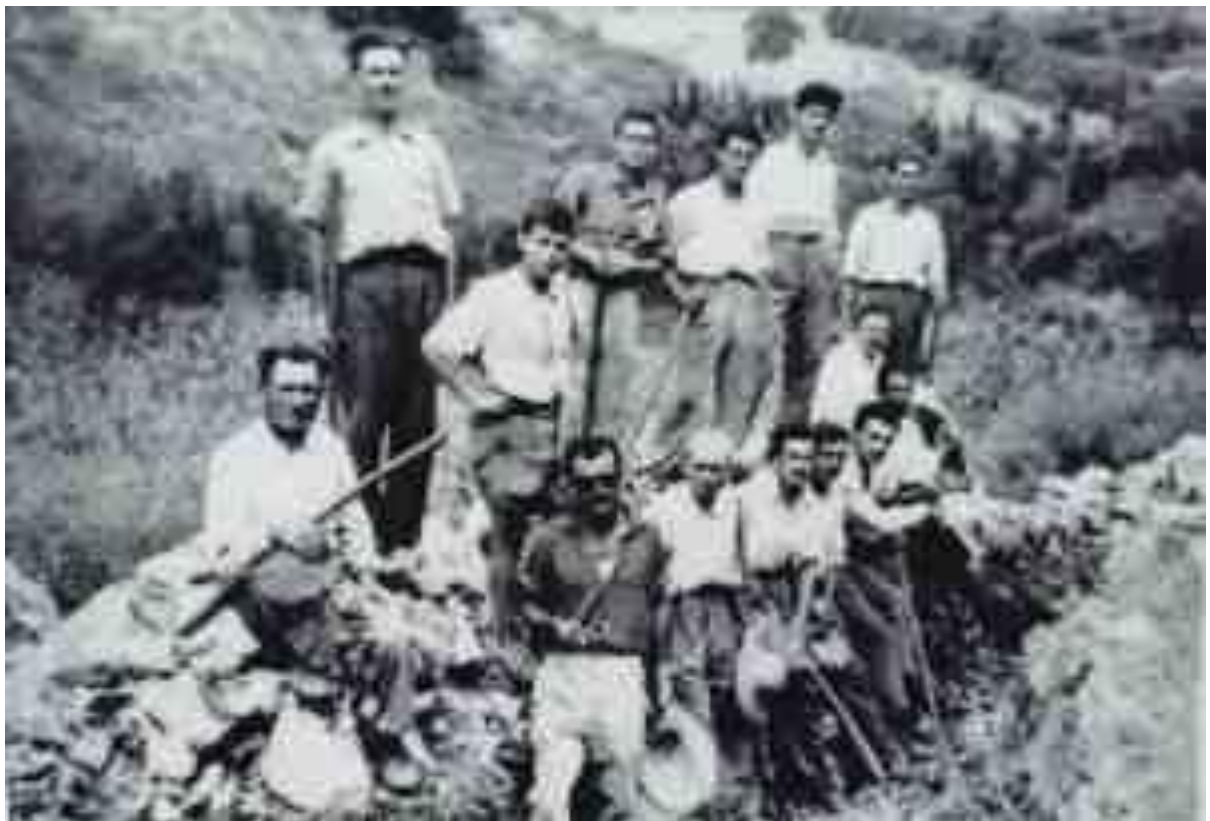
Ανοιγμα γράνας για πόσιμο νερό με προσωπική εργασία (από πηγή Μίκαρι προς δεξαμενή Κοπανακίου)