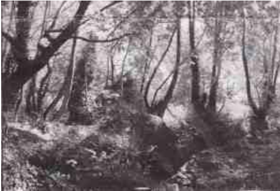
Φωτογραφική αποτύπωση του ποταμού Μίκαρι