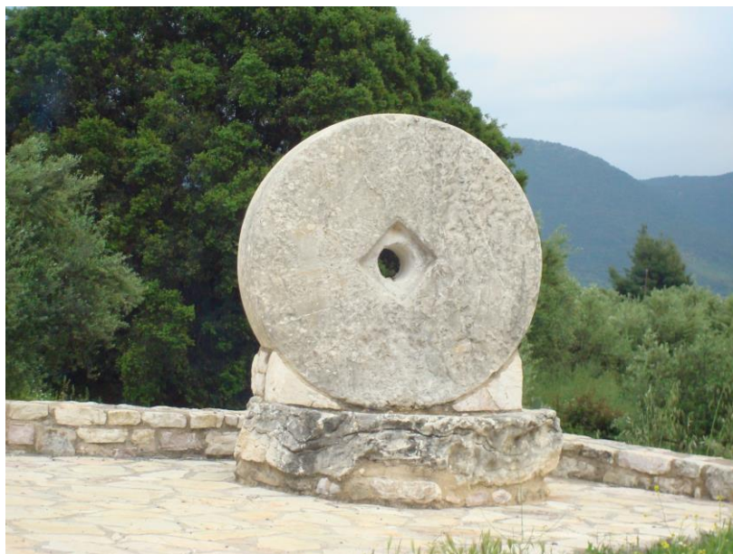
Μυλόπετρα, απομεινάρι παλιού ελαιοτριβείου του χωριού