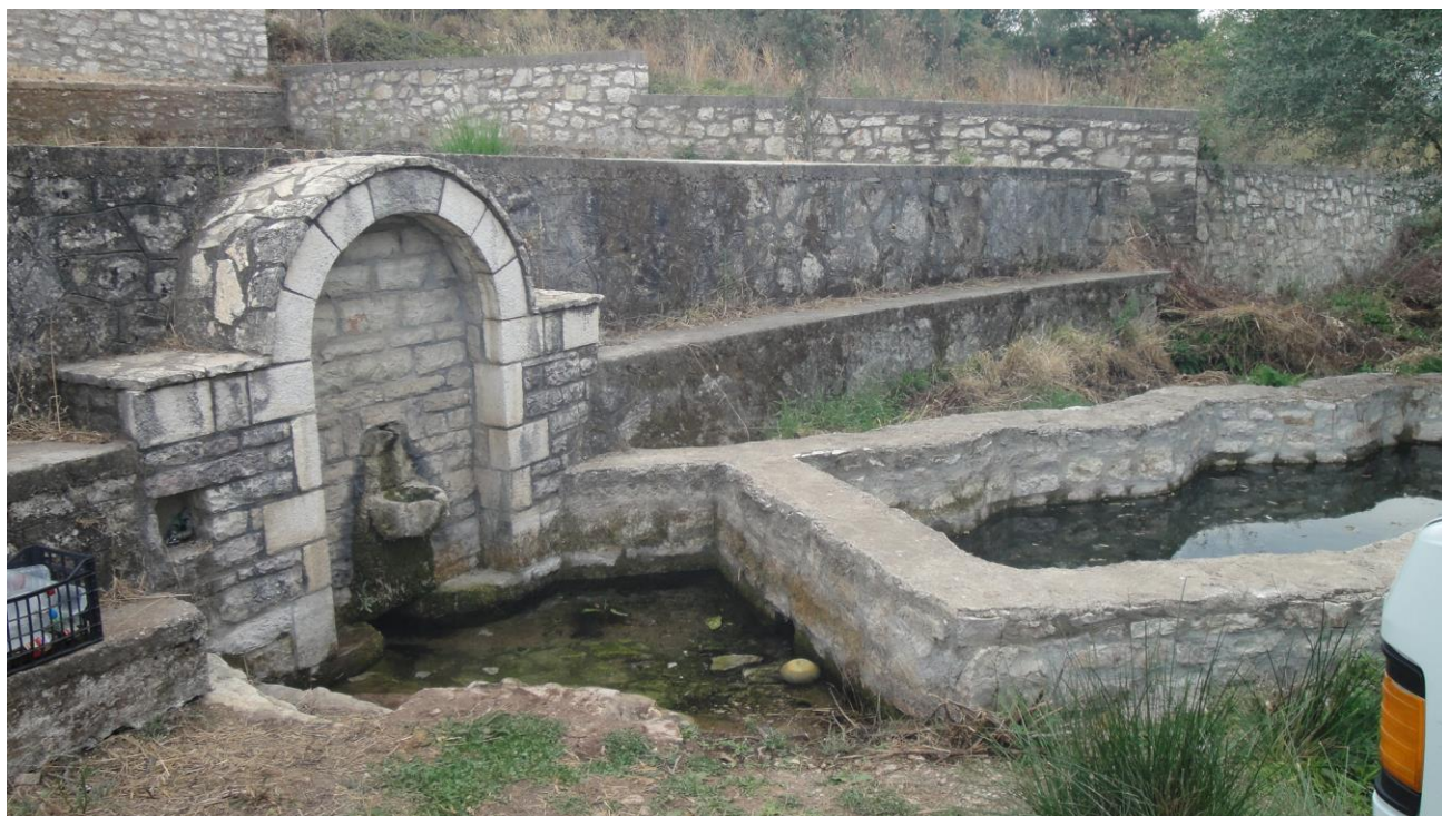
Η βρύση Κρο-Κοπανάκι

«Μια γυναίκα έπλενε, κοπάναγε, αλλά του Τούρκου κάτι του έπεσε. Και γυρίζει πίσω τον υπηρέτη του και του λέει κοπανάκι...κοπανάκι...κρο-κοπανάκι, κρο- κοπανάκι και έμεινε κρο-κοπανάκι...» (συνέντ. 21/6/2014, Σ.Σ)