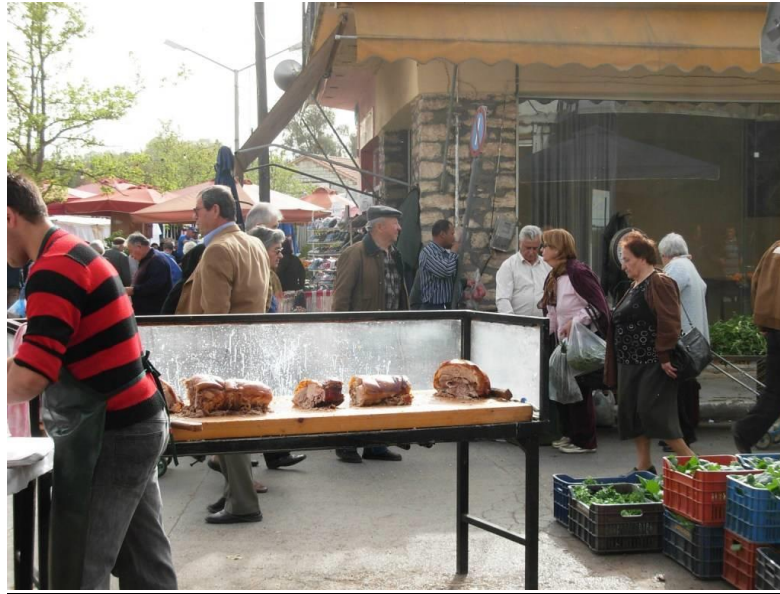
Το Κυριακάτικο Παζάρι, με το παραδοσιακό του έδεσμα, την γουρνοπούλα