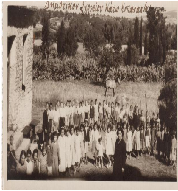
Δημοτικό σχολείο Κοπανακίου 1953