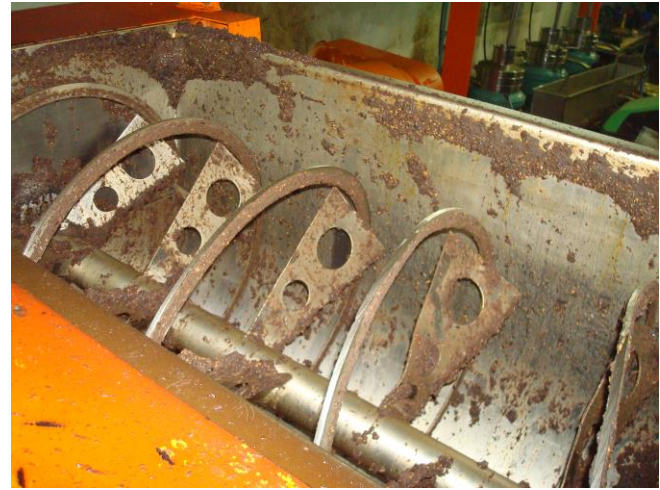
Μηχανοκίνητο ελαιοτριβείο Λιθερού-Μαλακτήρας