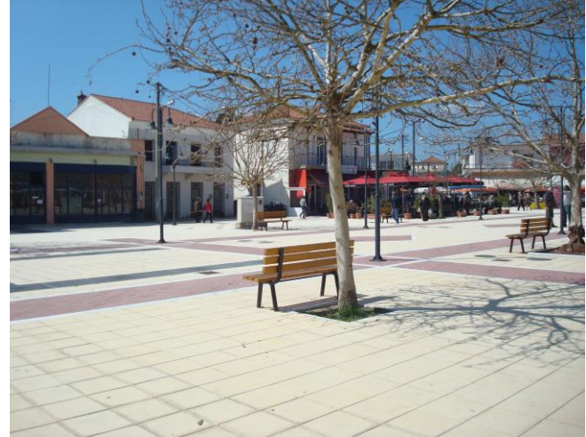
Η πλατεία του χωριού το 2005 (αριστερά) και το 2015 (δεξιά)