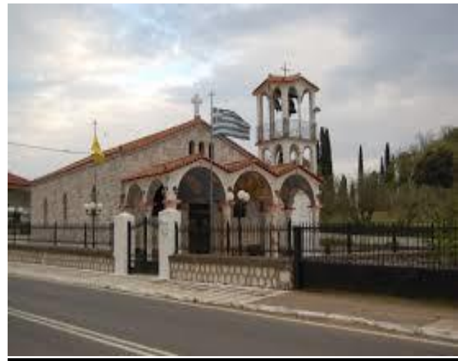
Ιερός Ναός Αγίου Γεωργίου Λιθερού