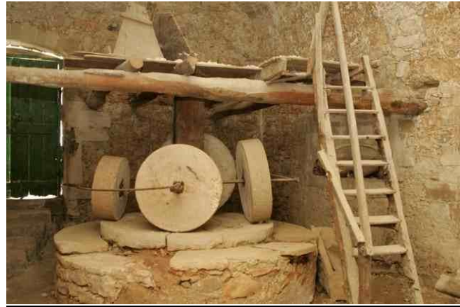
Τσαντίλια ή τσολιά-απομεινάρι ελαιοτριβείου