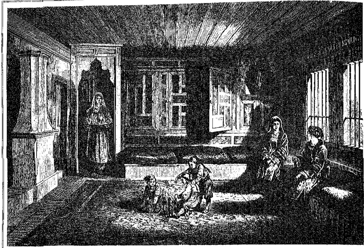
ΛΙΘΟΣΤΑ ΕΝ ΒΟΥΤΑΓΑΡΙΚΗ ΟΙΚΙΑ.