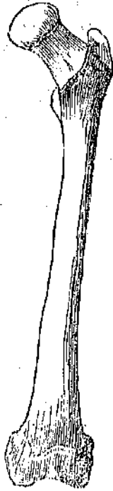
μηριακόν όστ. αν

χει σωληνοειδή κοιλότητα, ένθα εύρίσκεται λιπαρά ύλη, καλο- μένη μυελός· ο μυελός ούτος δέν έχει νεύρα ούτε πνοει· εύρίσκεται όμως περιεκαλυμμένος υπό λεπ- τοτάτης μεμβράνης, έχούσης πολλά νεύρα και άγγεία και ούσης πολύ εύαισθητού προς πόνο· Καί αυτή ή ύλη του όστού δέν πνοει κοπιώδη πνοει δέ τό περιόστεον, όπερ ώσαύτως άποτελείται εκ λεπτοτάτης μεμβράνης έχούσης νεύρα και άγ- γεία. Άγνωστον είνετι είνε προς τι χρησιμεύει εις τον διοργανισμόν ο μυελός των όστών.