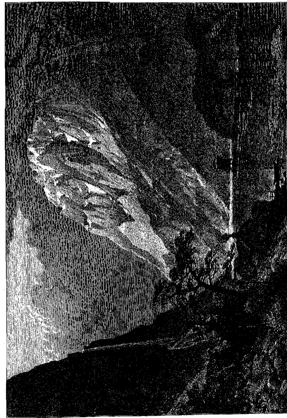
Ο ΚΑΛΙΟΣ ΤΟΥ ΝΑΪΡΟΥ ΕΝ ΝΟΡΒΗΓΙΑ.