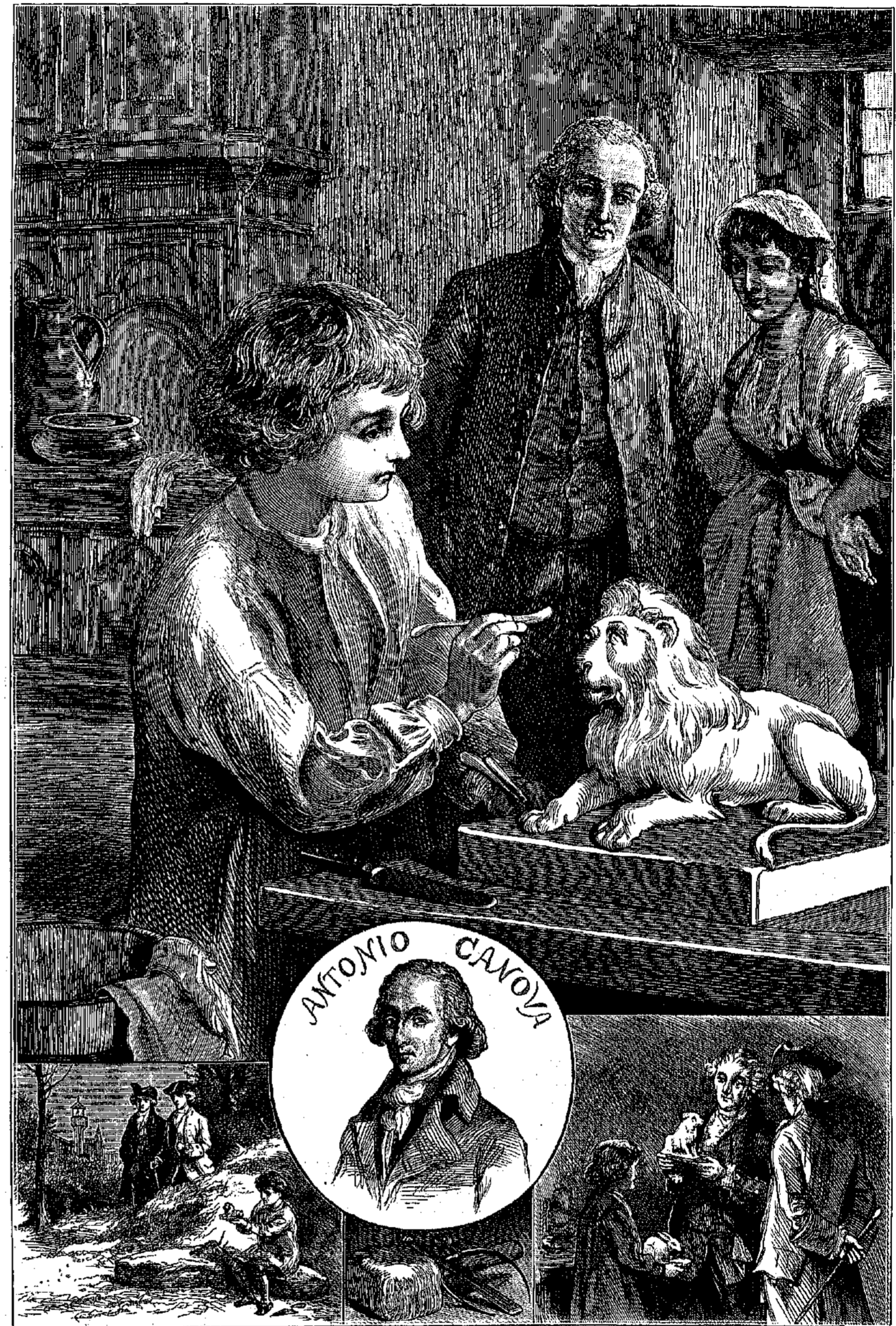
Ο ΑΝΤΩΝΙΟΣ ΚΑΝΟΒΑΣ ΕΝ ΤΗ ΠΑΙΔΙΚΗ ΗΛΙΚΙΑ.