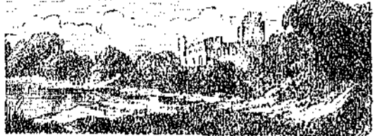
ΤΑ ΘΥΜΑΤΑ ΤΩΝ ΑΘΗΝΑΙΩΝ.

Ἐπὶ ἱκανὰ ἔτη ἔμεινε ὁ Ἀντώνιος ἐν τῇ οἰκίᾳ τοῦ προστάτου αὐτοῦ. Μετὰ δὲ τὸν θάνατον τοῦ κόμητος ἀνθρωπίνως ὁ νεανίας ἤρτησε νὰ διδῇ τὰ πρῶτα ἀγάλματα τῆς μεγάλης αὐτοῦ εὐφυΐας, καὶ κατέστη ὁ ὑπὸ τῆς ὑψηλοῦς συμπαύσης θαυμαζόμενος καλλιτέχνης, ὁ μέγας γλύπτης Ἀντώνιος Κανόβας.