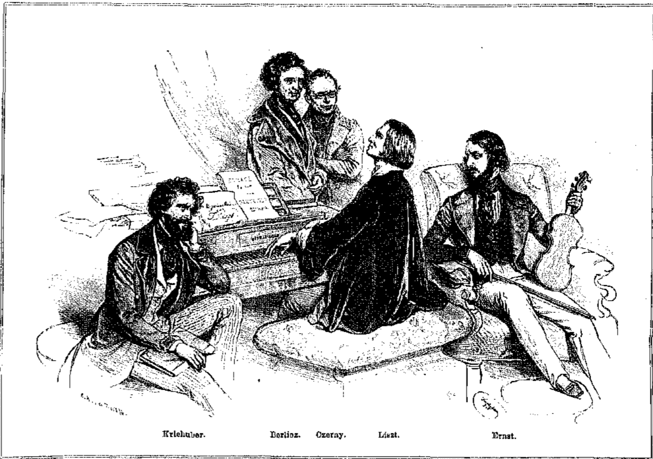
ΕΝ ΤΗ ΟΙΚΙΑΙ ΤΟΥ ΛΙΣΤ ΕΝ ΒΙΕΝΝΗΙ.

Ο θάνατος του Άλεξάνδρου Vauclay έθτα τέμα εις δια τή σχέδια περί διαρρυσίσεως τής κεντρίας Αφρικής, τή όπια συνέλαβεν ο τολμηρός πρόεδρος. Βεβαίως τήν τόνον έπιμολχον και έπικινδύονον έπιχειρήσαν δεν ήδύνατο να