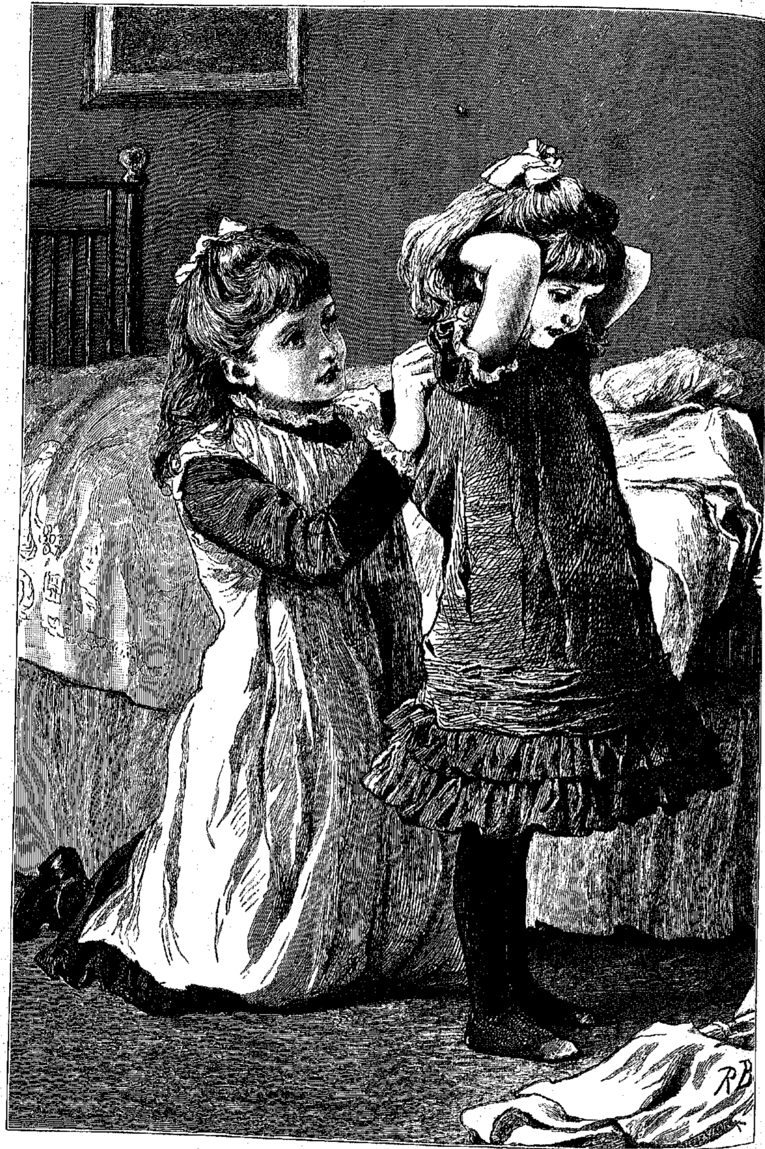
Η ΜΕΓΑΛΕΙΤΕΡΑ ΑΔΕΛΦΗ.