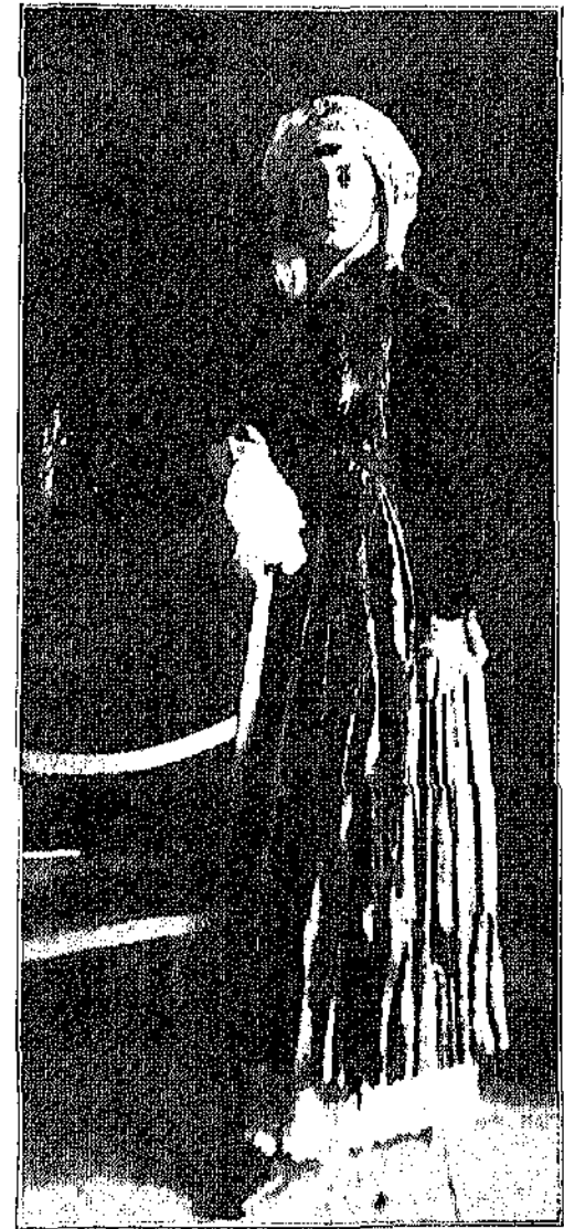
Ἐκτὸ τὴν ἐστὴν τοῦ Λουκ. τῶν Ἑλλήν. — Ἡ Δὲς Ἀλεξανδρινῆ ὡς κωπία Μοναρχοῦ τῆς Αὐλῆς τῆς Βασιλείας Ἀμαλίας

Ἐπειτα, τὴν στιγμή ποῦ εἶχε σηκωθῆ ὁ Μινοῦττας νὰ φύγη καὶ τοὺς χαιρετοῦσε ὅλους, ὁ γιατρός ἀποκοιμισμένος ἀπάνω πρὸ τραπέζι, εἶχε ξυπνήσει καὶ τεντώνοντας τὰ χερῖα του εἶχε ἀναποδογυρίσει μερικὰ ποτήρια. Ὁ Νάγκελ στὸ πλάι του εἶχε περιχυθῆ μὲ σιμακάνια. Πετᾶχτηκε ἀμέσως, τῆναξε γελώντας τὰ ροῦχα του καὶ φώναξε μ' ὅλην τὴν δύναμη: Ζήτωσῳ! Ὁ Μινοῦττας ἦταν ἀμέσως ἔτοιμος νὰ βοηθήσῃ. ἔβρεξε μαντίλια καὶ πετσέτια γὰρ νὰ στεγνώσῃ τὰ βρεμένα ροῦχα' περισσώτερο εἶχε βραχῆ τὸ