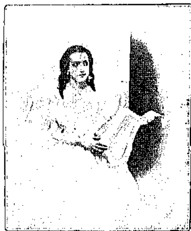
Διά Α. Αντωνιάδη, Κα Κυριακού

Είς τό Λεύκωμα αυτό άνεξήγησα και άνευθρον τίς φωτογραφίας των κυριών και δεσποινίδων