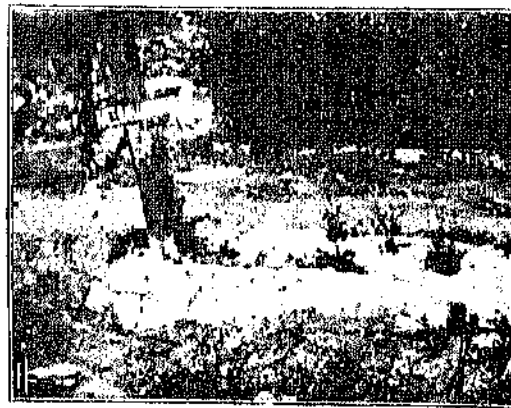
Ο τόπος του Παπαδιαμάντη στη Σκιάθο

Ένας σαρδός από λιθάρι κι' ένας σταυρός μισογυρισμένος απ' τους ανέμους, που διαλαλεί με μεγάλα άσπρα γυρίσματα το όνομα του χαμένου. Τίφους άλλως κοντά δεν έχει — μοναχός και στο θάνατο όπως ήταν μοναχός του και στη ζωή. Πλήθος από δένδρα σιωπηλά ύψωναν κενό φράγμα προς το βιάσος, για να μόνιμος ήσυχος ο ιδεολόγος στον ύπνο του, και τα άγριό-κολλα της νύχτας να μη τσιρίζουν το ξεφάντωμα της ψυχής του στις χαμπίνες τις μυστικές. Ο Παπαδιαμάντης τώρα υπάργει. Ένα λάθος ήταν που ήθελε στη ζωή των ανθρώπων — και ατύχως από εκείνες του βραδυσού, που έχουν εξήρα με το φως και έχουν με κάθε κίνηση που βουίζει και που φωνάζει. Γιατί ήταν το παιδί της ψυχικής ανήσυχης, γιατί μέσα του έφερα έναν έργο της ιδέας κι' έναν έρωστη των ταξιδιών. Από τη μικρή Σκιάθο αυτός, έβλεπε κι' έγύριζε όλον τον κόσμο, κι' ήταν παντού μισοστό. Ο άερας του πνευματικού πολιτισμού είχε φθάσει εις το φτωχικό του καλ και του είχε χαδέψη τις ιδέες. Κι' αν το ανθρώπινο του κλάττωμα, ν' αποφεύγει σαν άγριος το πλήθος, τον κρατούσε αποτραβηγμένον σε μιάν άφαντευαν άνοπαρξίαν — όμως ήλθε ο θάνατος, έχάθησε ο άνθρωπος ο παράξενος, και ο νοός