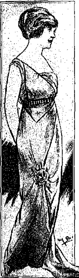
Φόρεμα χορού δια νεάνιδα από έλαφρό μεταξωτό

Έδω πρόκειται να μη χαθή ή «ιδέα» της αρχαίας φρο-