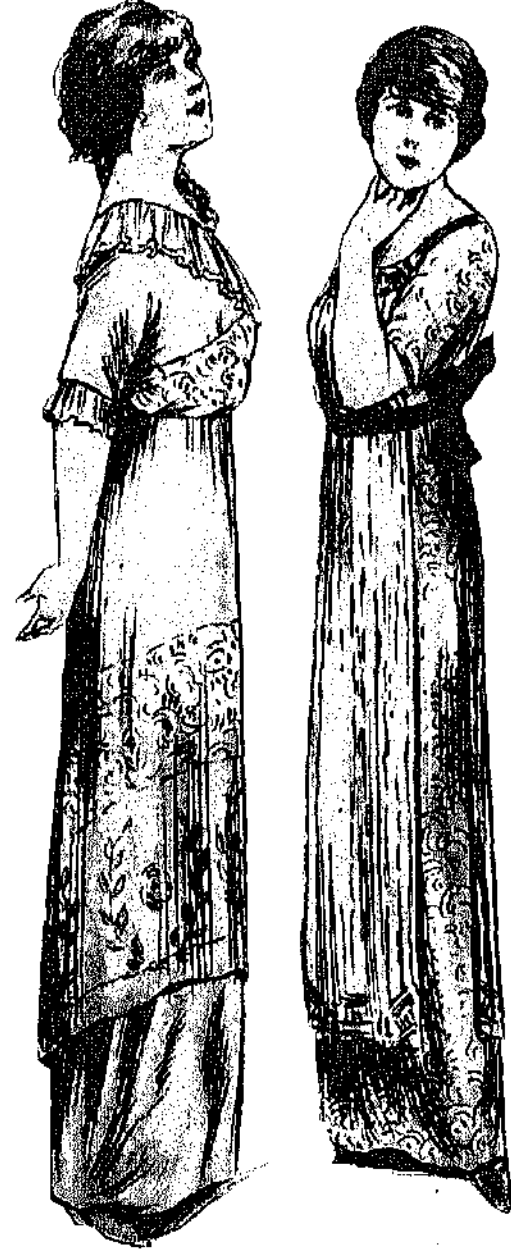
Φορέματα άπογευματινά δια νεάνιδας από έλαφρό τούχο ή μολινομέταξο φανερύ

μεγάλοι στον λαιμό όταν λείπουν τα κεντήματα, χονενοί ελεύθερα και πλούσια σαν τραχηλιές. Και γύρω γύρω, εκεί που άκουμβή ή τραχηλιά στον γυμνό λαιμό, στεφανίκια από μεταξωτά τριανταφυλλάκια όμοια στο χρώμα του φορέματος, είτε σκοτεινότερα. Όμως τότε πρέπει και στην μέση ένα γύρω τριανταφυλλάκια, και στις άκρες των μανικιών — για να ειναι όμοιομορφο το φόρεμα και να λείψη κάθε άλλο στολίδι.