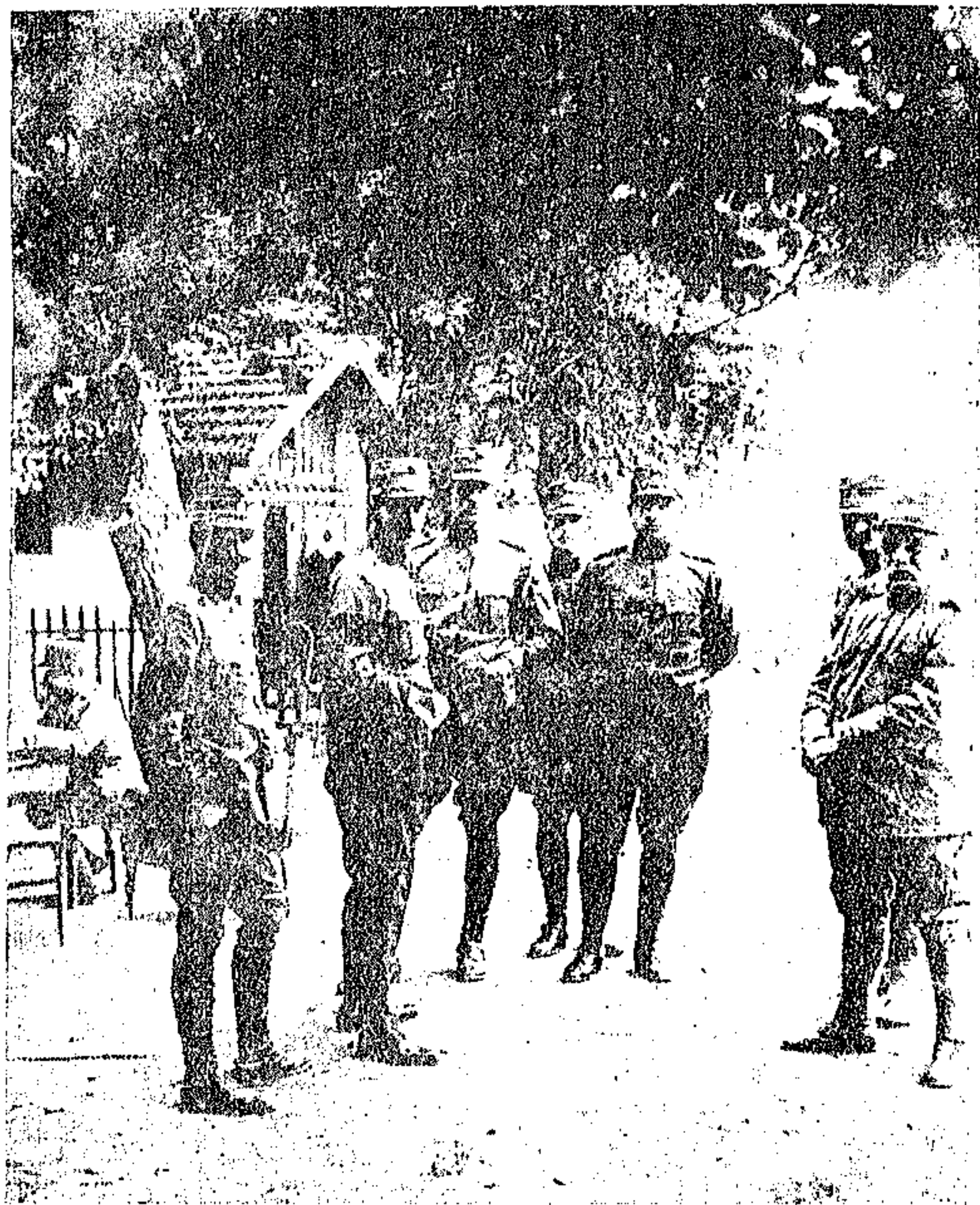
1913. ΕΛΛΗΝΟΒΟΥΛΓΑΡΙΚΟΣ ΠΟΛΕΜΟΣ

Τὸ Γενικὸν Στρατηγεῖον εἰς σιδηροδρομικὸν σταθμὸν.