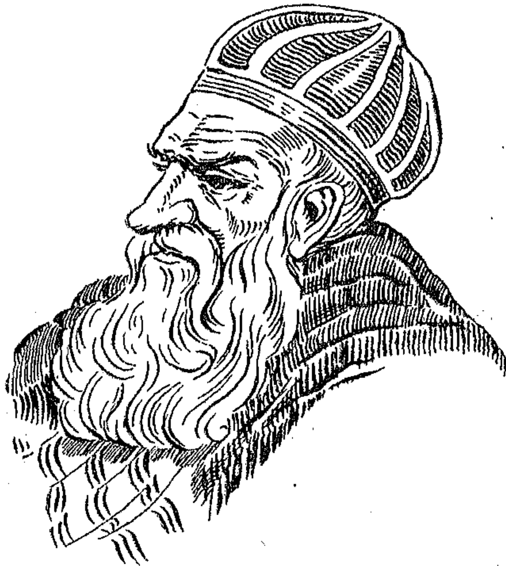
Ο ΑΛΗ ΠΑΣΑΣ

Ὁ Πουκεβίλ ὅστις ἐπὶ Ἀλῆ Πασᾶ ἦτο Γενικὸς πρόξενος τῆς Γαλλίας εἰς τὰ Ἰω- άννινα καὶ ἐγνώρι- σεν ἐκ τοῦ σύνεγγυς τὸν Ἀλῆ, ἀναφέρει ἄλλην ὑπόθεσιν ἡ ὁ- ποία σχετίζεται πάλιν μετὰ θησαυρῶν. Ἀλλὰ αὐτὴ ἡ ὑπό- θεσις ἀφορᾷ θησαυ- ρὸν τὸν ὁποῖον ὁ με- τέπειτα τύραννος τῶν