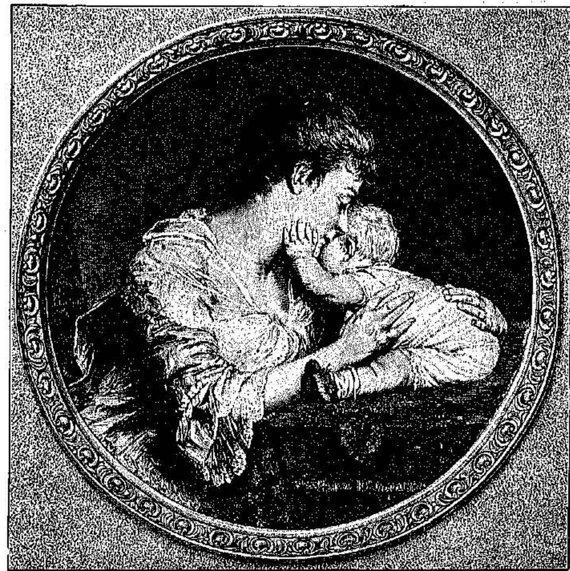
ΕΡΩΣ ΠΡΩΤΟΓΕΝΗΣ, Ἑκλογίαν Ἐδ. Κλινσλ.

Ἐάν γδὴ στραφῶμεν πρὸς τὰ ἀνάλογα φαινόμενα τῶν συνήθων ἐνυπνίων, εὐρίσκομεν τὸ αὐτὸ γνώρισμα τῆσ συμπεκνώσεως τῶν παραστάσεων εἰς ὀρισμένον τι εἶδος τῶν ἡμετέρων ἐνυπνίων, τὸ ὁποῖον δὲν εἶνε σπάνιον, καὶ ἐπειδὴ δύναται γὰρ προκληθῆ καὶ διὰ τεχνητῶν μέσων, εἶνε ἐκάστοτε προσιτὸν καὶ εἰς πᾶσαν πειραματικὴν παρατήρησιν. Δαρβίνος ὁ πρεσβύτερος ἔγραψεν ἤδη ἐν τῇ „Ζωονομίᾳ“ του, ὅτι ἐξωτερικὰ ἐντυπώσεις, προξενόμενα εἰς τὴν συνείδησιν τοῦ ὄνειρευομένου καὶ ἐν τῷ μετὰ τὸ ἀφουπνίζουσαι αὐτόν, δύνανται ἢ ὀποβάσιν ἀφορμὴ μακροῦ καὶ μεγάλου πλοκῆν ἔχοντος