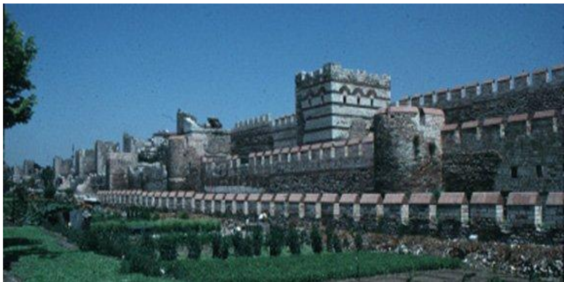
(Ηλεκτρονική αναπαράσταση του τείχους της Κωνσταντινούπολης από την UNESCO)