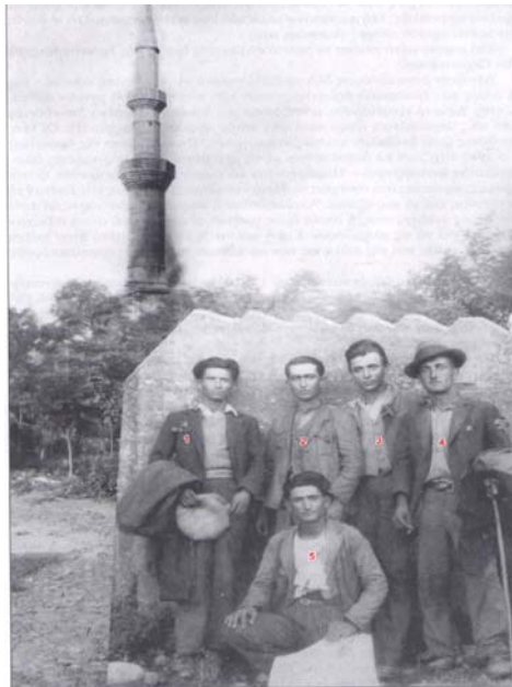
1934. Περιοιταίοι γεωλόγοι στο Διδυμότειχο.