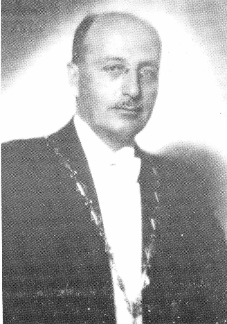
Στίλπων Π. Κυριακίδης (1887-1964)