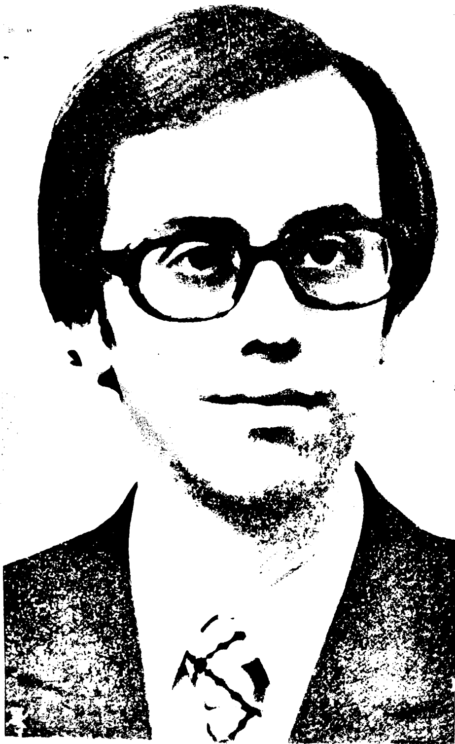
ΔΗΜΗΤΡΗΣ ΛΟΥΛΕΣ (1947—1991)