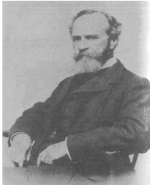
Εικόνα: Νο 10

Ο Κρόνος στον Goya (1820 – 1823): Ο W. James θαυμάζει το έργο του Ισπανού ζωγράφου ιδιαίτερα τους πίνακες της Μαύρης Περιόδου στην οποία ανήκει και η συγκεκριμένη απεικόνιση.