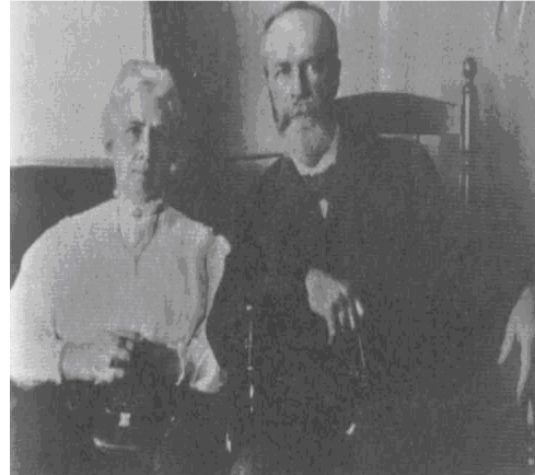
Η Alice και ο William James το 1904