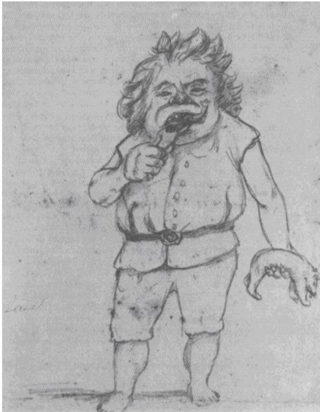
Εικόνα: Νο 7

“Orge”: Σκίτσο που θυμίζει το μυθολογικό Κρόνο με τις προκείμενες του κανθαλισμού, συμβολισμού και του μυθολογικού στοιχείου με έντονο το στοματικό – oral στοιχείο της μορφής.