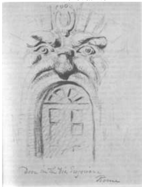
Εικόνα: Νο 2

“Doorway in the Via Gregoriana”, Πρόκειται για μια αρχιτεκτονική αποτύπωση που θυμίζει ένα κραυγάζοντα άνθρωπο ή μια ιδιότυπη πρόσκληση του θεατή στο βάνανσο και ζοφώδη κόσμο του καλλιτέχνη James, η εξώθυρα είναι μια ανάσα ενώπιον του και απολύτως στα μέτρα αυτού.