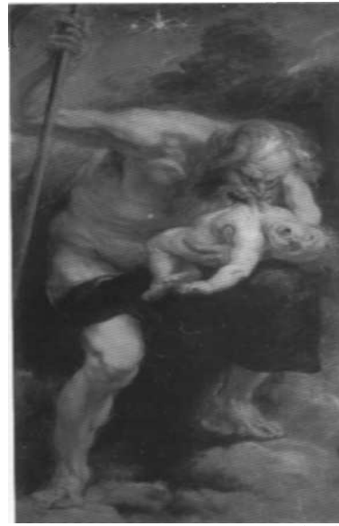
Εικόνα: Νο 8

Αποτύπωση του Κρόνου στον Peter Paul Rubens (Saturn 1636 – 1638).