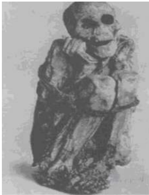
Mummy (Peru): Η μούμια που ευρίσκεται στο Μουσείο του ανθρώπου στο Παρίσι και αποτελεί την εικόνα με την οποία παραλληλίζει ο φιλόσοφος τον επιληπτικό νέο του ασύλου.