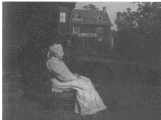
Η Eliza Putnam Gibbens, πεθερά του φιλοσόφου στην κατοικίας της στην 101 η Irving Street στο Cambridge, στην οποία αφιέρωσε τις Παραλλαγές της θρησκευτικής εμπειρίας .