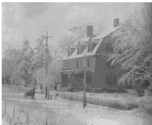
Εικόνα: Νο 3

Η οικία των Jameses, στην Irving Street 95, στο Cambridge, το 1890.