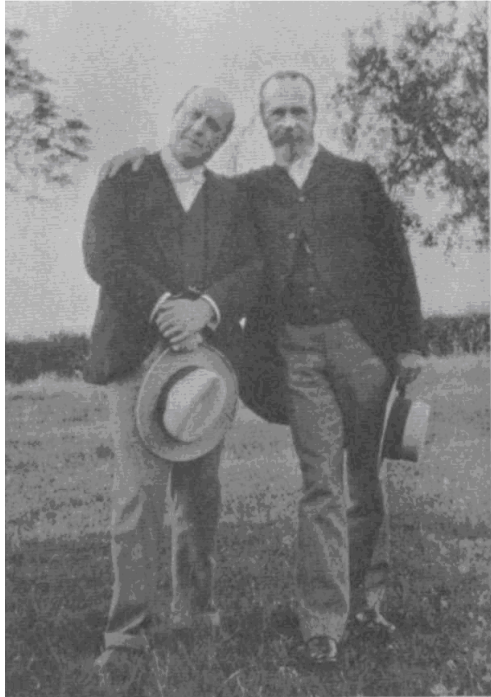
Ο Henry & William James στην Αγγλία