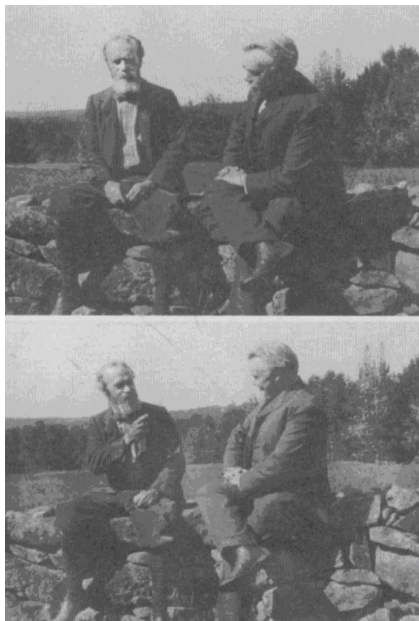
Josiah Royce & W. James στην εξοχική κατοικία του δευτέρου στο New Hampshire τον Σεπτέμβριο του 1903. Ο φιλόσοφος λέγει εδώ χαρακτηριστικά: “Royce you are photographed look out, I say damn the Absolute”