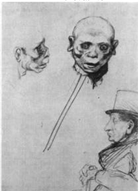
Εικόνα: Νο 1

“Cadaver and Burger”. Ο William James απεικονίζει συχνά πρόσωπα με εστιακή αναφορά στα μάτια και στο στόμα τους, στο συγκεκριμένο σκίτσο από μελάνι, ο ίδιος σημειώνει το 1890: «πολυσχιδείς ανθρώπινοι τύποι, δυνάμει παρόντες και δρώντες όπισθεν της συνήθους προσωπικότητας».