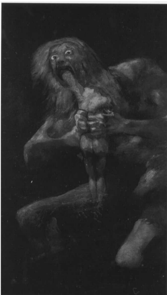
Εικόνα: Νο 9

Ο Κρόνος στον Goya (1820 – 1823): Ο W. James θαυμάζει το έργο του Ισπανού ζωγράφου ιδιαίτερα τους πίνακες της Μαύρης Περιόδου στην οποία ανήκει και η συγκεκριμένη απεικόνιση.