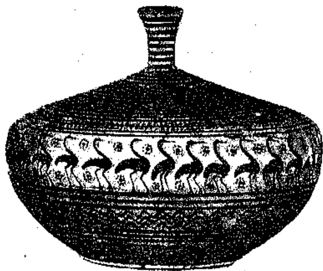
Εἰκ. Ἀρ. 6.

ποὺ ὅμοια μετὰ τὴν ὑστερορωμαϊκὴ τὴ θεωροῦσαν ὡς τότε γιὰ πρωτόγονη καὶ βάρβαρη τέχνη.