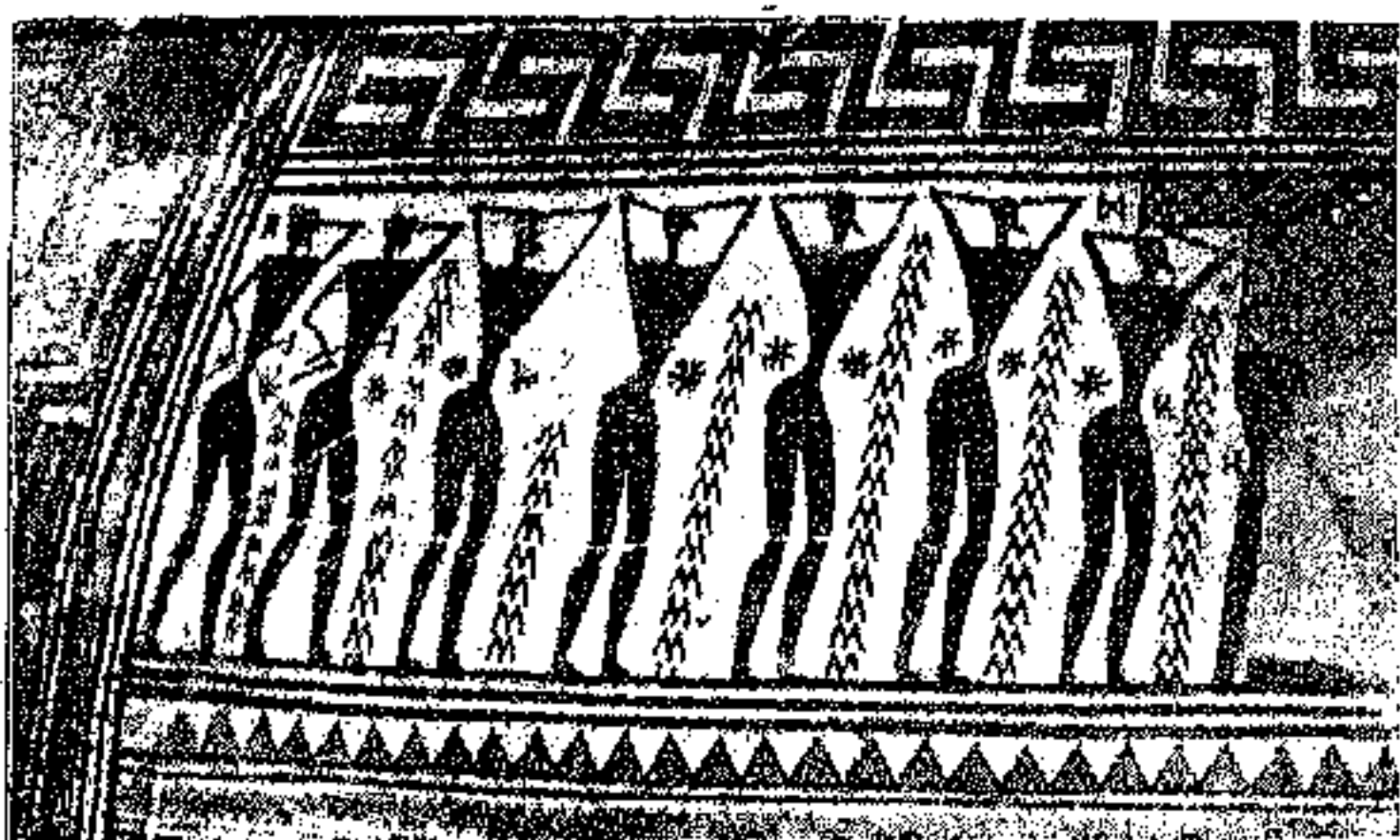
Εἰκ. Ἀρ. 4

Στὸ μεγάλο ἀγγεῖο τῆς Γεωμετρικῆς ἐποχῆς (Εἰκ. 3 καὶ 4), ποὺ βρέθηκε στὸν Κεραμεικὸ, ἔχουμε τὴν ἀνώτερη μορφή τῆς ἀφαίρεσης. Ὅλο τὸ σῶμα του εἶναι γιομάτο ὀριζόντια γραμμὰ κοσμήματα, μαίανδρους, τρίγωνα. Τὰ κυκλικὰ κοσμήματα, οἱ καμπύλες, ἀποφεύγονται συστηματικὰ, οἱ κύκλοι τετραγωνίζονται. Ἡ παράσταση συγκεντρώνεται σ' ἓνα μικρὸ χῶρο ἀνάμεσα στὶς λαβὲς τοῦ ἀγγείου καὶ εἶναι σχετικὴ μὲ τὴ χρήση του. Ἐπειδὴ τὰ ἀγγεῖα αὐτὰ ἦταν βαλμένα πάνω στὸν τάφο σὰν «σῆμα», σχεδιάστηκε μιὰ πρόθεση νεκροῦ, ἡ ἔκθεση του στὸ σπίτι καὶ τὸ κλάψιμο του ἀπὸ τὶς μοιρολογητρες καὶ τοὺς συγγενεῖς. Ἔτσι ποὺ