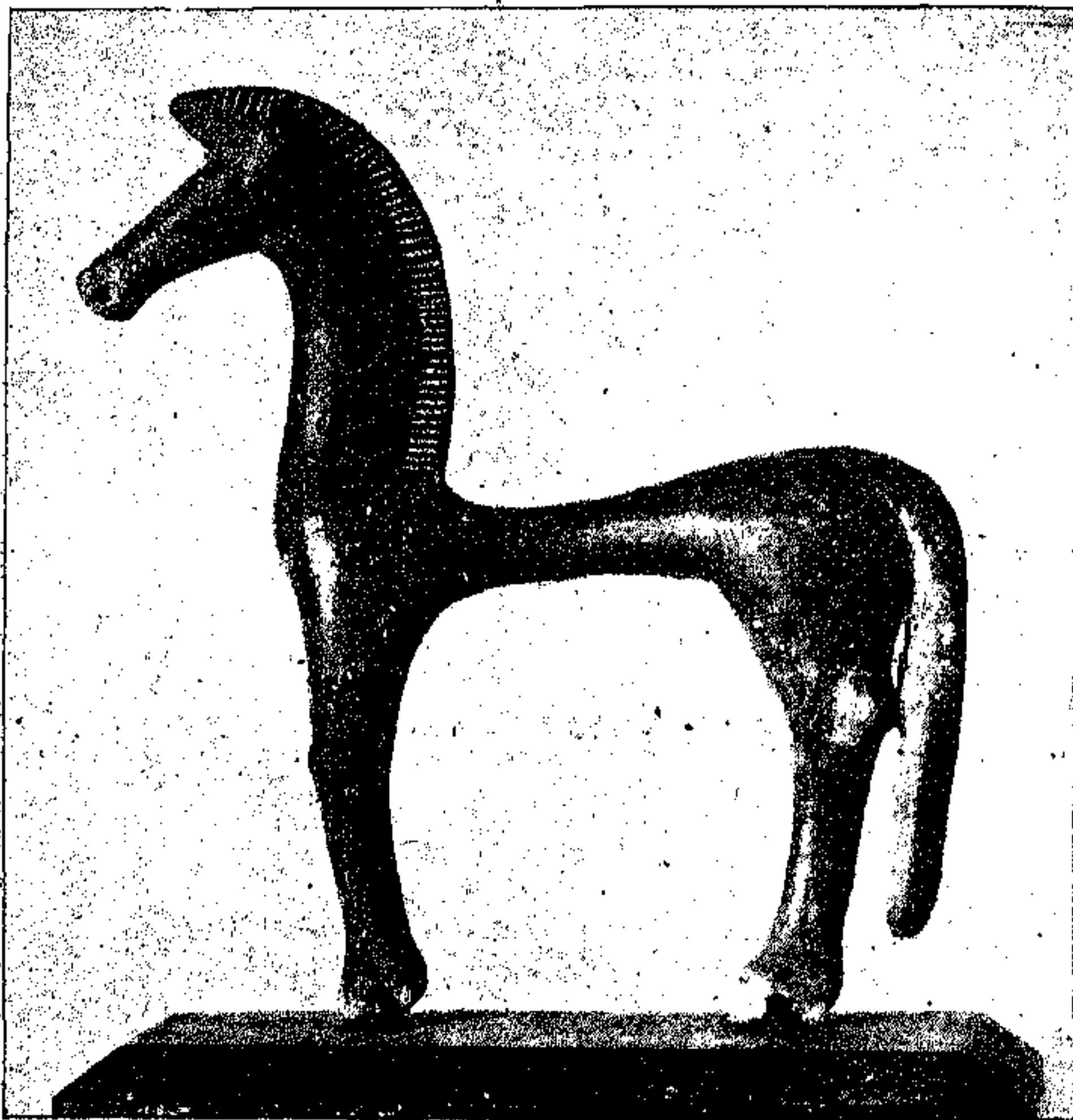
Εικ. 'Αρ. 7

"Έχουμε όμως αρκετά μικρά αγαλματάκια, αφιερώματα σε θεούς ή νεκρούς.