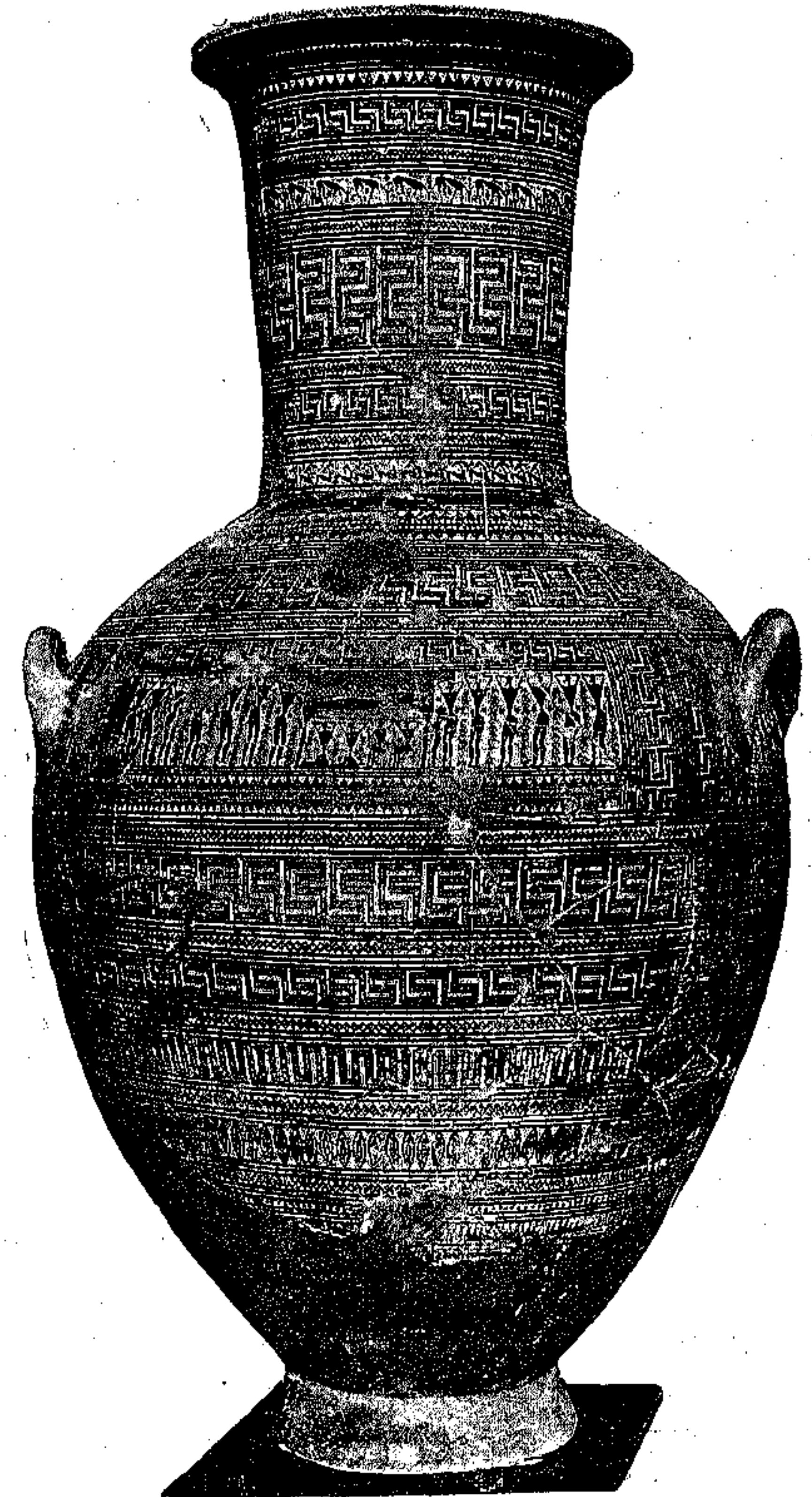
Είχ. 'Αρ. 3