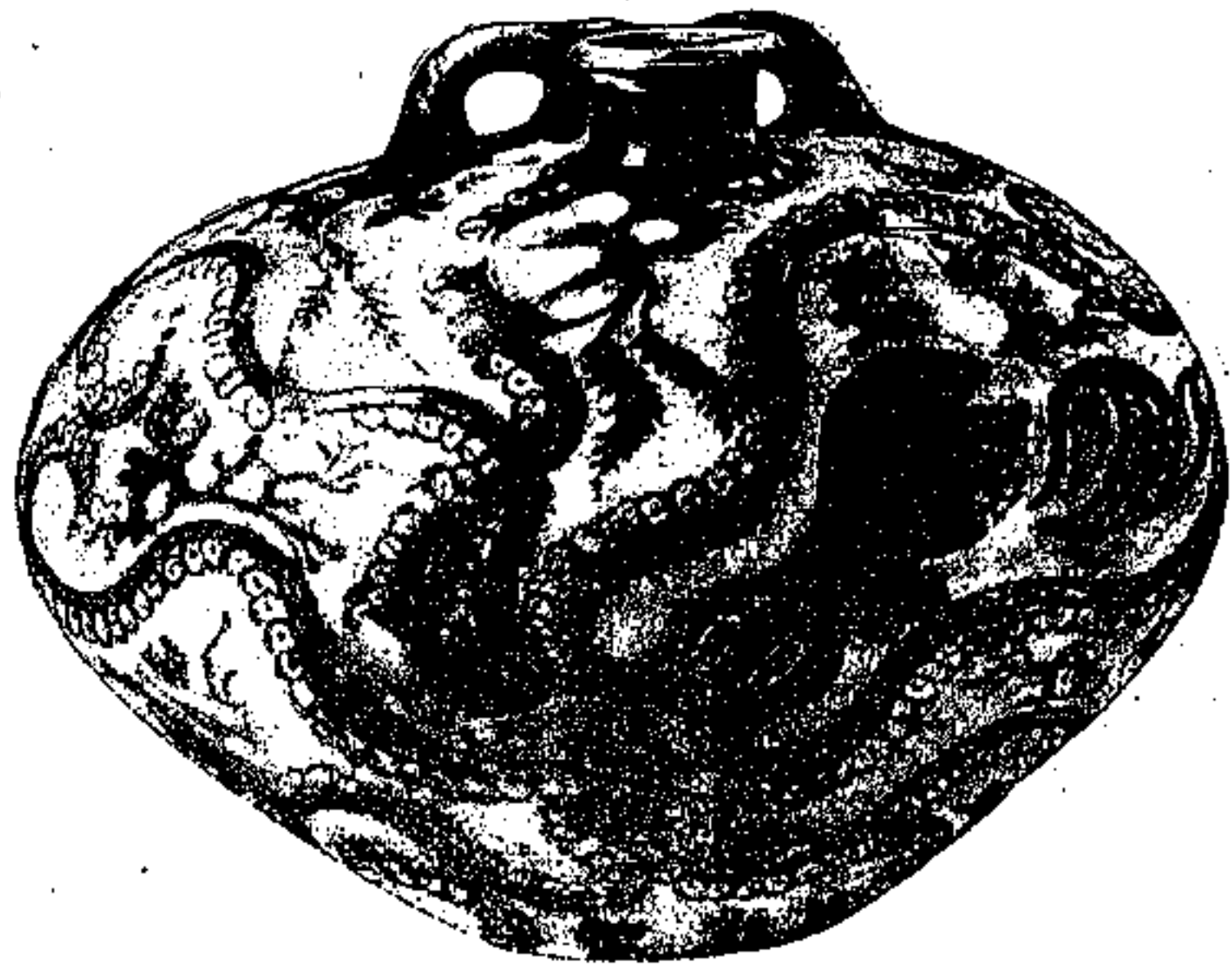
Είχ. 'Αρ. 1

Στο τέλος όμως της Μυκηναϊκής εποχής ο καλλιτέχνης δεν έχει για τον έξω κόσμο την ίδιαν αίσθηση και γι' αυτό ούτε το ίδιο στυλ. Το ίδιο πράγμα, το χιαπόδι, πάβει πιά να είναι γι' αυτόν το ζωντανό πλάσμα, που ήταν για τον παλιό-