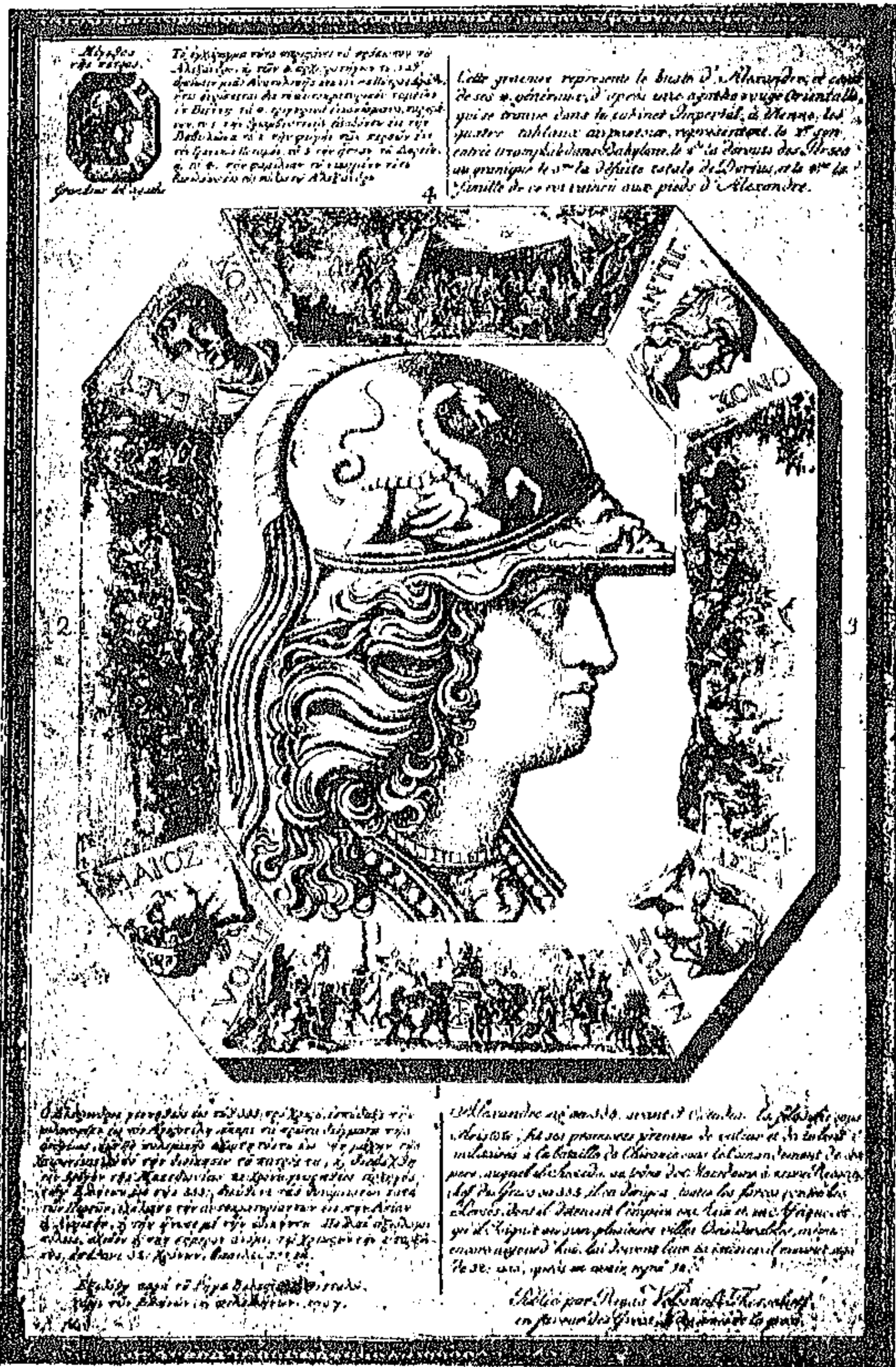
Ο ΜΕΓΑΣ ΑΛΕΞΑΝΔΡΟΣ ΤΟΥ ΡΗΓΑ

ταύτην παραλαβὼν ἐκ τῆς πατρικῆς βιβλιοθήκης εἶχον ἀποκειμένην παρ' ἐμοὶ ἄχρηστον ἐπὶ χρόνον μακρόν· ὅτε δὲ τὸ πρῶτον ἐδέησε νὰ μεταχειρισθῶ αὐτὴν ἡτύχησα νὰ εὔρω ἐν αὐτῇ δίκην ἄλλου ἑρμαίου τὸ δεύτερον νῦν γινωσκόμενον ἀντίτυπον τῆς εἰκόνας τοῦ Ῥήγα. ὅπερ ἢ ὁ ἐμὸς πατὴρ ἢ ἄλλος τις Ἰσως, παρ' οὐ εἶχε προμηθευθῆ τὴν εἰρημένην ἐφημερίδα, εἶχε φροντίσει νὰ συνδέσῃ μετ' αὐτῆς, ἅτε φερούσης τὸ ὄνομα τοῦ πρωτομάρτυρος.