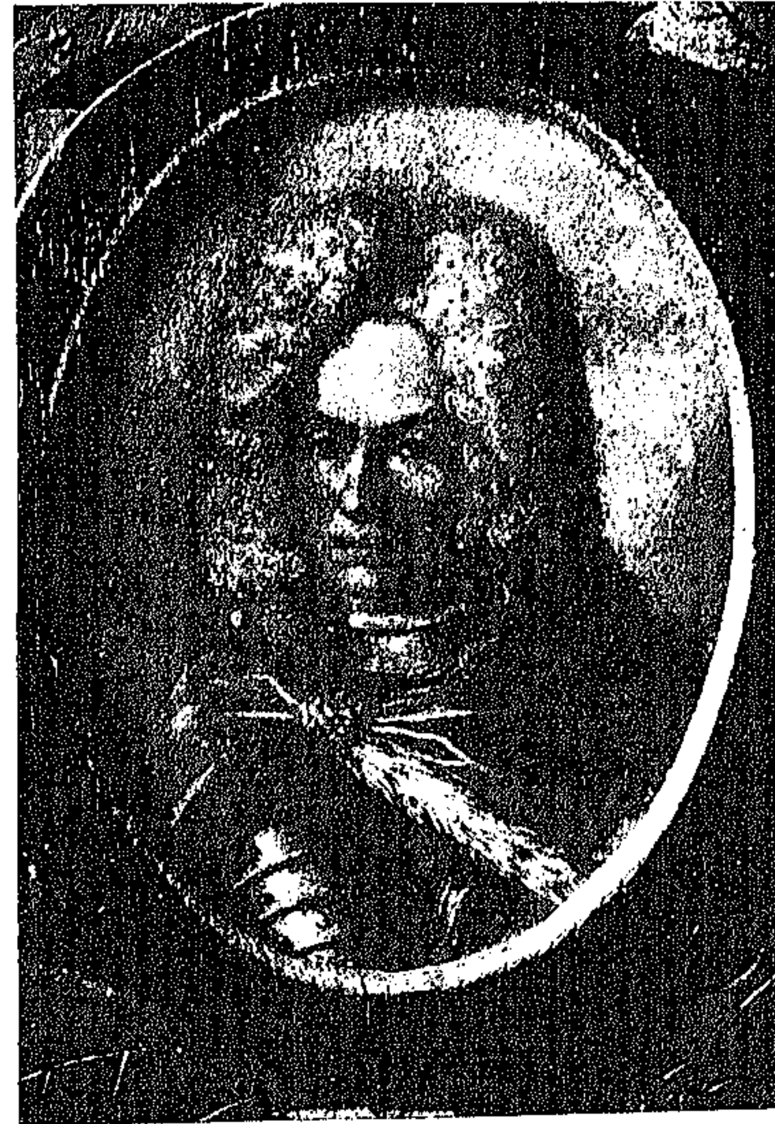
Η ΕΝ ΤΗ ΙΣΤΟΡΙΚΗ ΕΤΑΙΡΕΙΑΙ ΖΩΓΡΑΦΙΑ ΤΟΥ ΔΟΞΑΡΑ Η ΠΑΡΙΣΤΑΝΟΥΣΑ ΤΟΝ ΚΟΜΙΤΑ SCHULENBURG