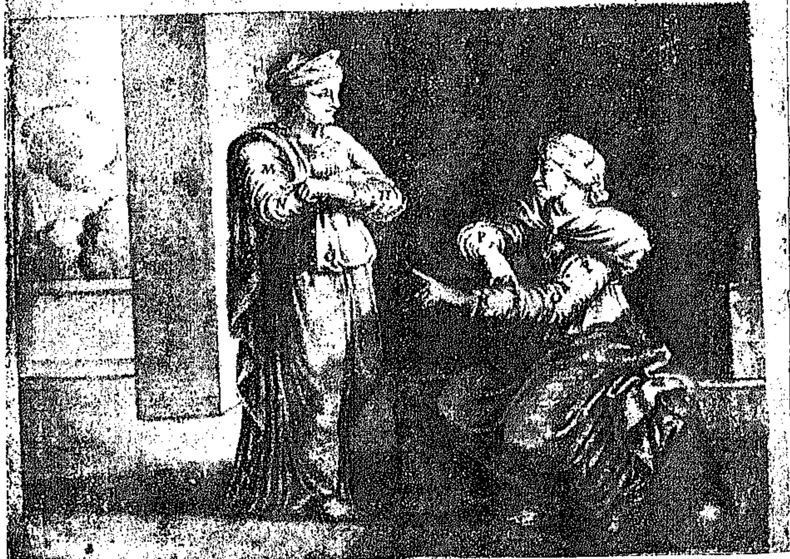
ΠΑΝΟΜΟΙΟΤΥΠΟΝ τοῦ φ. 99 α τοῦ ἐν τῇ Ἑθνικῇ Βιβλιοθήκῃ Ἀθηνῶν ἐπ' ἀρ. 1285 αὐτογράφου κώδικος τοῦ Παναγιώτου Δοξαρά.