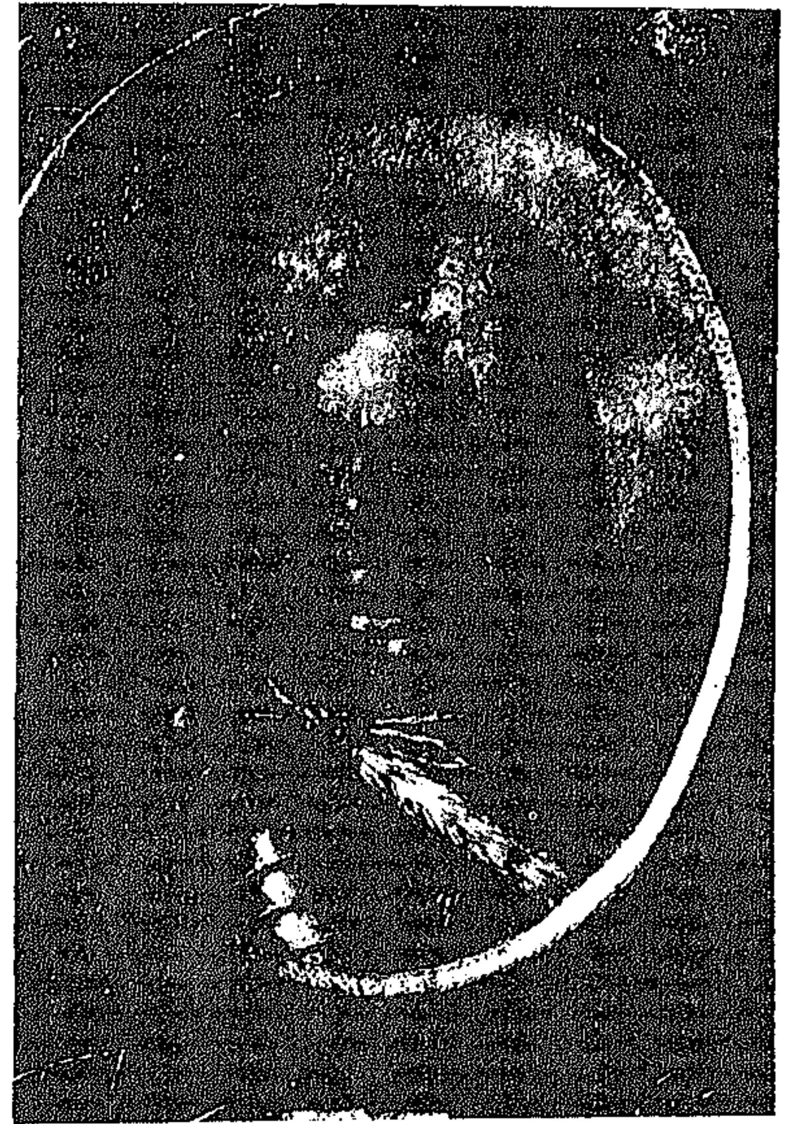
Ζωγραφία τοῦ κόμισος Ἰωάννου von Schulenburg ὑπὸ Παναγιώτου Δοξαρά.

τῆς ζωγραφίας τοῦ Δοξαρά εὐκαιρον κρίνω νὰ σημειώσω, ὅτι προσεχῶς ἐλπίζω νὰ δυνηθῶ νὰ παράσχω εἰδήσεις καὶ περὶ